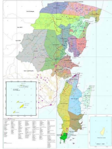
Gambar: 3.2 Peta Kabupaten Kotabaru

Kabupaten Kotabaru dibentuk menurut Undang-Undang Darurat No.3 Tahun 1953 tentang Pembentukan (resmi) Daerah Otonomi Kabupaten istimewa tingkat Kabupaten dan Kota Besar dalam wilayah Provinsi Kalimantan, dengan wilayah meliputi Kawedanan-kawedanan Pulau Laut Tanah Bumbu Selatan, Tanah Bumbu Utara dan Pasir. Kemudian setelah disahkan sebagai undang-undang, wilayah Kabupaten Kotabaru dikurangi dengan Kawedanan Pasir (Perwakilan Provinsi Kalimantan Selatan, 2022).