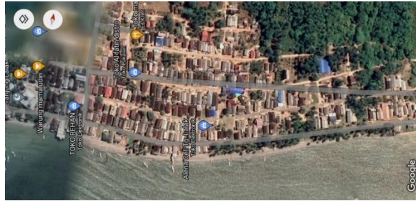
Gambar 3.3 Peta Desa Tanjung Lalak Utara

Penelitian dilaksanakan selama 18 bulan dimulai dengan survei lokasi penelitian selama satu bulan, penyusunan proposal selama empat bulan, pengajuan proposal selama satu bulan, pelaksanaan penelitian hingga pengumpulan data selama dua bulan, analisis data selama dua bulan dan penyusunan skripsi selama lima bulan.