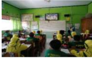
Gambar 5. Pembelajaran berbasis AR ( Augment Reality )

peserta didik melakukan reflektif mengenai pengalamannya dengan materi yang diajarkan.