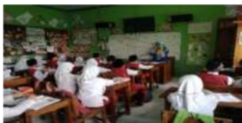
Gambar 4. Komunikasi efektif menggunakan microfone

Selain komunikasi efektif menggunakan alat bantu, guru juga melakukan komunikasi intruksional secara personal dengan perkataan yang lembut dan mudah dipahami, seperti meminta tolong untuk membung sampah pada tempatnya, meminta tolong untuk menutup kran air yang sudah digunakan. Sehingga menumbuhkan kesadaran pada individu peserta didik.