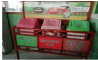
1 Gambar 3. Penyediaan tempat sampah 3 R ( Reuse, Reduce, Recycle ) c. Menumbuhkan motivasi individu guru dan peserta didik

Arahan melalui teknologi informasi yang berada pada lingkungan sekolah membuat proses pembelajaran berjalan secara efektif dan serentak, baik dalam awal dan akhir pembelajaran dengan kegiatan rutin membersihkan sampah akan membangun kebiasaan atau kepekaan pada individu guru dan peserta didik untuk senantiasa menjaga kebersihan sekolah, rumah dan dilingkungan.