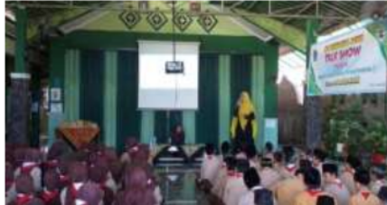
Gambar 7. Pembelajaran Kolaboratif

pada semester ganjil, sedangkan untuk kelas 1,2,3 pada semester genap. Selain itu juga mengemas pembelajaran terpadu efektif dan bermakna pada ekstem sekolah dimana peserta didik diajak ke berbagai tempat edukatif seperti peternakan sapi, kambing, ayam, kebun teh dll. Dengan pembelajaran kolaborasi akan memberikan pengalaman pembelajaran bagi peserta didik dan tentunya memberikan dampak pada peningkatan akademik dan kapasitas lembaga.