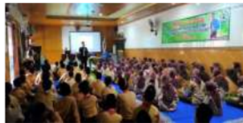
1 Gambar 4. Membangun motivasi diri guru dan peserta didik

Implementasinya, setiap guru baik yang memegang sebagai wali kelas maupun mata pelajaran diwajibkan menyampaikan motivasi/stimulus kepada peserta didik. Individu peserta didik dapat mengambil makna yang diberikan melalui motivasi yang diberikan untuk selalu meningkatkan belajarnya, membangun kesadaran individu peserta didik agar sadar pentingnya menjaga lingkungan dan disiplin waktu. Sehingga peserta didik memiliki karakter yang kuat dan memiliki hasil belajar yang baik. Disamping itu juga, menumbuhkan motivasi peserta didik untuk selalu berprestasi dengan pemberian reward atau apresiasi kepada peserta didik yang berprestasi. Dalam rangka untuk meningkatkan prestasi peserta didik setia tahun diadakan bulan bahasa yang dilaksanakan di bulan oktober, dimana peserta didik dapat berpartisipasi dalam berbagai lomba intern.