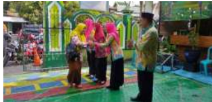
Gambar 2. Kepala madrasah menyambut guru yang hadir

Proses pembelajaran dikelas dimulai pukul 06.50 WIB. Seluruh peserta didik sudah berada di masing-masing kelas untuk melaksanakan rutinitas pagi dengan sholat dhuha berjamaah, bila ada peserta didik maupun guru yang terlambat akan mendapatkan punishment . Nama peserta didik yang terlambat hadir dimadrasah akan dicatat di buku terlambat yang berada di pos satpam dan dishare ke forum grup whatshap orang tua wali kelas, sehingga akan memberikan motivasi kepada orang tua wali murid yang lain untuk bisa megantar peserta didik datang tepat waktu. Sedangkan jika guru yang datang terlambat akan mendapatkan punishment berupa pemotongan uang absen yang didapatkan setiap harinya. Sehingga memberikan motivasi untuk tidak datang terlambat. Pemberian punishment dilakukan agar proses pembelajaran dapat berjalan tepat waktu dan tidak menjadi kebiasaan, punishment sebagai alat untuk menanamkan karakter disiplin kepada semua elemen sekolah.