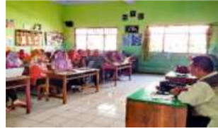
Gambar 1. Kegiatan Supervisi Klinis

dan pengintegrasian kurikulum baik dilaksanakan pada internal lembaga maupun kegiatan eksternal. Selain mendelgasikan, kepala sekolah juga membuat program peningkatan kapasitas guru secara interal dan mengaktifkan KKG internal yang dilaksanakan secara berkala setiap minggu sekali.