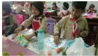
Gambar 6. pembelajaran kreatif dan menyenangkan

Ustadz/ustadzah menguasai model-model pembelajaran dan ketika melaksanakan pembelajaran dikelas, untuk mencapai pembelajaran efektif ustadz/ustadzah biasanya mengkombinasikan dari beberapa model-model pembelajaran dalam satu kegiatan dengan menggunakan berbagai bentuk media belajar dan sumber belajar. Sepertihalnya, media pembelajaran yang mempunyai panjang dan lebar, tiga dimensi dan media proyeksi. Dengan mengkombinasikan berbagai model pembelajaran dan media ramah anak dan lingkungan yang didayagunakan sehingga dapat membangkitkan motivasi peserta didik untuk meningkatkan prestasi belajar serta mengurangi kejenuhan dan kebosanan dalam belajar.