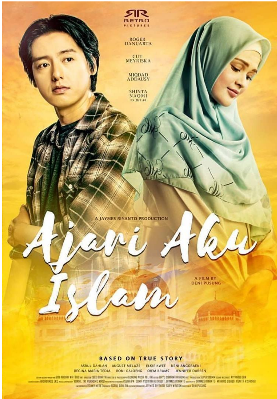
Poster Film Ajari Aku Islam