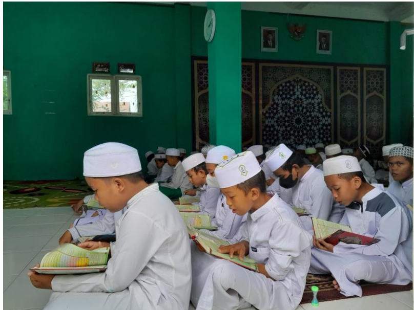
Gambar 4.3 Klasikal Pembacaan Amaliyah Al-Qur'an

“Bentuk aktivitas keagamaan pembacaan amaliyah yang dilakukan santri pada umumnya sangat banyak, kegiatan santri yang dilakukan dapat dikatakan sudah cukup baik.” 9