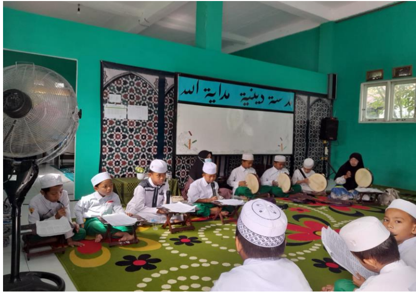
Gambar 4.8 Pembacaan Maulid Habsyi

Hal ini pendekatan budaya yang dilakukan ustaz dan ustazah ikut berpartisipasi dalam tradisi keagamaan, bisa dilihat dari penjelasan di atas bahwa ustaz dan ustazah ikut berperan dan berpartisipasi dengan tradisi keagamaan seperti burdahan dan maulid habsyi.