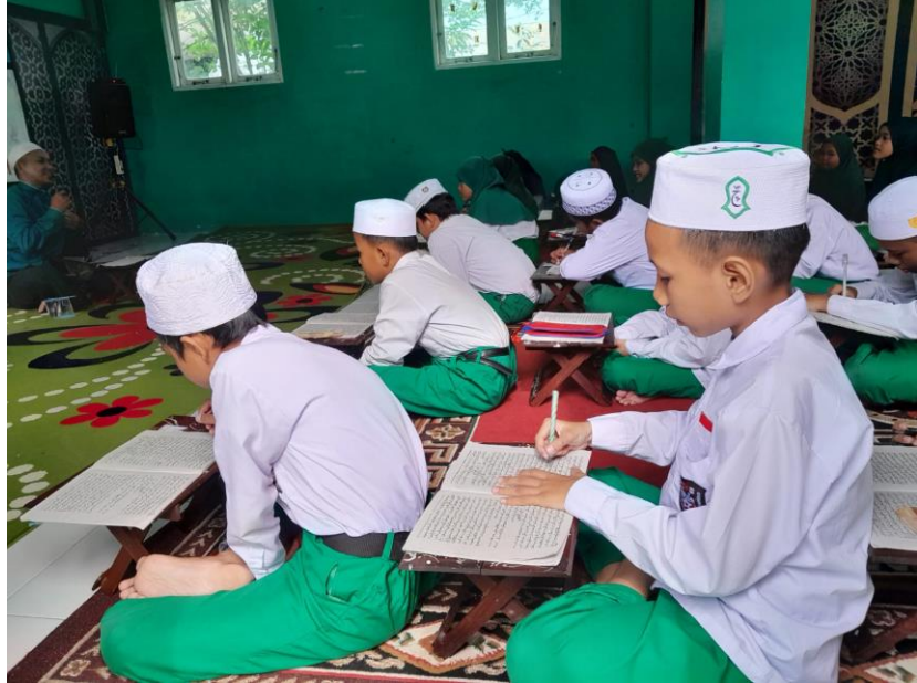
Gambar 4.7 Pembelajaran Kitab Akhlaqullibanin

berjamaah, setelah itu dilanjutkan dengan kegiatan belajar membaca Al-Qur'an dengan metode iqra.” 21