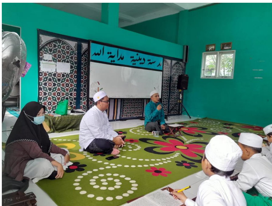
Gambar 4.5 Taklim

Banyaknya aktivitas keagamaan yang ada di madrasah tersebut para santri harus mengikutinya. Berdasarkan hasil wawancara dengan para santri Madrasah Diniyah Hidayatullah: