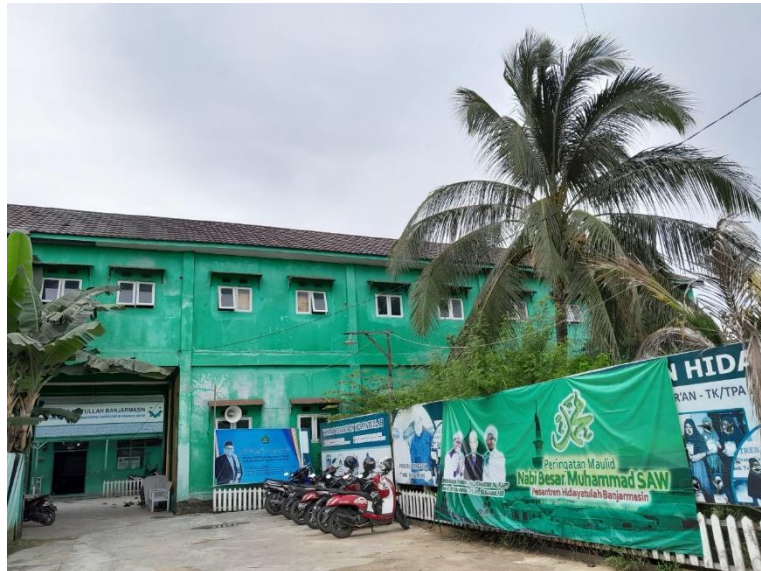
Gambar 4.2 Madrasah Diniyah Hidayatullah Banjarmasin