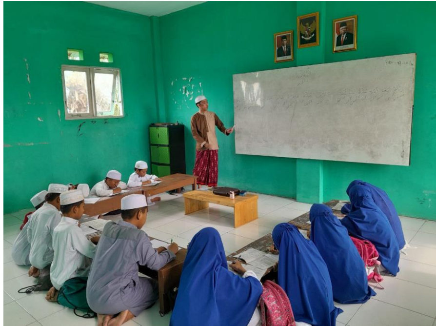
Gambar 4.4 Pembelajaran Kitab