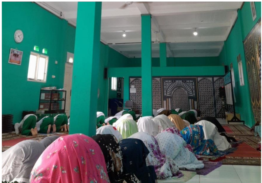
Gambar 4.6 Salat Ashar Berjamaah

“Di madrasah ini diwajibkan untuk santri salat ashar berjamaah di mushalla, biasanya saya yang disuruh adzan dan iqomah, awalnya saya tidak bisa tapi karena niat belajar dan disuruh adzan dan iqomah terus menerus jadinya saya bisa.”