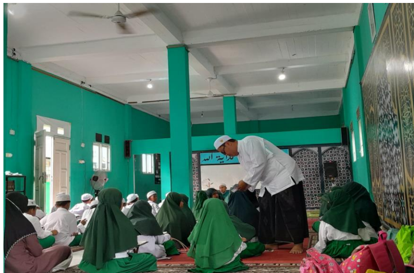
Gambar 4.9 Sedekah Jum'at

“Pendekatan ekonomi ini menyalurkan bantuan dari orang tua asuh atau donatur untuk para santri yang tidak mampu seperti berupa sembako, zakat, dan lain sebagainya. Pada pelaksanaan tersebut seringkali yang kami tanamkan kepada santri ketika menerima bantuan sedikit ataupun banyak tidak lupa menyelipkan pengingat kata bersyukur. Sehingga dalam penyalurannya tidak ditemukan lagi santri yang banyak berharap lebih dari bantuan yang disampaikan kepada mereka.” 24