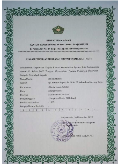
Gambar 4.1 Surat Keputusan Kementerian Agama

Madrasah Diniyah Hidayatullah merupakan lembaga pendidikan yang ada di Kota Banjarmasin. Lokasi Madrasah Diniyah ini berada di Jalan Kelayan A II Antasan Segera RT. 24 RW. 02 No. 67 Kelurahan Murung Raya Kecamatan Banjarmasin Selatan Kota Banjarmasin Provinsi Kalimantan Selatan berdasarkan keputusan Kantor Kementerian Agama Kota Banjarmasin No. 83 Tahun 2020.