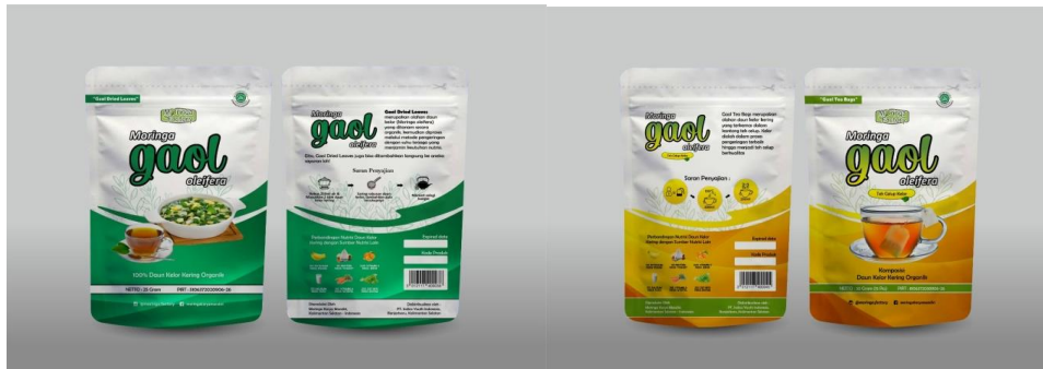
Gaol Tea Bags