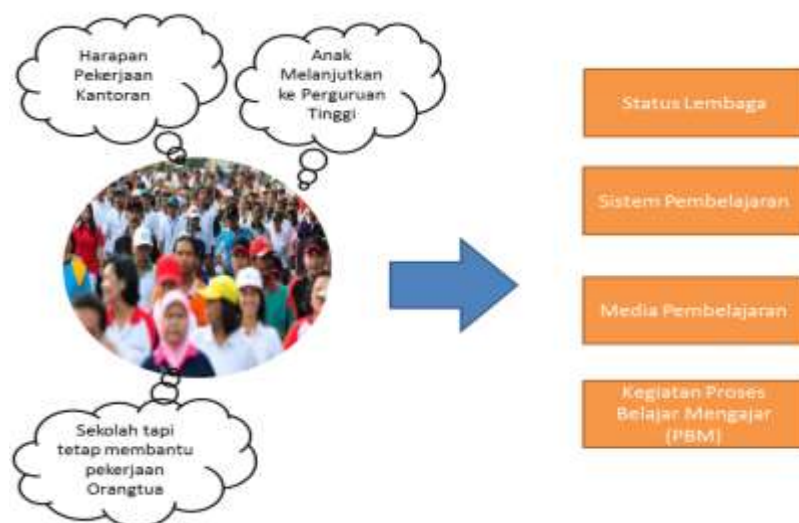
Gambar 7: Transformasi pesantren karena tuntutan masyarakat

Berdasarkan beberapa faktor yang berpengaruh pada transformasi pondok pesantren di Nagara maka faktor karena ketokohan lah yang paling dominan dalam transformasi tersebut. Hal ini sangat beralasan karena arah dan kebijakan jalannya pesantren tidak lepas dari peran seorang kyai atau tokoh yang berpengaruh di pondok pesantren tersebut.