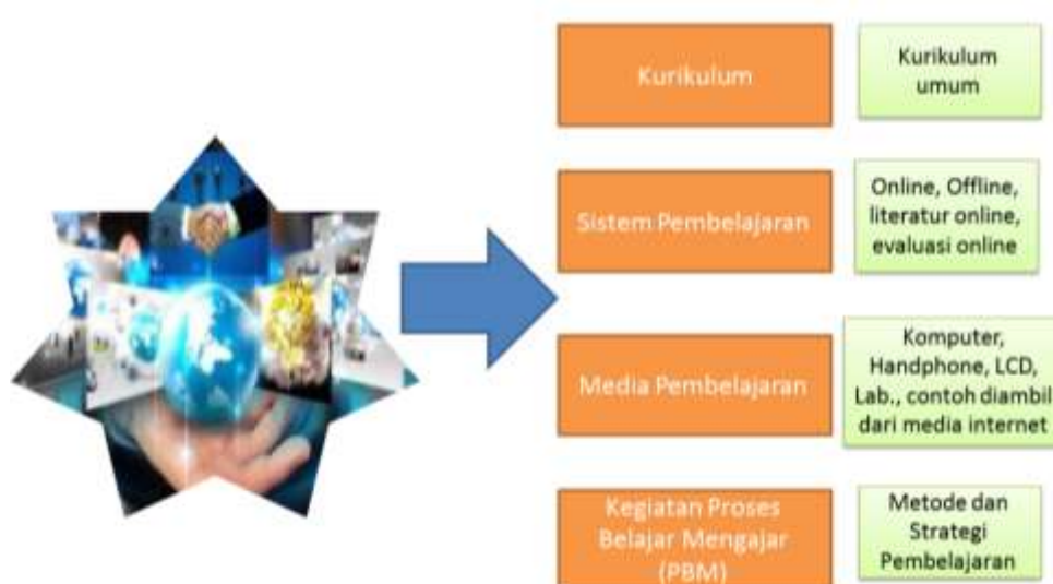
Gambar 5: Transformasi pesantren di era modernisasi

Selain tersebut di atas, juga dimanfaatkan untuk mencari dana pembangunan gedung Guest House dan Pusat Perbelanjaan dan sebagai pendaftaran santri baru.