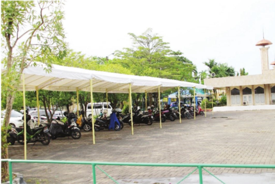
Area Parkir Sepeda Motor