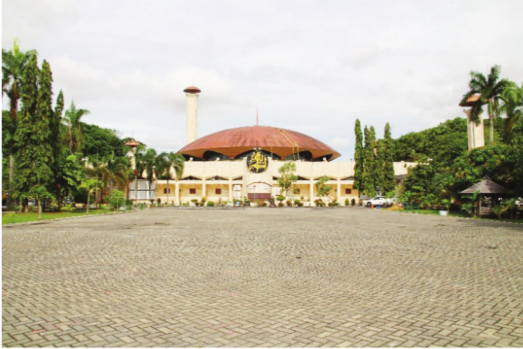
Halaman Belakang Masjid Raya Sabilal Muhtadin