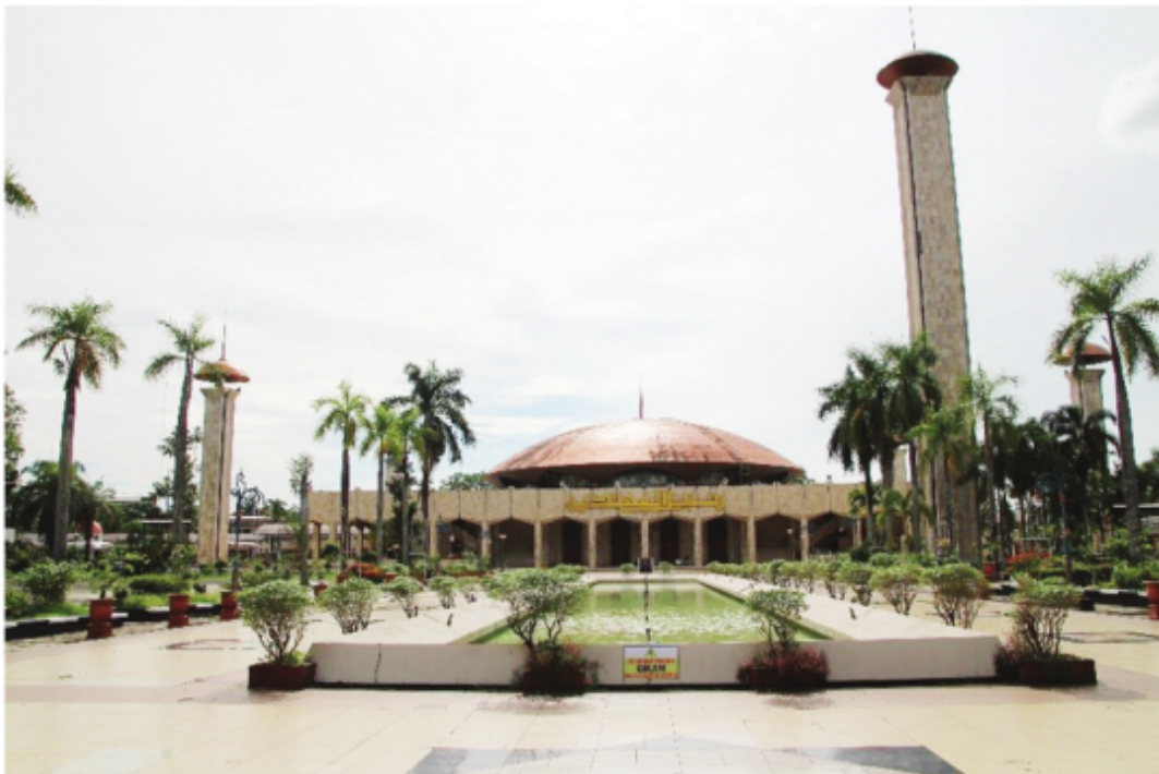
Foto Masjid Raya Sabilal Muhtadin dari Halaman Depan