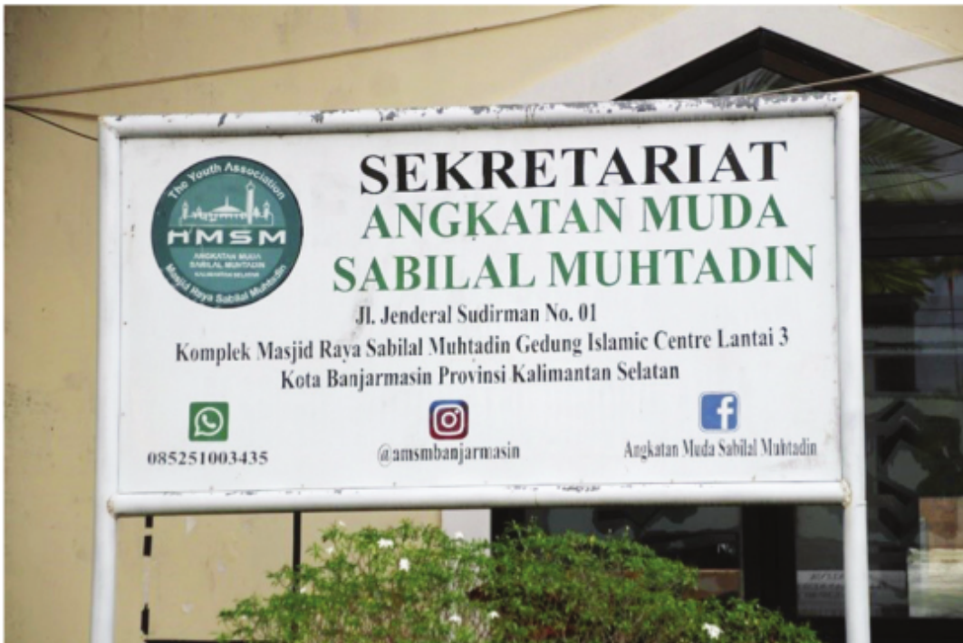
Kantor Sekretariat Angkatan Muda Sabal Muhtadin