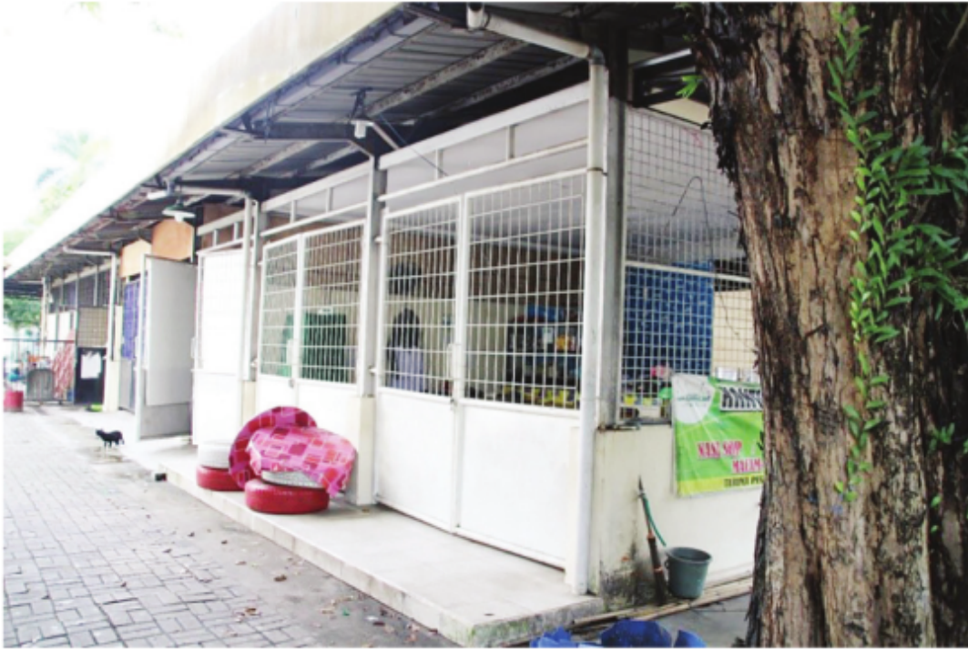
Area Kantin Masjid Raya Sabilal Muhtadin