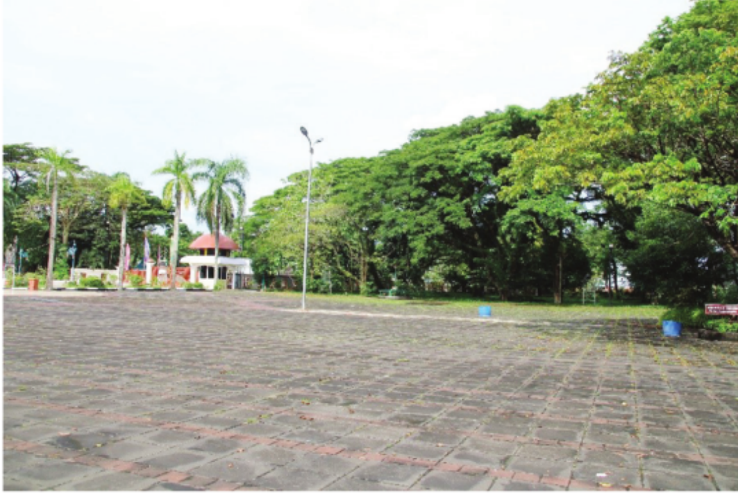
Area Hijau Masjid Raya Sabilal Muhtadin