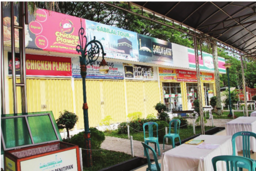
Area Pertokoan Sabilal Mart