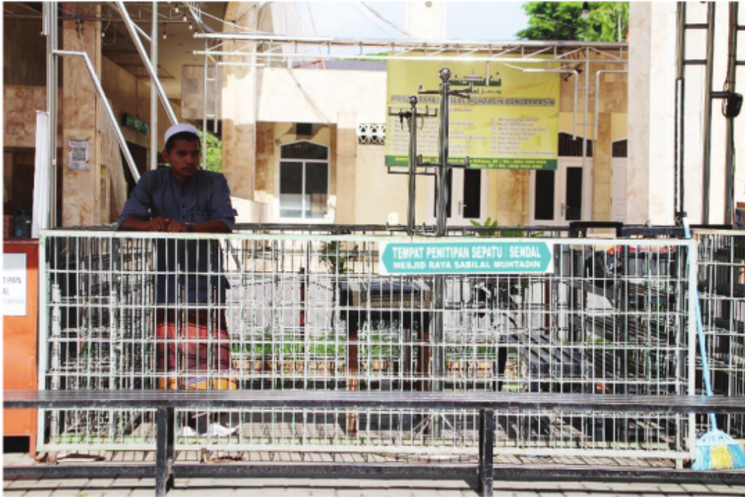
Area Penitipan Sepatu/Sandal Jamaah Masjid Raya Sabilal Muhtadin