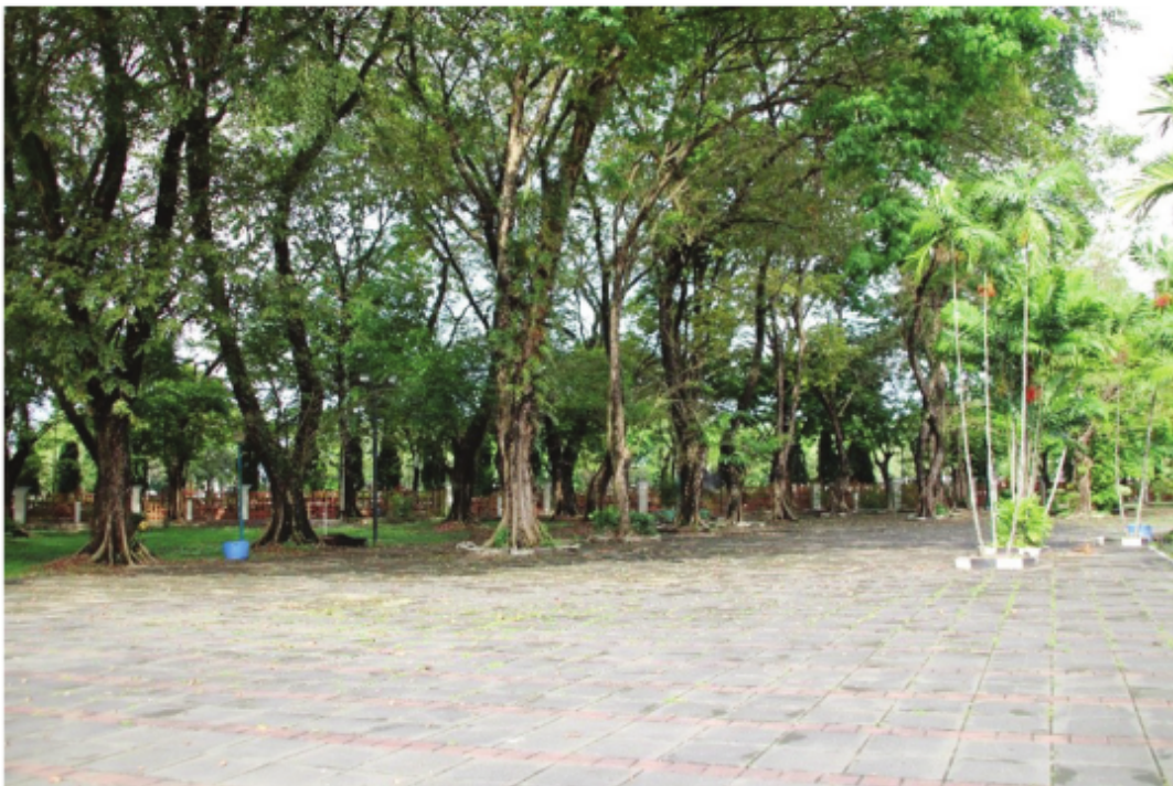
Area Hijau Masjid Raya Sabilal Muhtadin