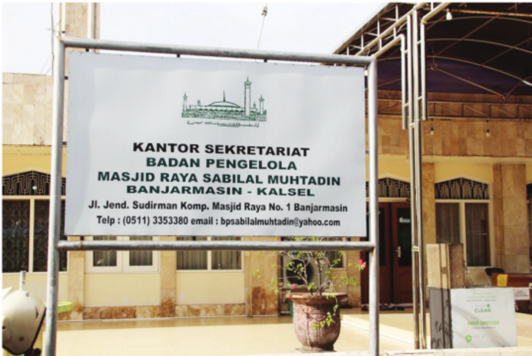
Kantor Sekretariat Badan Pengelola Masjid Raya Sabilal Muhtadin