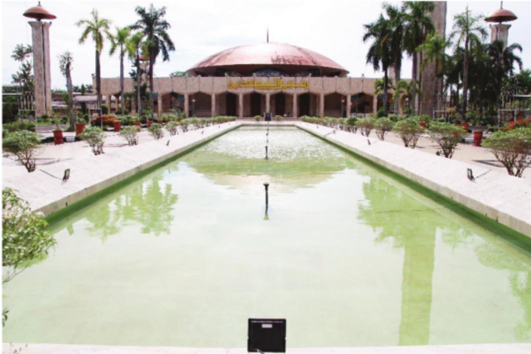
Halaman Depan Masjid Raya Sabilal Muhtadin