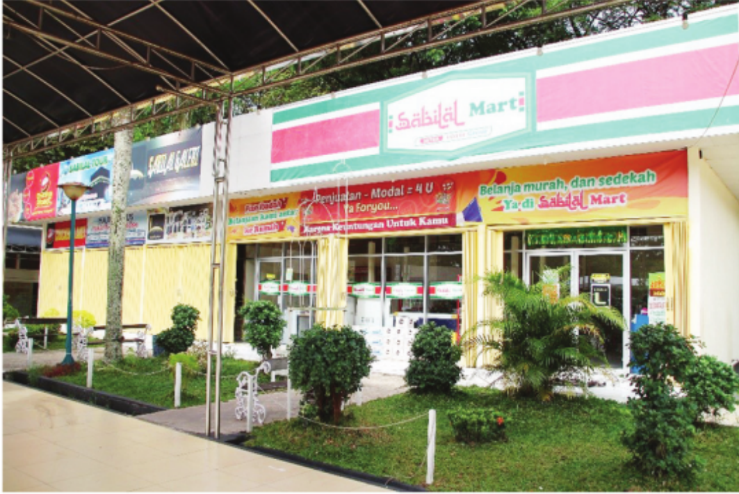
Area Pertokoan Sabilal Mart