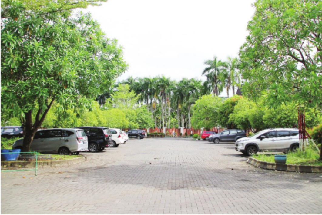
Area Parkir Mobil