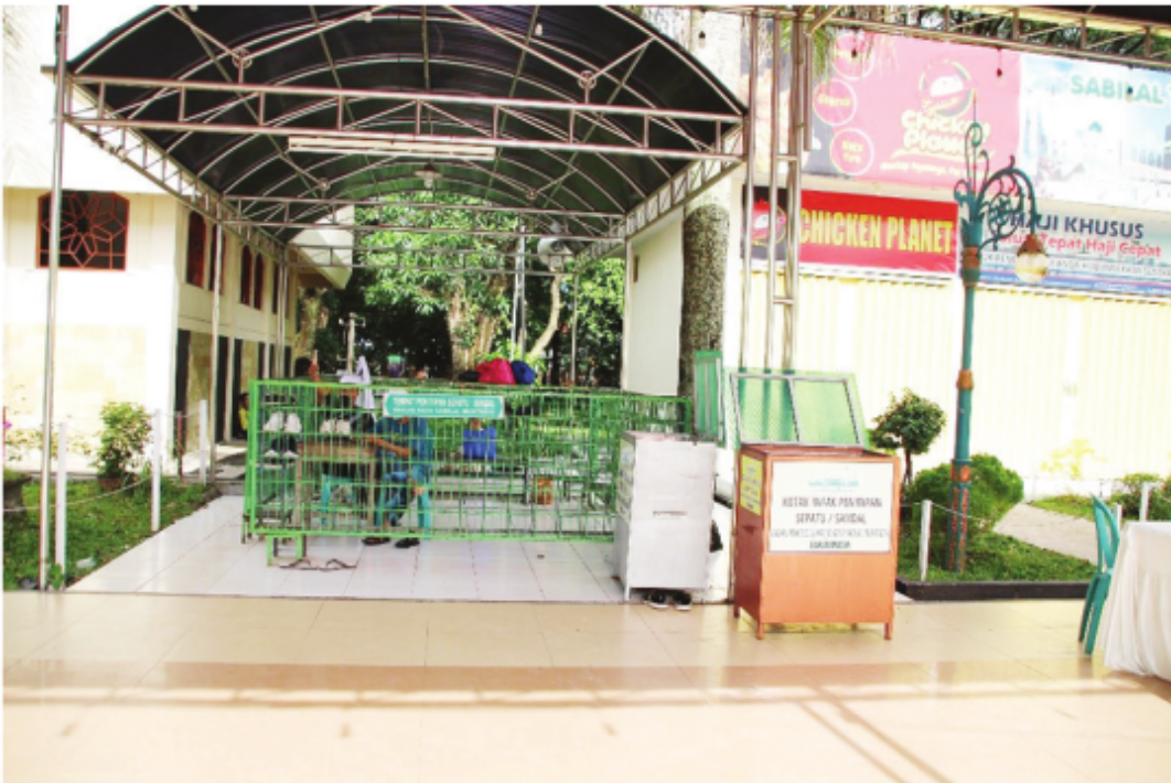
Area Penitipan Sepatu/Sandal Jamaah Masjid Raya Sabilal Muhtadin