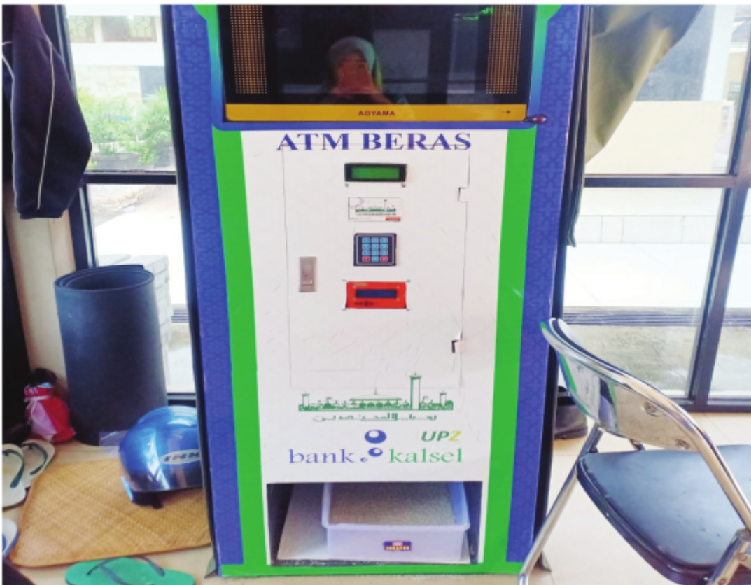
ATM Beras Untuk Masyarakat Ekonomi Lemah