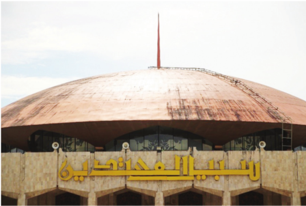
Kaligrafi Nama Masjid Raya Sabilal Muhtadin di Bagian Depan Masjid