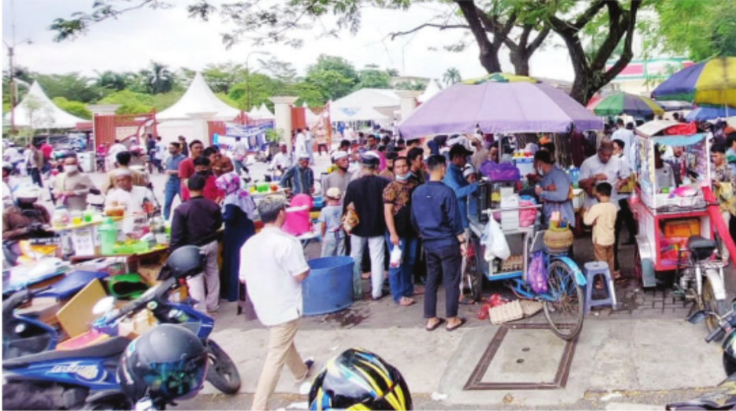
Area UMKM Masjid Raya Sabilal Muhtadin