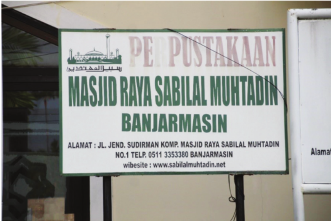
Perpustakaan Masjid Raya Sabilal Muhtadin