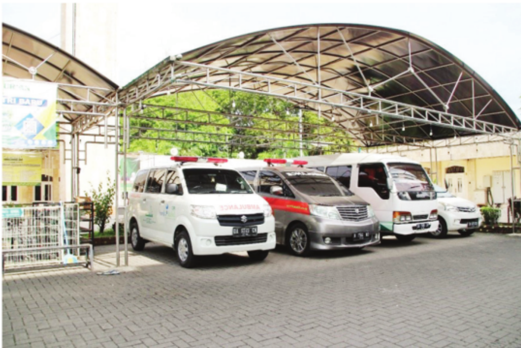
Armada Ambulans dan Mobil Jenazah Masjid Raya Sabilal Muhtadin