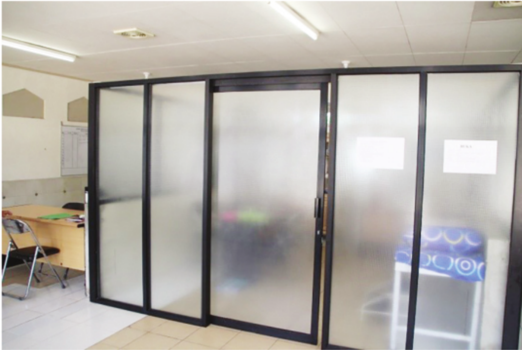
Ruang Fasilitas Klinik Sehat Masjid Raya Sabilal Muhtadin