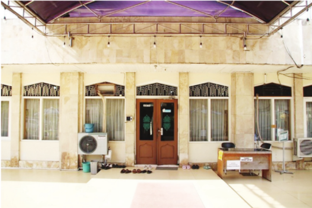
Kantor Sekretariat Badan Pengelola Masjid Raya Sabilal Muhtadin