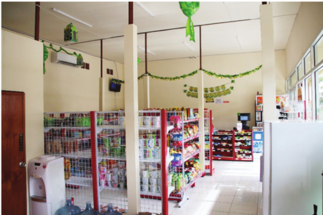
Interior Sablal Mart