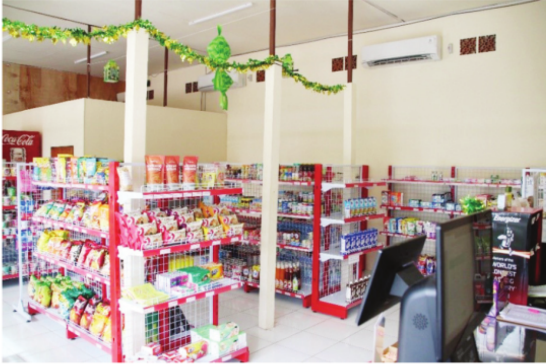
Interior Sablal Mart