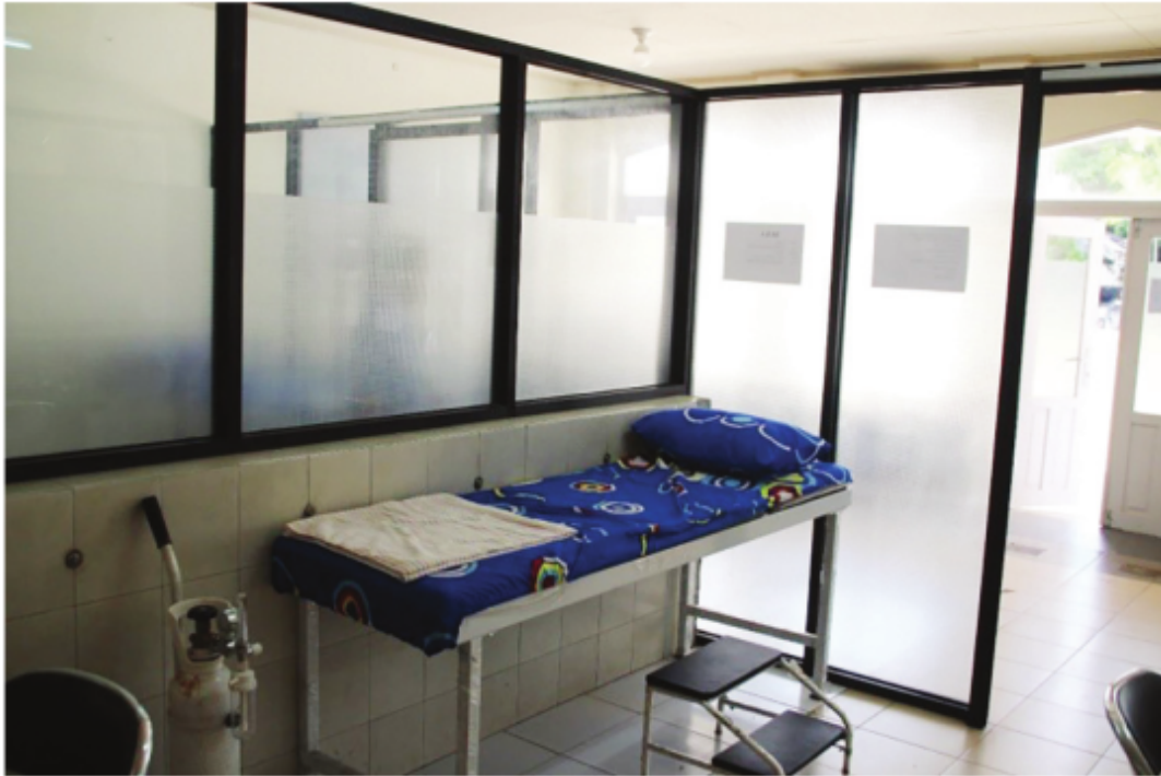
Ruangan Klinik Sehat Masjid Raya Sabilal Muhtadin