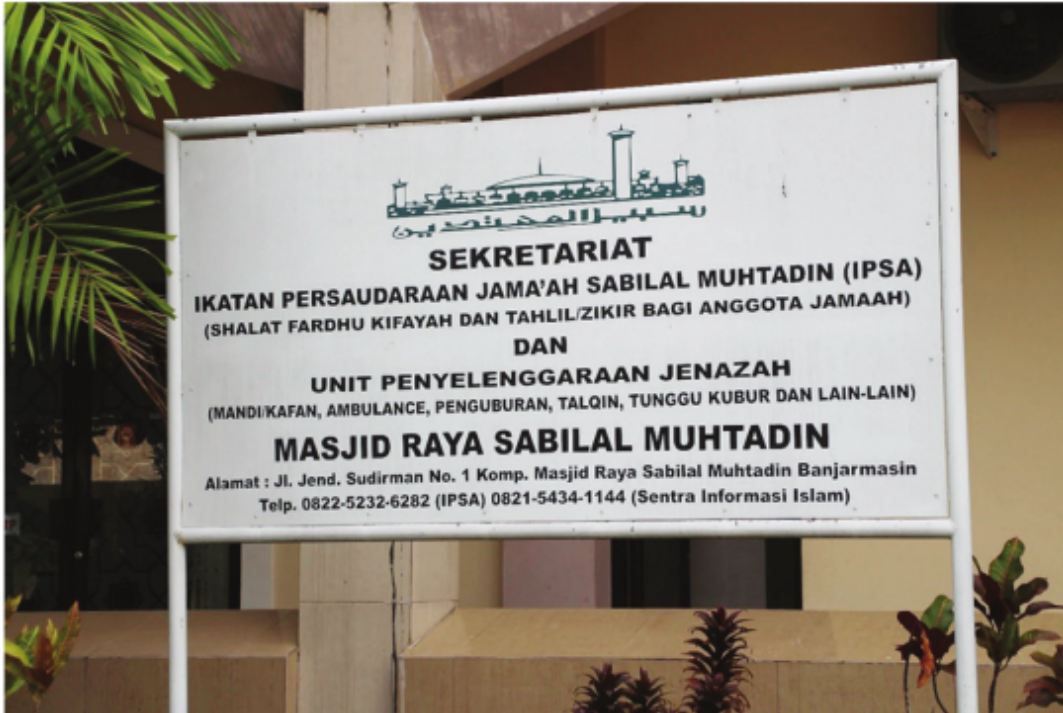
Kantor Sekretariat Ikatan Persaudaraan Jama'ah dan Unit Penyelenggaraan Jenazah Masjid Raya Sabilal Muhtadin