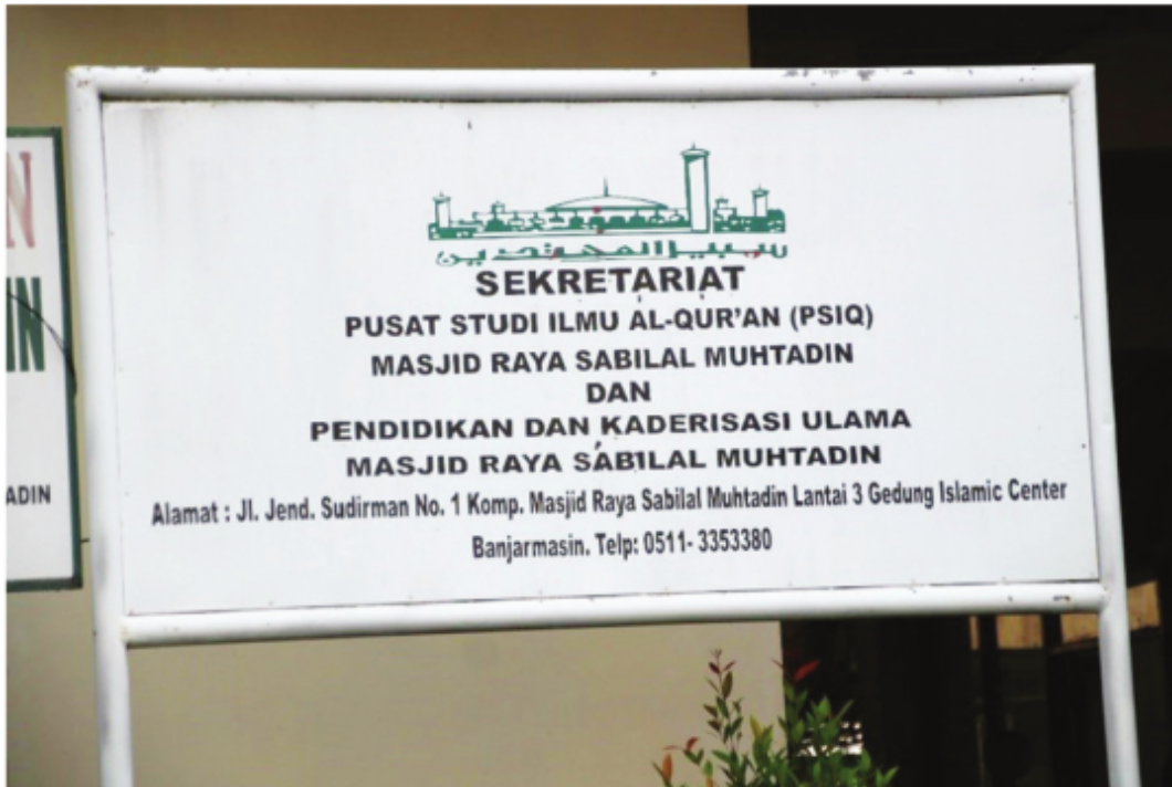
Kantor Sekretariat Pusat Studi Ilmu Al-Qur'an (PSIQ) dan Pendidikan dan Kaderisasi Ulama Masjid Raya Sabilal Muhtadin