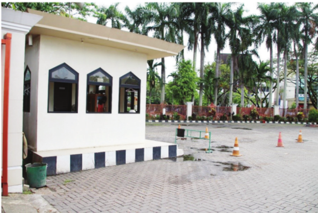
POS Keamanan Masjid Raya Sabilal Muhtadin di Depan Pintu Masuk