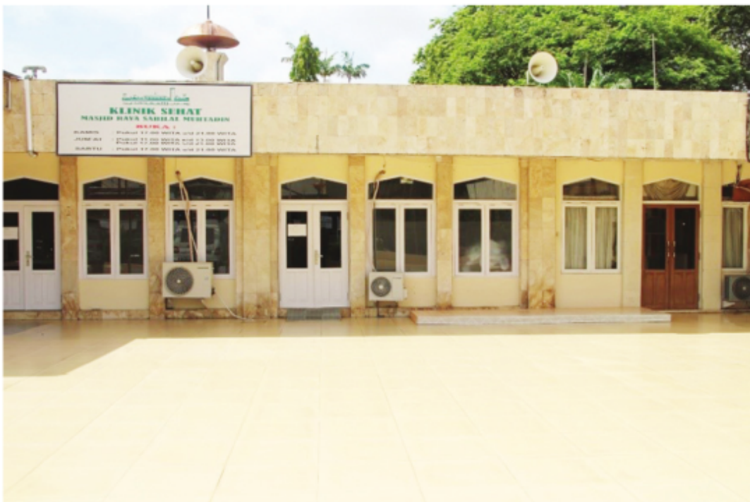
Gedung Klinik Sehat Masjid Raya Sabilal Muhtadin