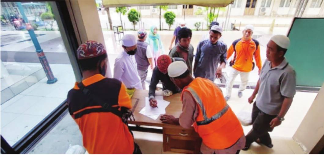
Proses Pembagian Beras dari ATM beras