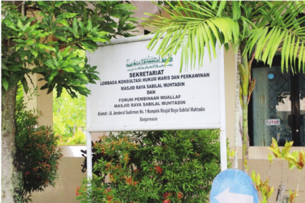
Kantor Sekretariat Konsultasi Hukum Waris dan Perkawinan dan Forum Pembinaan Muallaf Masjid Raya Sabal Muhtadin