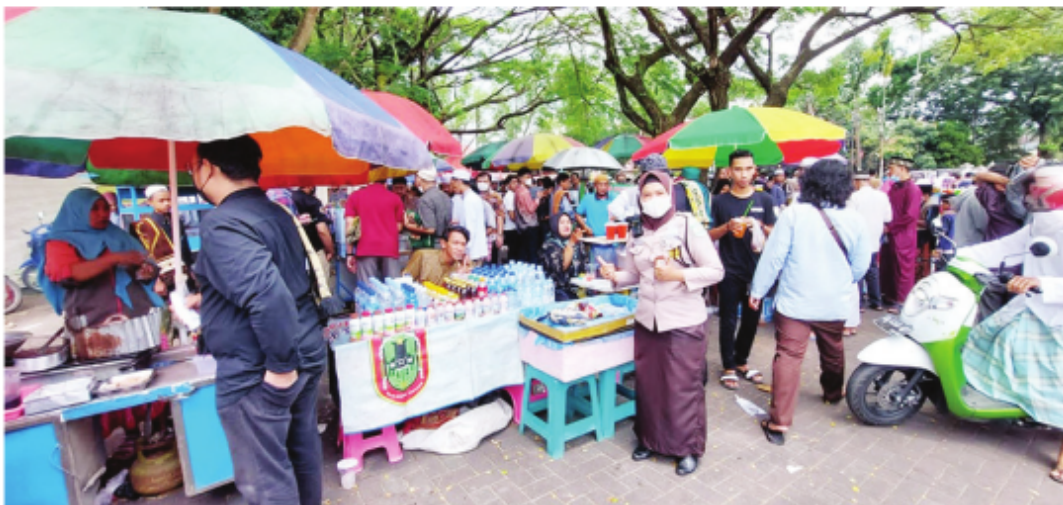
Area UMKM Masjid Raya Sabilal Muhtadin