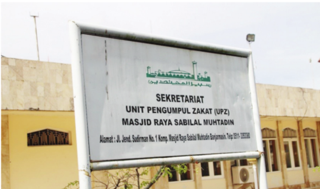
Kantor Sekretariat Unit Pengumpul Zakat (UPZ) Sabilal Muhtadin