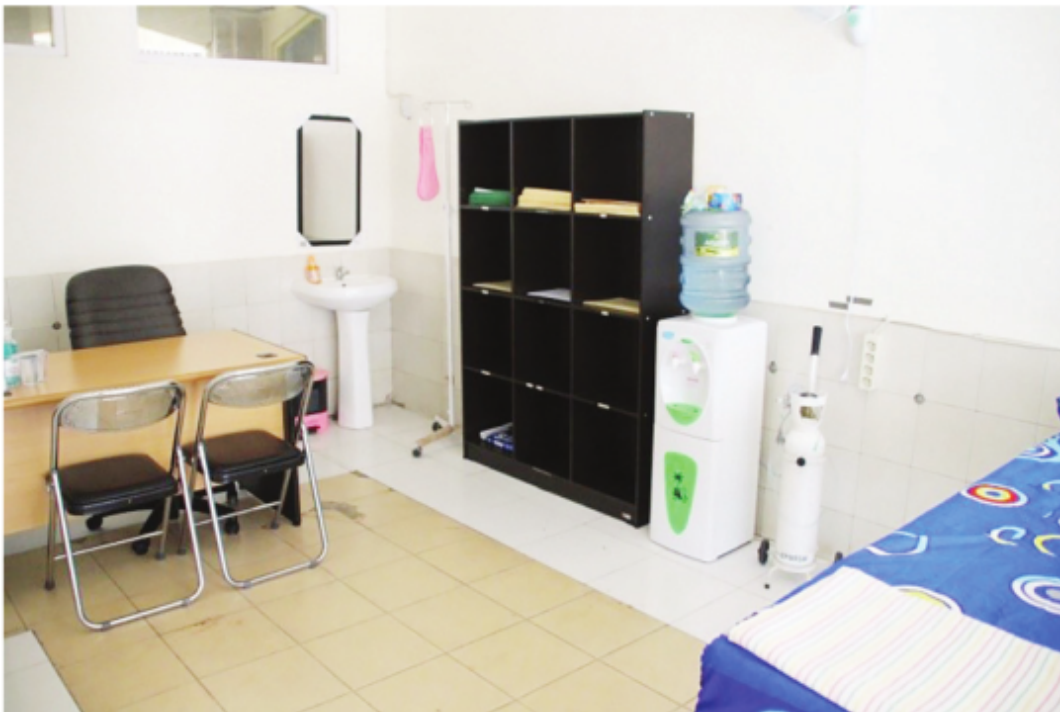
Ruang Fasilitas Klinik Sehat Masjid Raya Sabilal Muhtadin