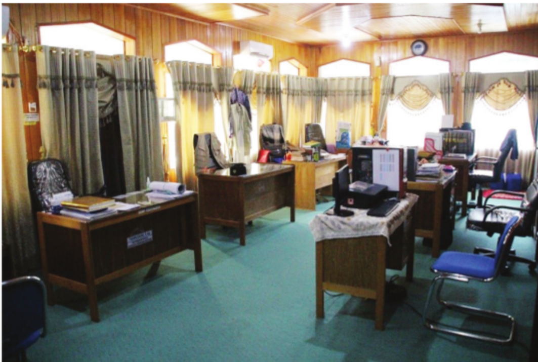
Ruang Kantor Sekretariat Badan Pengelola Masjid Raya Sabilal Muhtadin