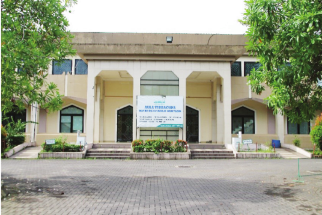
Gedung Aula Serbaguna Masjid Raya Sabilal Muhtadin