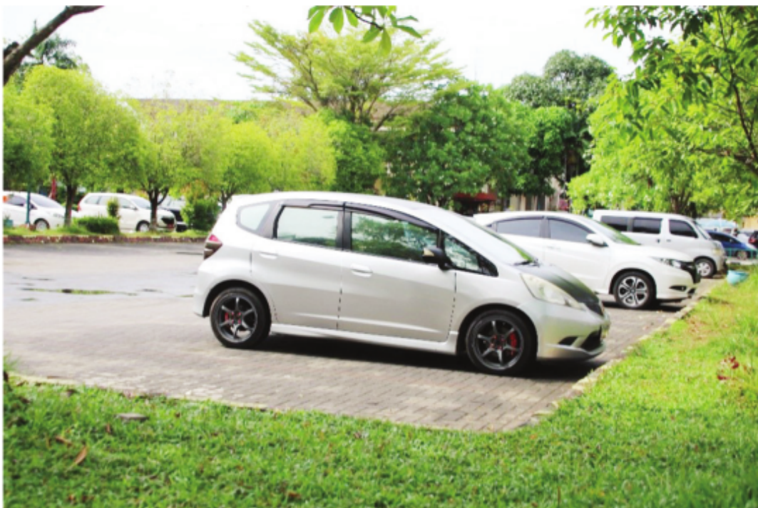
Area Parkir Mobil