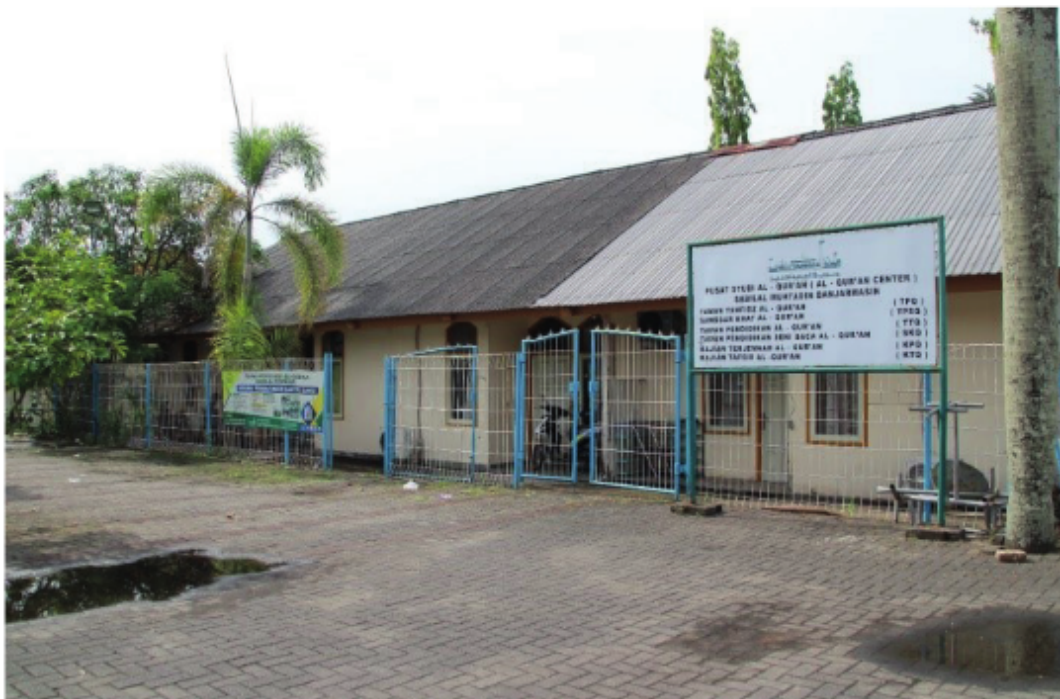
Pusat Studi Al-Qur'an (Al-Qur'an Center) Masjid Raya Sabilal Muhtadin