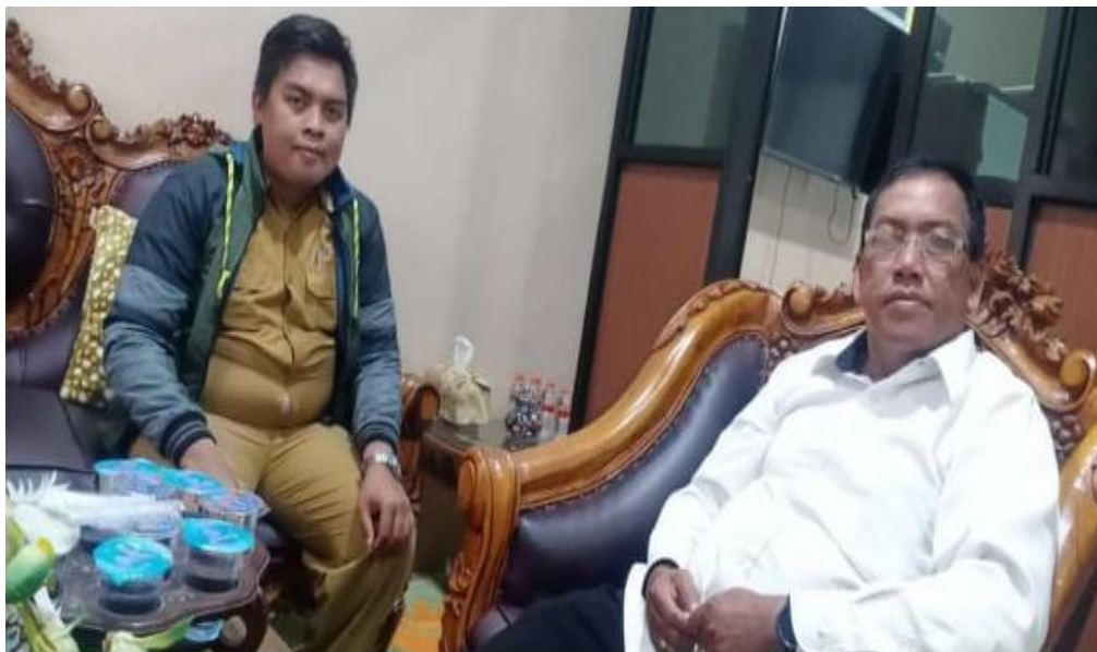
Foto bersama kepala sekolah MAN 2 Banjarmasin