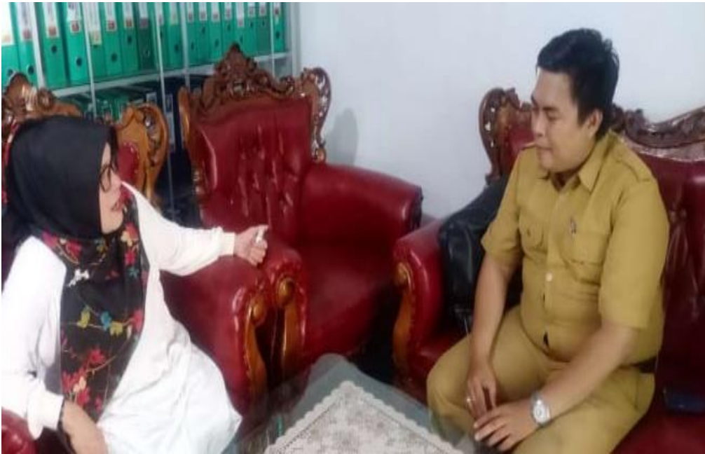
Foto bersama kepala sekolah MAN 3 Banjarmasin