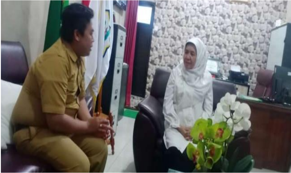
Foto bersama kepala sekolah MAN 1 Banjarmasin