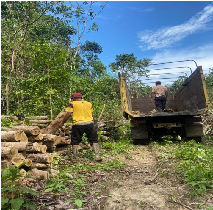
Gambar IV: Wawancara dengan Muhammad Hilmi (Penjual Bahan Baku Arang), 15 Februari 2023, Pukul 17.00 WITA