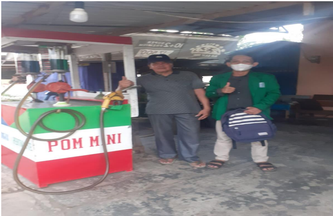
Dokumentasi wawancara dengan pemilik usaha/ penjual BBM Pertamina di Desa Indasari