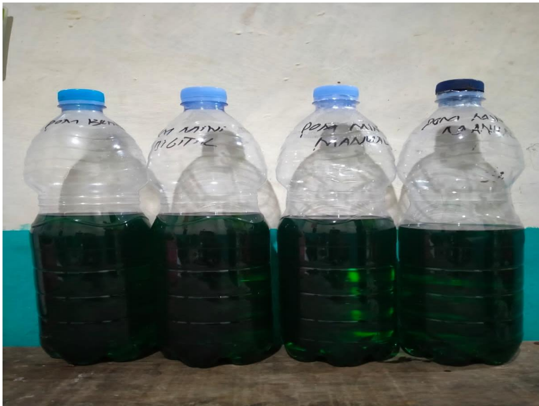
Perbandingan nilai takaran pembelian BBM di SPBU, Pertamina Digital, dan Pertamina Manual.