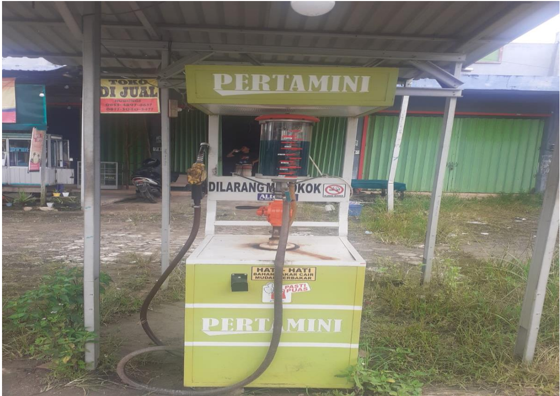
Dokumentasi alat pertamini Manual yang digunakan dalam transaksi jual beli BBM