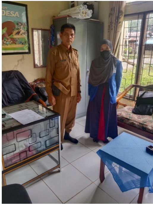
Informan Bapa AS S.Pd