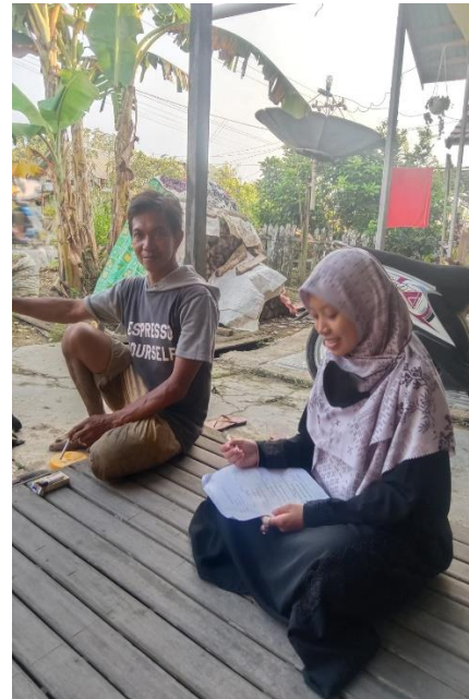
Informan Bapa Ud