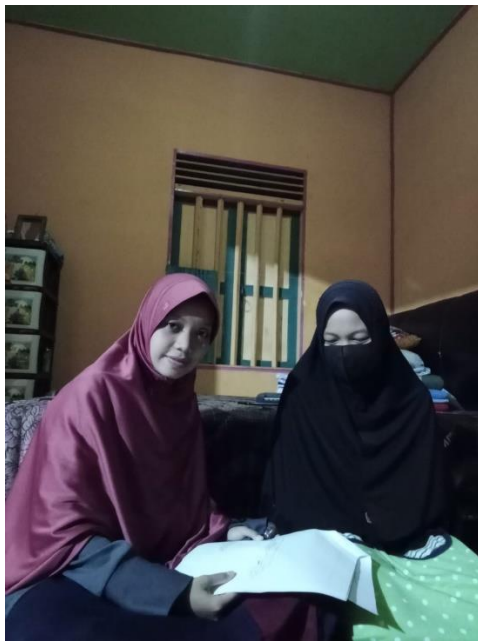
Informan Ibu Fm