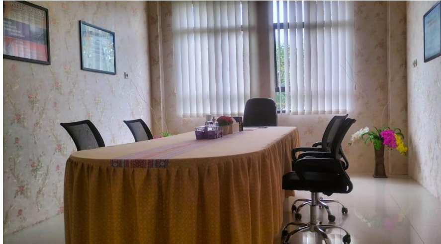
Gambar 4.7. Ruang Mediasi

Tempat dilaksanakannya mediasi antara para pihak yang berperkara dan dibantu oleh hakim mediator.