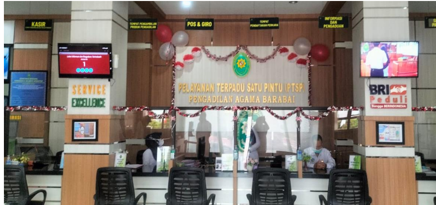
Gambar 4.4. Pelayanan Terpadu Satu Pintu (PTSP)

Merupakan tempat untuk mendapatkan informasi dan pengaduan, pembayaran biaya perkara dan pengambilan produk.