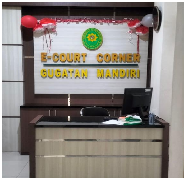
Gambar 4.5. Gugatan Mandiri ( E-Court Corner )

Pada tempat ini para pihak dapat membuat sendiri surat gugatan untuk berperkara di Pengadilan Agama Barabai.