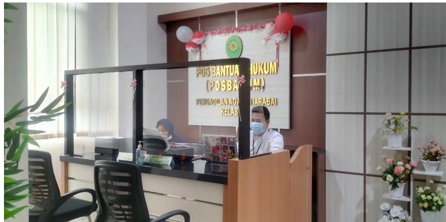
Gambar 4.3. Pos Bantuan Hukum (POSBAKUM)

Merupakan tempat untuk pembuatan surat gugatan dan pembuatan replik-duplik.