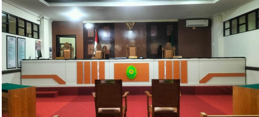
Gambar 4.6. Ruang Sidang

Merupakan tempat untuk proses persidangan.