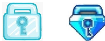
Gambar 4.1 Diamond Lock dan Blue Diamond Lock

Dalam praktiknya, jual beli virtual property bisa dikatakan sudah menjadi hal yang lazim dilakukan oleh para pemain game online growtopia , hal tersebut dikarenakan mereka menganggap jual beli ini adalah sebuah bisnis baru yang dapat menguntungkan mereka di masa sekarang. Penjualan virtual property ini pada dasarnya sama saja dengan penjualan barang lainnya yang dijual secara online pada media sosial maupun marketplace, hanya saja barang yang diperjualbelikan kali ini tidak ada wujudnya. Hal ini dikarenakan benda yang biasa disebut dengan Diamond Lock dan Blue Diamond Lock ini merupakan item yang terdapat dalam sebuah permainan online .