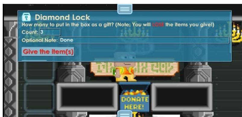
Gambar 4.4 Pengiriman virtual property melalui donation box

Selanjutnya perlu diketahui bahwa jual beli virtual property game growtopia ini, pada dasarnya juga dapat dilaksanakan secara offline dengan sistem Cash On Delivery (COD) , namun ada syarat yang harus dipenuhi dalam sistem ini yakni kedua pihak harus berada di satu daerah atau di satu wilayah yang sama. Tentunya hal demikian dimaksudkan agar nantinya para pihak dapat melangsungkan transaksi secara tatap muka langsung. Jadi setelah syarat tadi terpenuhi maka bagi mereka yang ingin melakukan transaksi secara tatap muka, mereka dapat secara langsung membuat kesepakatan serta janji untuk bertemu di suatu tempat, pastinya dengan adanya pertemuan tersebut para pihak dapat melakukan negosiasi harga barang, kemudian mereka juga dapat terhindar dari unsur penipuan sebab apabila jual beli dilakukan secara offline pastinya para pihak dapat memastikan ketersediaan virtual property yang akan diperjualbelikan tersebut secara leluasa. Di samping itu ada kemudahan lain dari sistem COD ini yang bisa dirasakan oleh pihak pembeli, yakni mereka dapat melakukan pembayaran secara tunai di tempat transaksi berlangsung, oleh karena itu mereka tidak perlu repot lagi