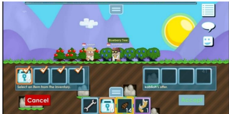
Gambar 4.5 Penyerahterimaan virtual property melalui Fitur Trade

Pada intinya jual beli virtual property berupa diamond lock dan blue diamond lock yang terdapat dalam game growtopia ini, merupakan transaksi jual beli yang sama seperti jual beli yang kita lakukan sehari-hari yang mana pastinya ada pembeli, ada penjual, ada objek yang diperjualbelikan dan ada harga sebagai nilai tukar terhadap barang yang diperjualbelikan tersebut. Hanya saja yang membedakannya ialah dari segi mekanisme dan objeknya. Jadi dilakukan atau tidaknya jual beli virtual property ini kembali kepada diri masing-masing pihak, sebab mereka pastinya memiliki alasan tersendiri untuk melakukan jual beli virtual property tersebut dan tentunya selama tidak merugikan pihak lain, maka jual beli ini boleh-boleh saja dilakukan oleh siapa pun.