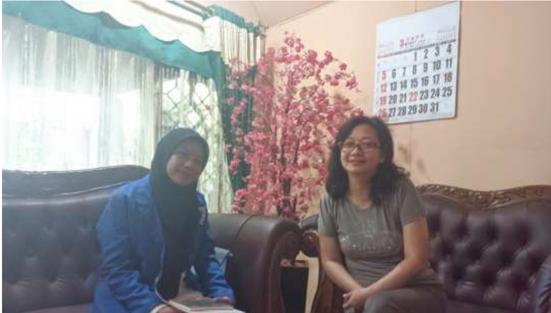
Gambar 1 Wawancara dengan konsumen (TMC)