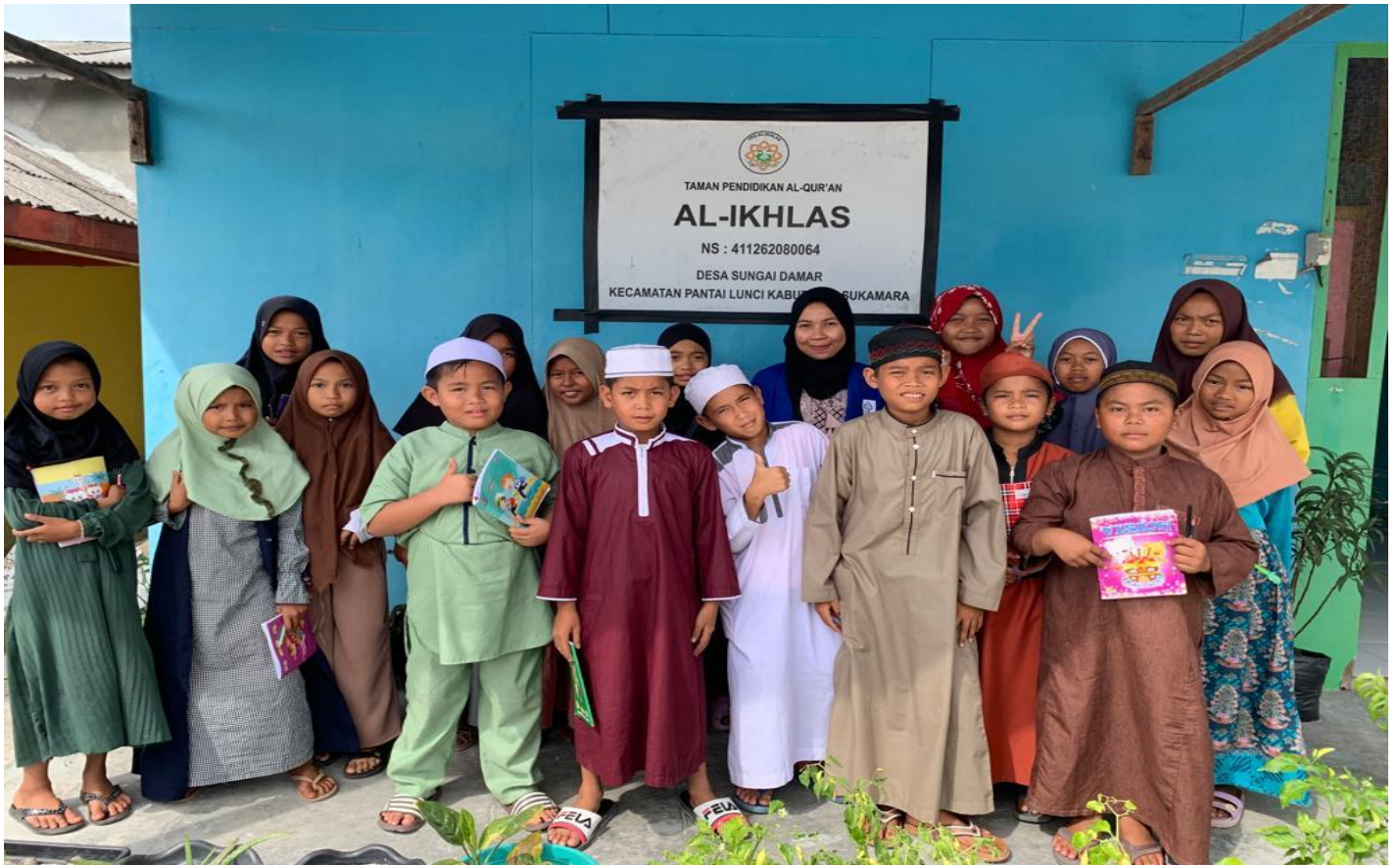
Foto bersama Santri TPQ Al-Ikhlash Desa Sungai Damar