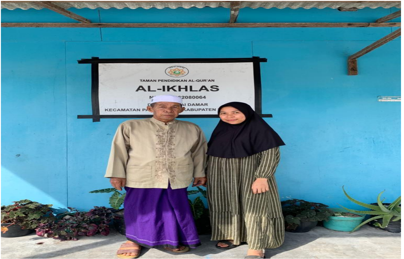
Foto dengan Pimpinan TPQ Al-Ikhlal