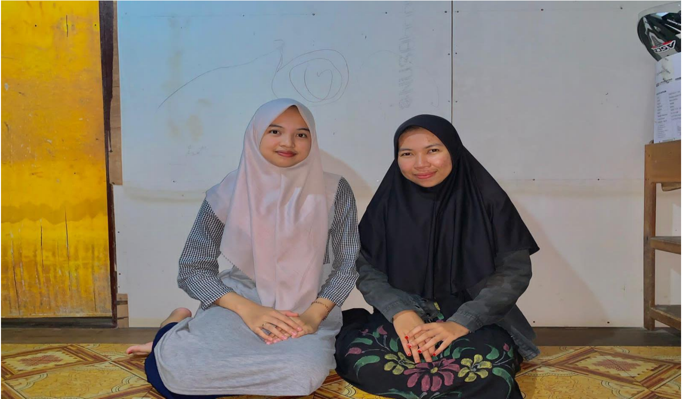
Foto setelah Wawancara dengan Ibu Susi (Orang Tua Santri TPQ Al-Ikhlas)