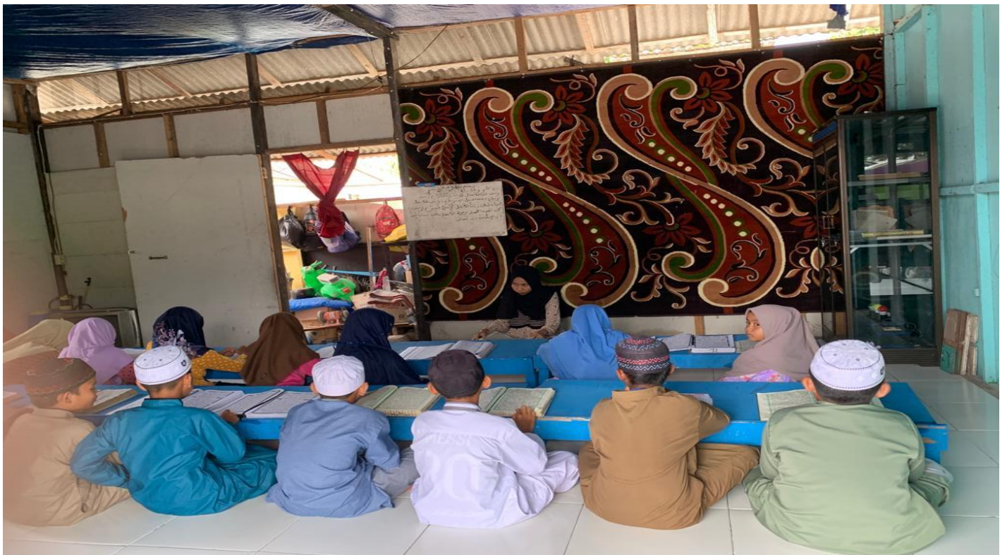
Foto saat Pembelajaran di TPQ Al-Ikhlash Desa Sungai Damar