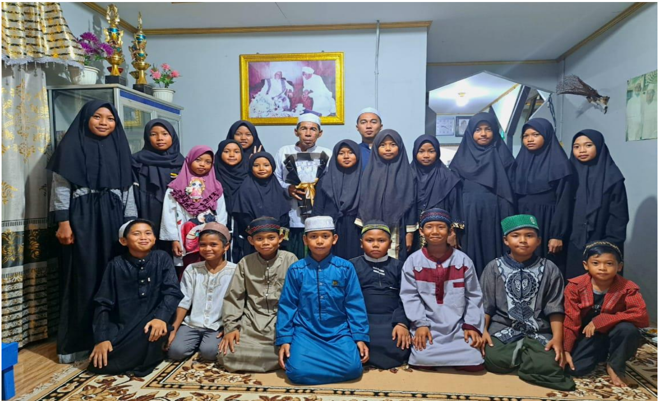
Foto saat Kegiatan Maulid Habsyi