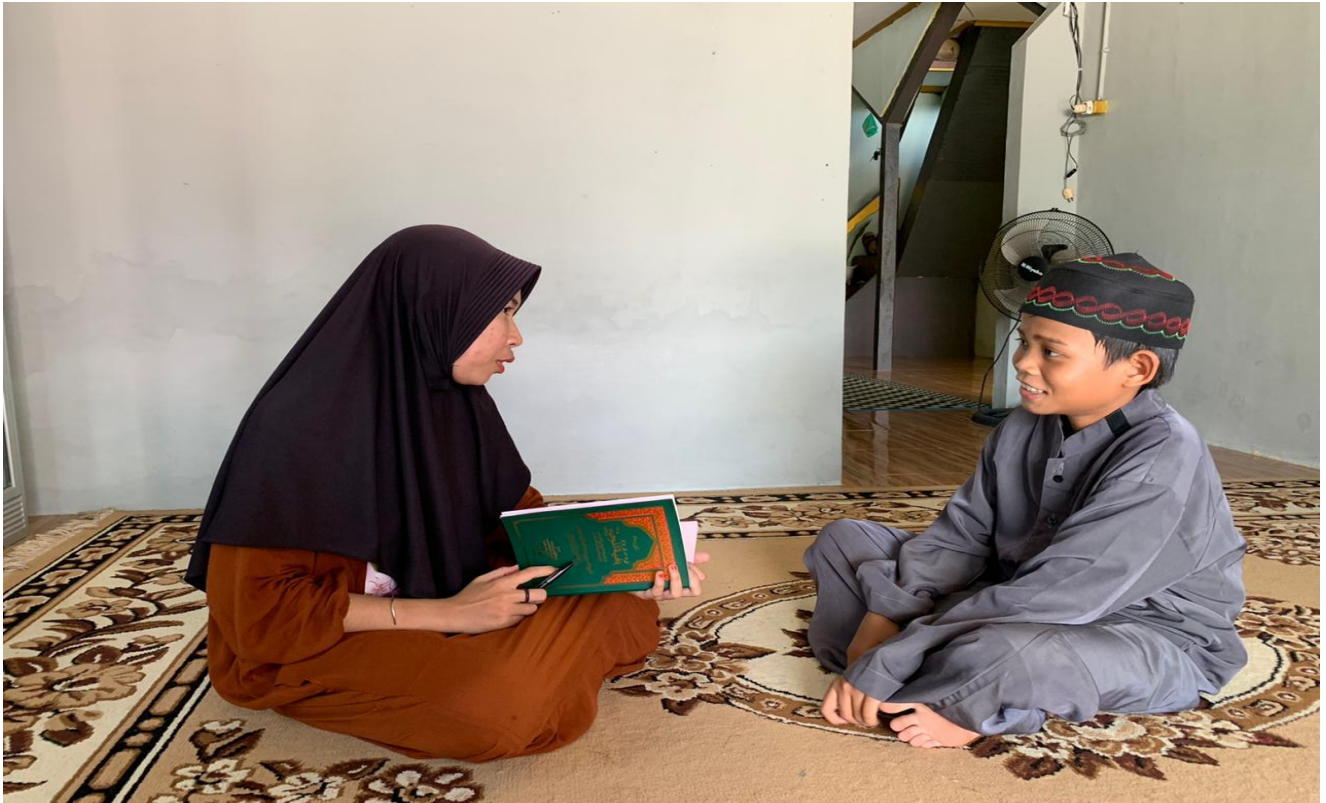
Foto Wawancara dengan Santri Laki-laki TPQ Al-Ikhlash