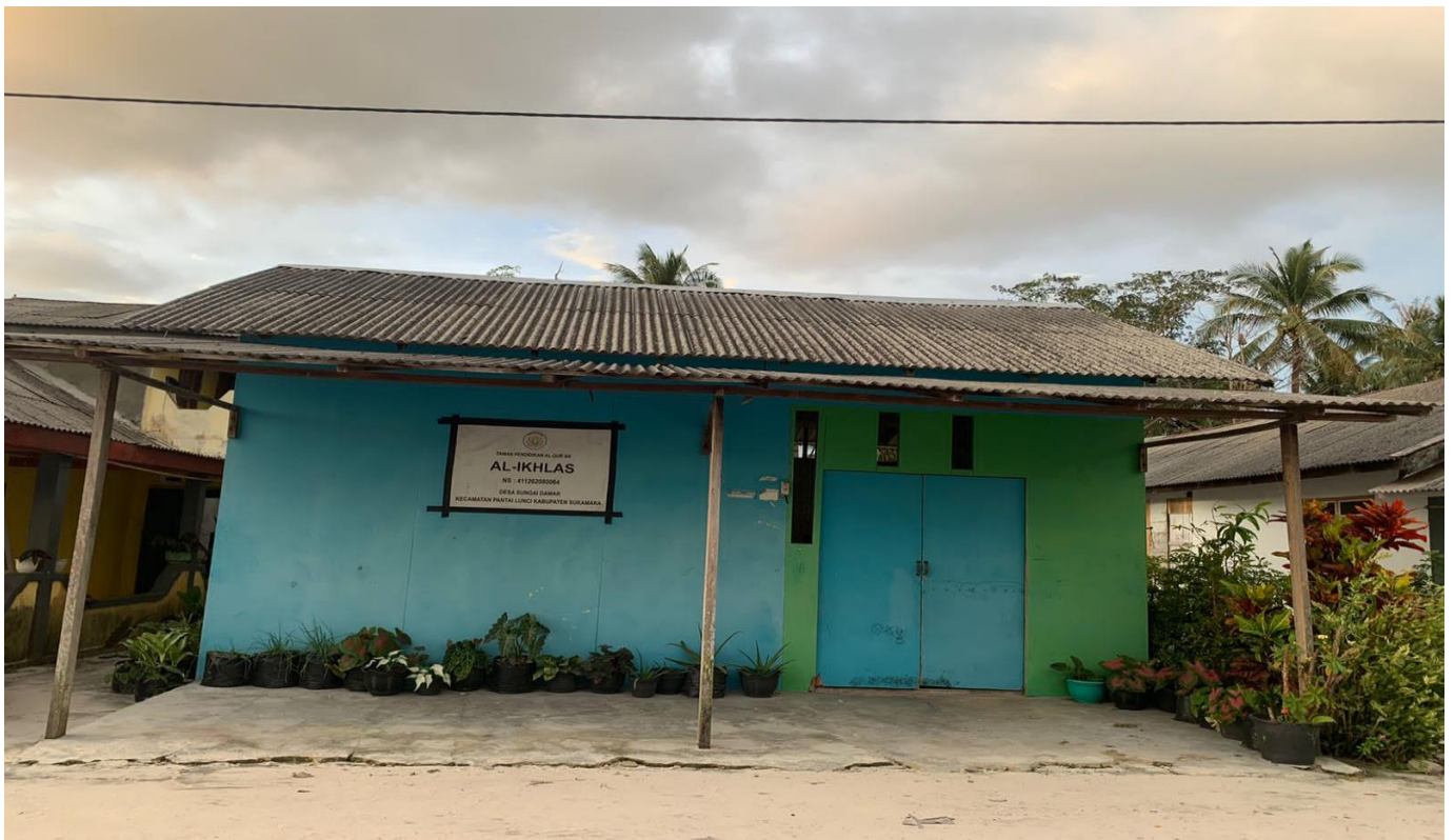
Foto Taman Pendidikan Al-Qur'an Al-Ikhlal Desa Sungai Damar