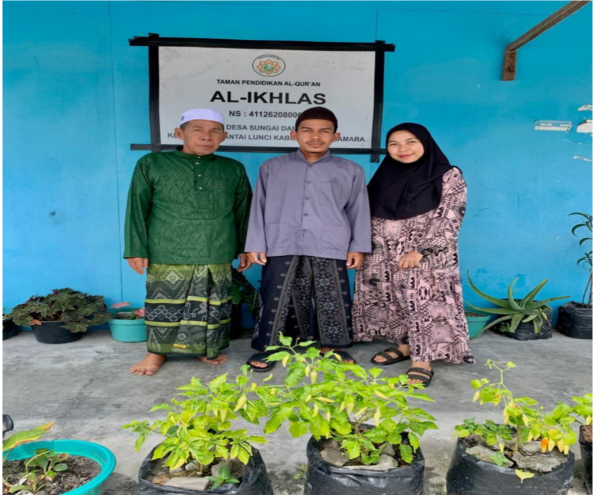
Foto bersama dengan Pimpinan dan Tenaga pengajar TPQ Al-Ikhlas Desa Sungai Damar