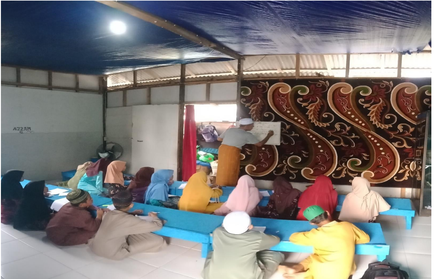
Foto saat Kegiatan Majelis Taklim