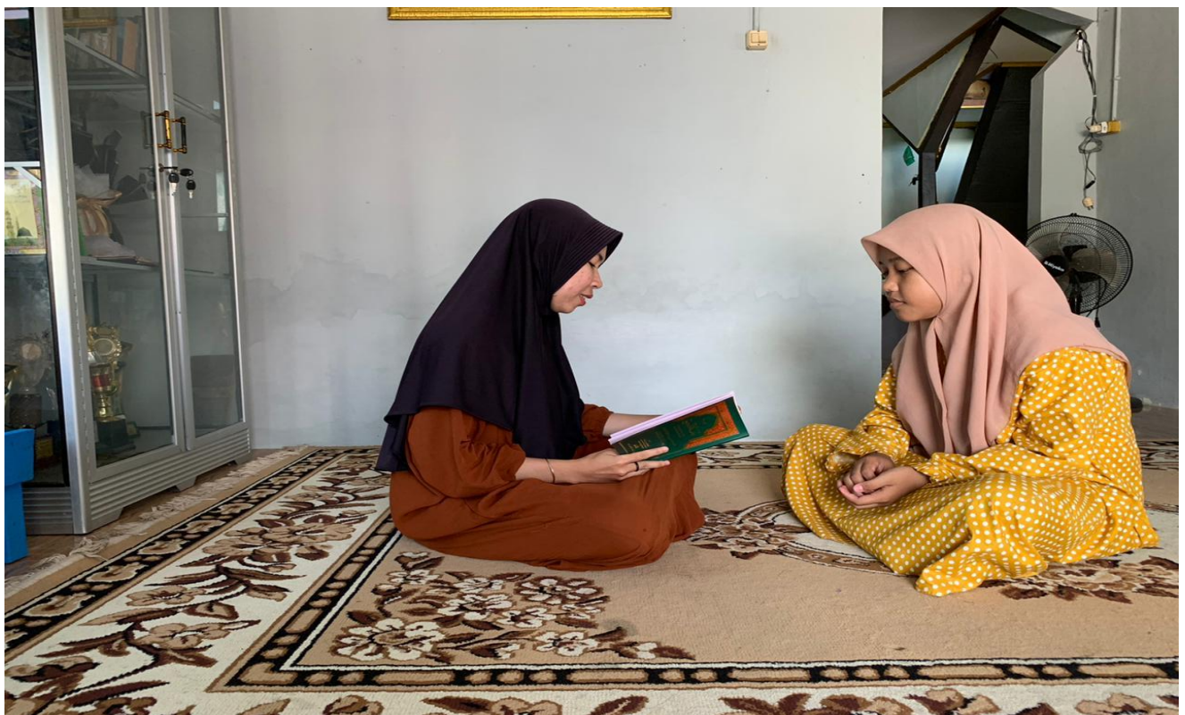
Foto Wawancara dengan Santri Perempuan TPQ Al-Ikhlash