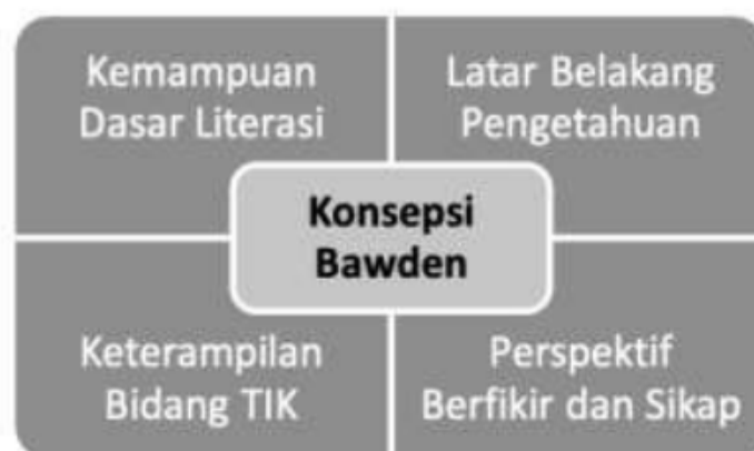
Gambar 1 Konsepsi literasi digital Bawden

Pembentukan literasi digital dipengaruhi oleh 4 aspek yang disusun dalam konsepsi Bawden (Lankshear, Michele, and Editors 2008). Empat aspek tersebut yaitu kemampuan dasar literasi, latar belakang pengetahuan informasi, keterampilan di bidang Teknologi Informasi Komunikasi, serta perspektif berfikir dan sikap. Kemampuan dasar literasi merupakan kemampuan untuk membaca, menulis, memahami simbol, dan perhitungan angka. Hal ini menunjukkan kemampuan dalam memahami dan menggunakan simbol-simbol yang digunakan pada perangkat lunak di media digital. Aspek kedua yaitu latar belakang pengetahuan informasi, yaitu kemampuan menggunakan pengetahuan yang telah dimiliki untuk menelusuri informasi baru yang memperkaya pengetahuan yang dimiliki sebelumnya, hal ini ditunjukkan dalam kemampuan mencari informasi menggunakan search engine dan menyeleksi hasil pencarian. Aspek keterampilan bidang Teknologi Informasi Komunikasi merupakan kompetensi utama dalam bidang literasi digital, dimana seseorang memiliki kemampuan untuk menciptakan atau menyusun konten digital. Aspek terakhir yaitu aspek sikap dan perspektif pengguna informasi ( attitudes and perspective ), merupakan perilaku seseorang dalam menggunakan informasi dan mengkomunikasikan konten informasi.