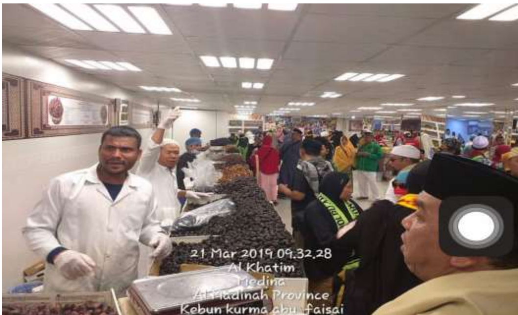
Berkunjung ke pusat oleh-oleh kebun kurma di Madinah