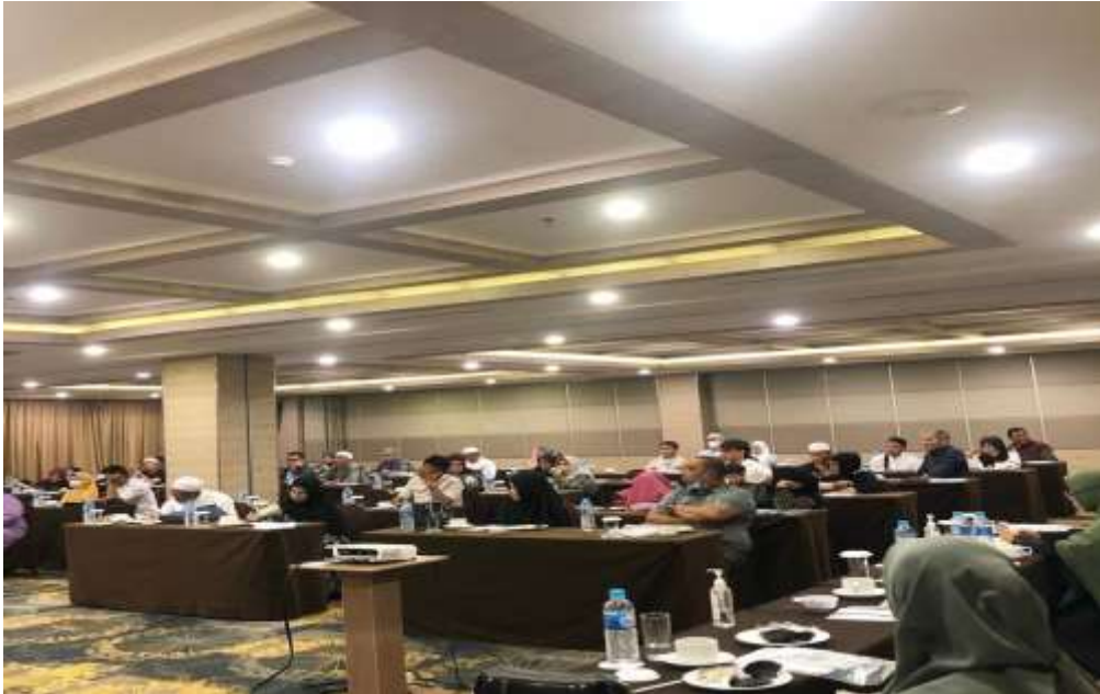
Dokumentasi kegiatan manasik sebelum pandemi Covid-19