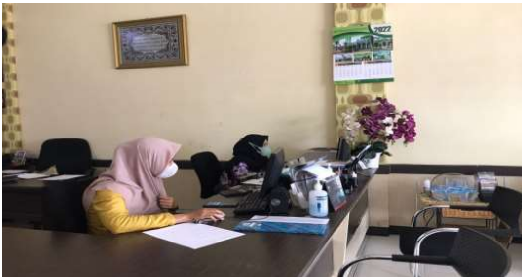
Dokumentasi beberapa karyawan yang sedang bekerja