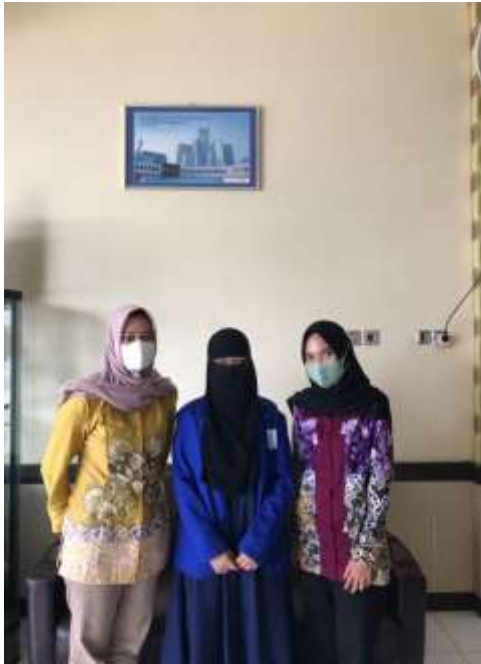
Foto bersama beberapa Karyawan PT. Qolbu Amanah Perdana