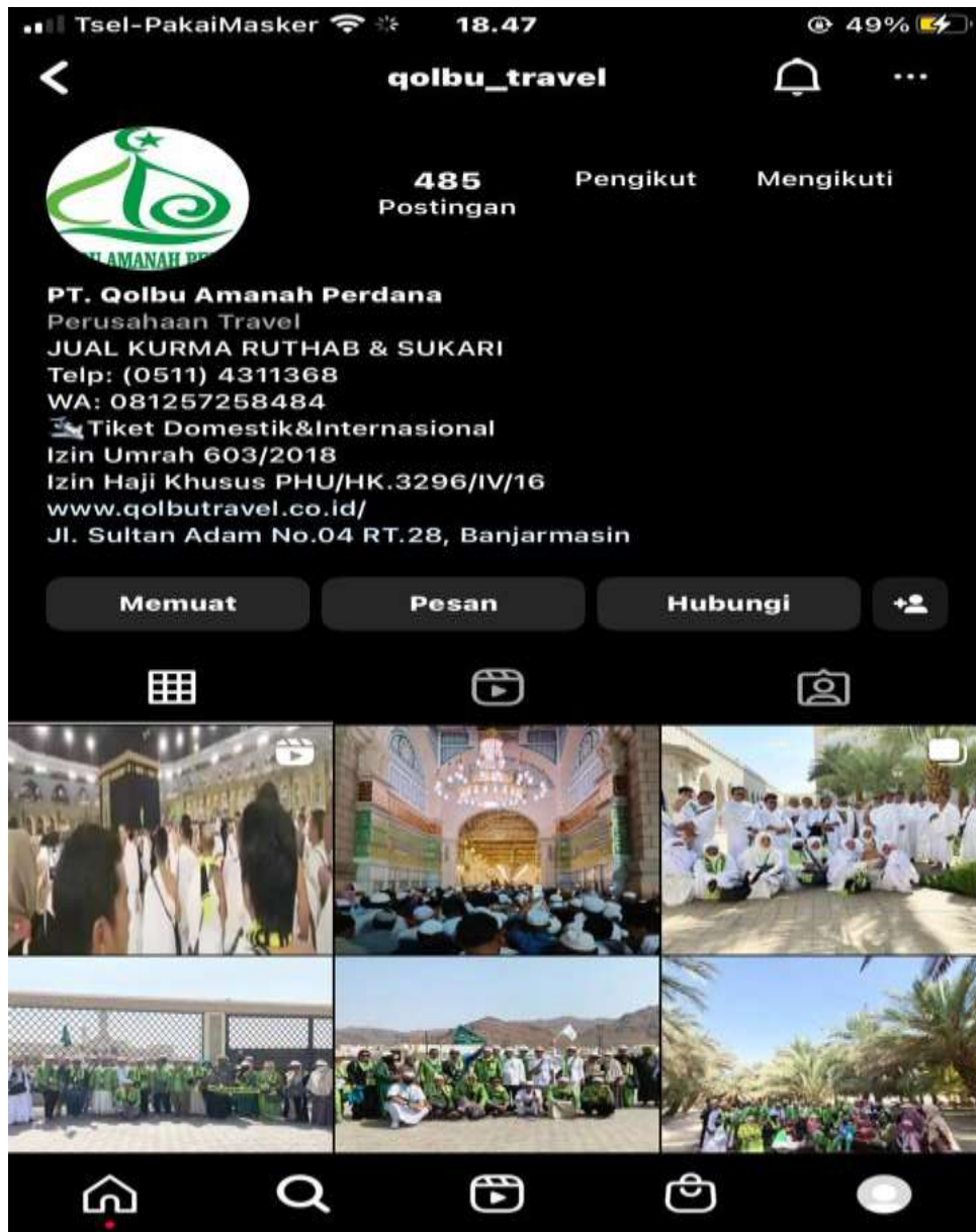
Sosial media, instagram PT. Qolbu Amanah Perdana