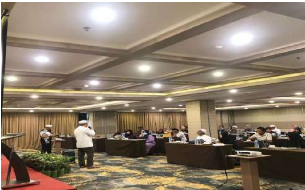
Dokumentasi kegiatan manasik bersama Ustadz Husaini