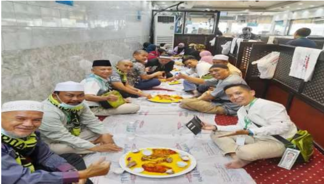
Makan bersama para jemaah umroh