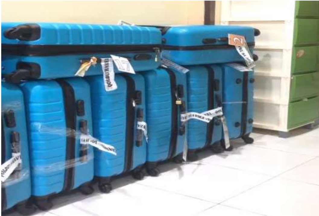
Fasilitas untuk para jemaah seperti koper dan beberapa produk lainnya yang disediakan oleh QAP