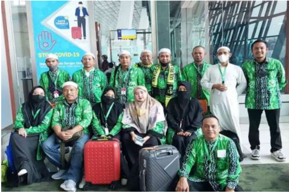
Dokumentasi beberapa jemaah tiba di Bandara jeddah, Saudi Arabia