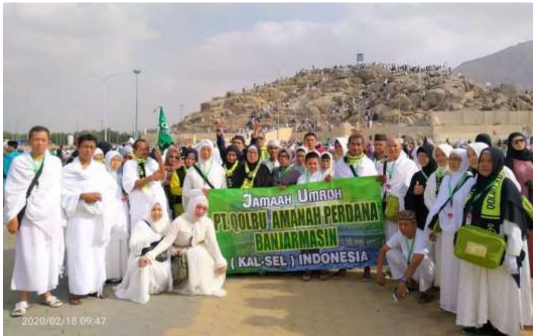
Dokumentasi rombongan jemaah PT. Qolbu Amanah Perdana di Jabal Rahmah