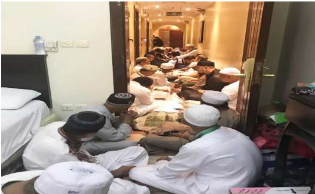
Dokumentasi majelis dan ceramah agama selama di Baitullah