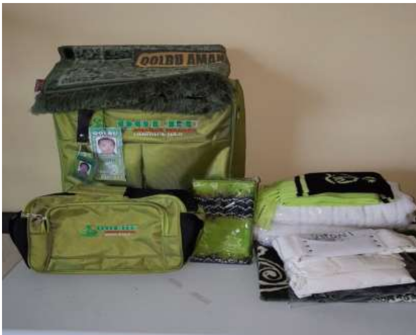
Fasilitas untuk para jemaah seperti koper dan beberapa produk lainnya yang disediakan oleh QAP