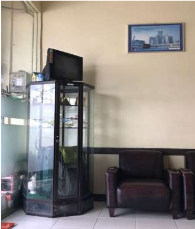
Ruang tunggu calon jemaah haji dan umroh