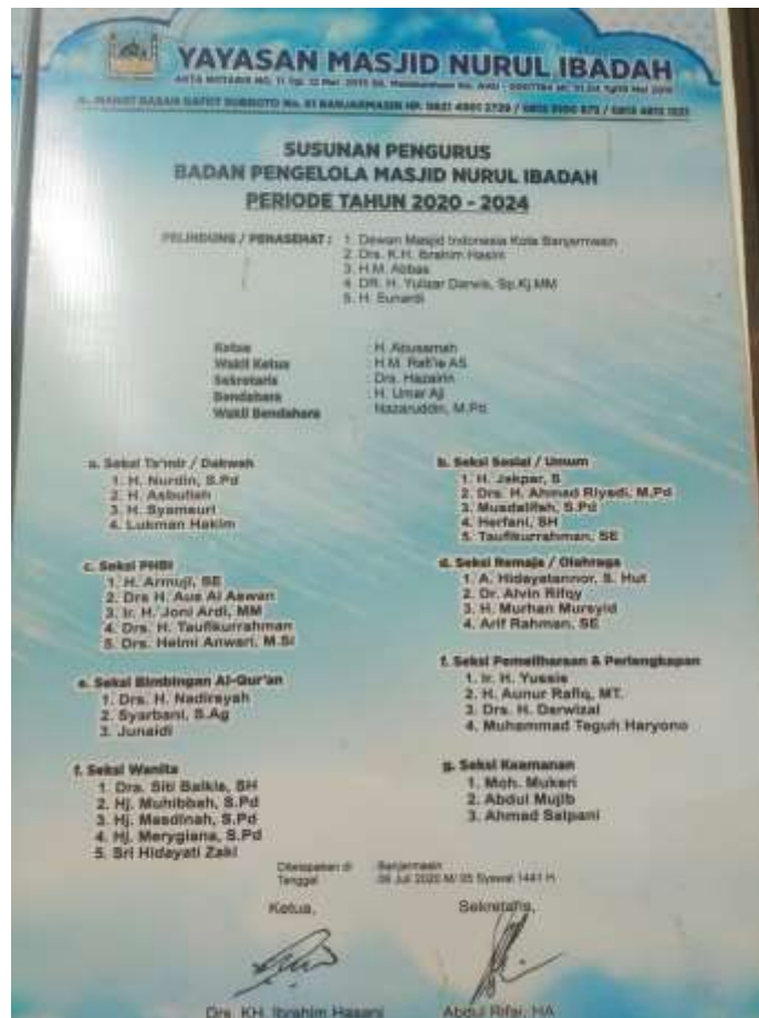
Dokumentasi Struktur Masjid Nurul Ibadah