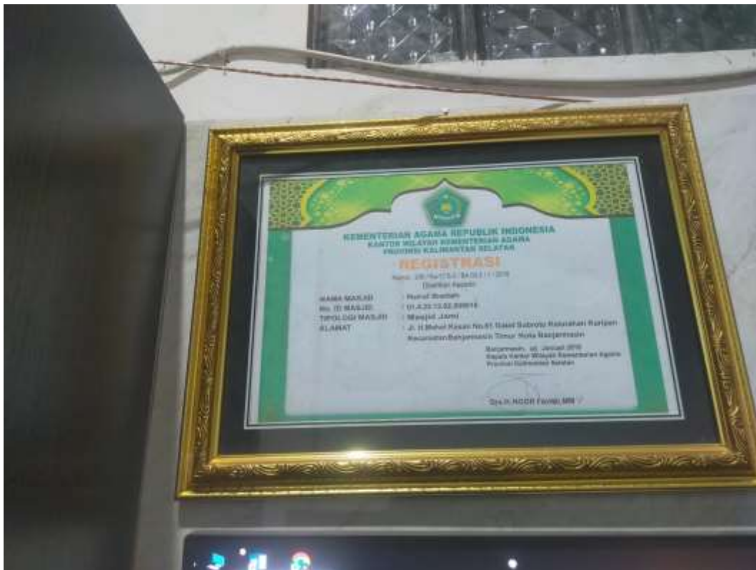
Dokumentasi Penghargaan telah membuat Sertifikat Tanah Wakaf Masjid Nurul Ibadah