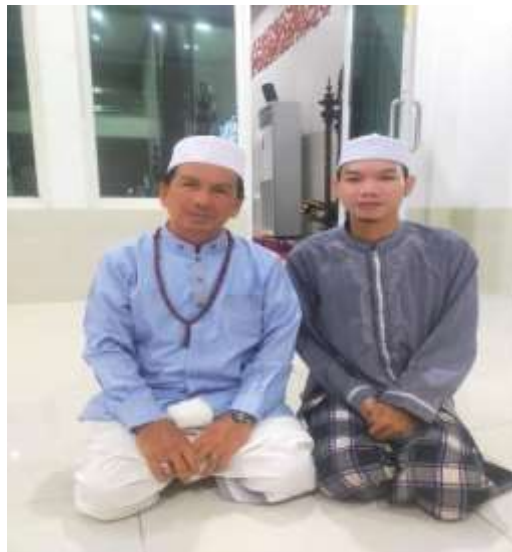
Dokumentasi Wawancara Kepada Pangurus Masjid Nurul Ibadah