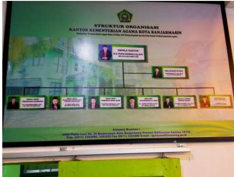
Dokumentasi Stuktur Organisasi Kementerian Agama Kota Banjarmasin