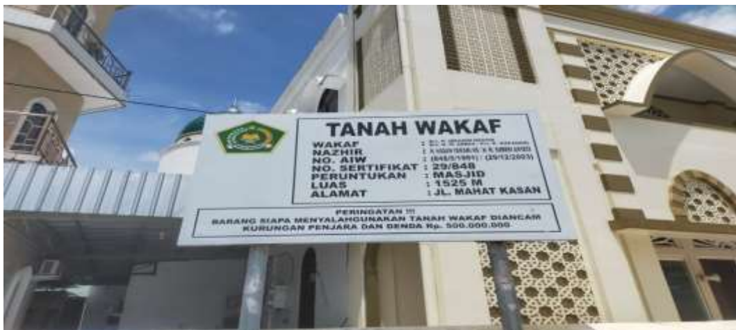
Dokumentasi Palang Tanah Wakaf Masjid Nurul Ibadah