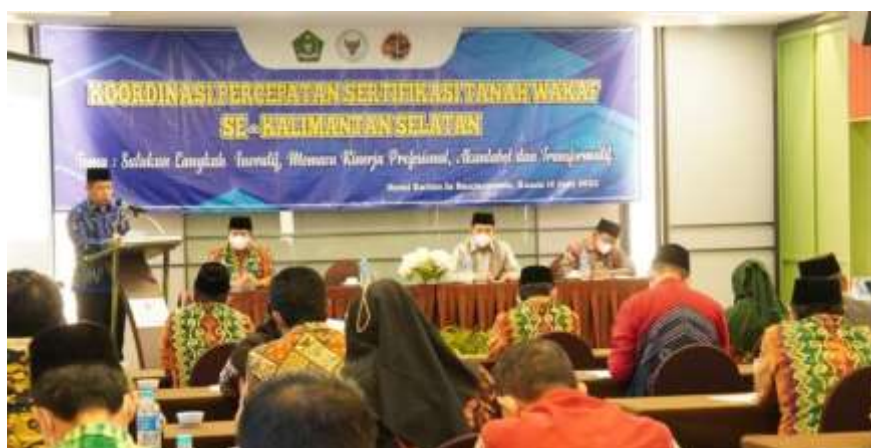
Dokumentasi Koordinasi Percepatan Sertifikat Tanah Wakaf yang dilaksanakan pada 27 April 2023