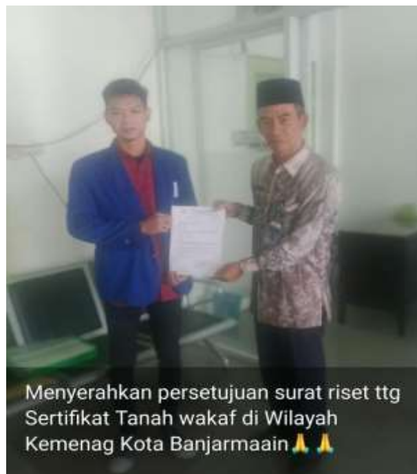
Dokumentasi Penyerahan Surat Riset dan Persetujuan Riset Sekaligus Wawancara Kepada Kementerian Agama Kota Banjarmasin