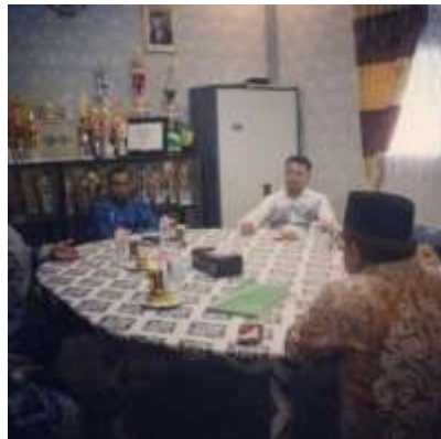
Gambar 4.6 Monitoring Kemenag ke MAN 3 Banjar

kunjungannya mengatakan bahwasanya kunjungan madrasah ini merupakan kegiatan rutin yang dilakukan terutama diawal tahun dalam rangka melakukan monitoring dan evaluasi kegiatan madrasah, dan juga beliau mengharapkan hendaknya kegiatan pembelajaran tatap muka di MAN 3 Banjar selalu memperhatikan protokol kesehatan.