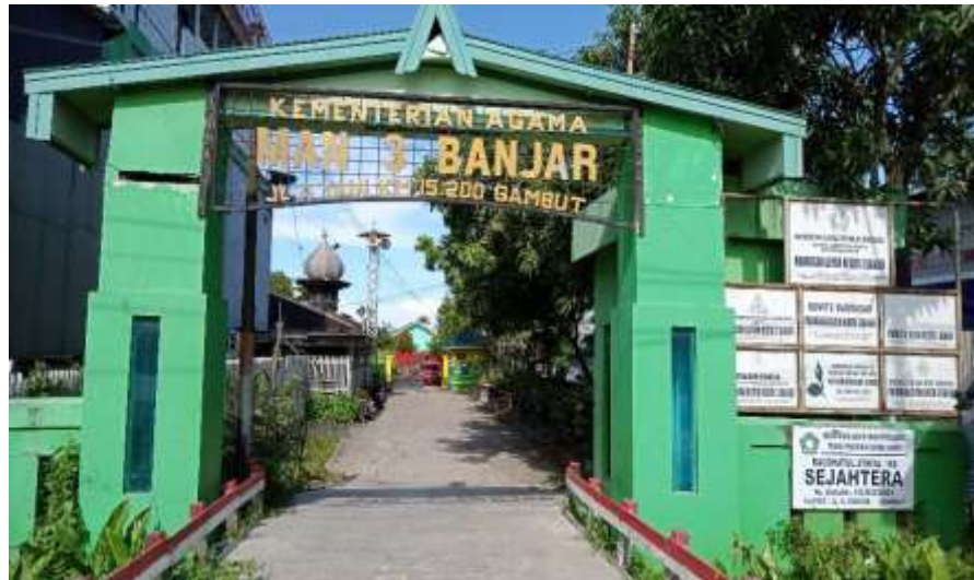
Gambar 4.1 Gerbang MAN 3 Banjar

Bermula MAN 3 Banjar ini berdiri sejak tahun 1958 yang berlokasi di Jl Ahmad Yani yang berada dikawasan Gambut di Km 15.200. Jadi sekolah ini cukup lama berdiri sekitar kurang lebih 65 tahunan. Berawal pada tahun 1958 sampai dengan 1969 itu sekolahnya bernama yayasan pendidikan sinar harapan. Lalu berjalannya waktu berubah nama lagi menjadi PGAN semenjak tahun 1970 sampai dengan tahun 1977. Lalu semenjak tahun 1978 berganti nama menjadi MAN Gambut, dikarenakan lokasinya berada di Gambut. Lalu semenjak tahun 1996 keluarlah Surat Keputusan Kepala Kantor Wilayah Departemen Agama yang mana ada perubahan nama lagi menjadi MAN 1 Martapura, dikarenakan masih