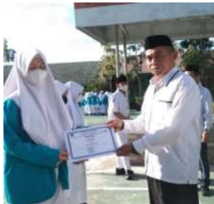
Gambar 4.5 Penyerahan Sertifikat

Jadi peran humas diantaranya memotivasi siswa agar selalu rutin membaca Al-Quran dan menghafalnya secara bertahap, agar siswa tersebut bisa dengan mudah menghafal Al-Quran meskipun dimulai dari juz amma atau juz 30. Di MAN 3 Banjar siswa dilatih agar selalu membaca Al-Quran serta menghafalnya, Di antara sekian banyak siswa MAN 3 Banjar, ada beberapa siswa menghafal Al-Quran dengan cepat bahkan mulai Juz Amma atau Juz 30. Sehingga siswa tersebut mendapatkan piagam penghargaan dari pihak MAN 3 Banjar, sebagai penghargaan atas prestasi hafalannya.