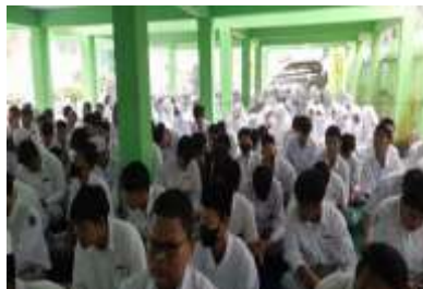
Gambar 4.3 Antusiasme Murid MAN 3 Banjar