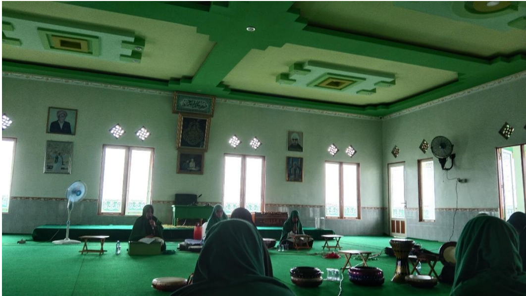
GAMBAR Error! No text of specified style in document..9 Kegiatan Dakwah Ibu Uplihah dan Ibu Berlian di Majelis Sholawatiyah