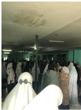
Gambar 4.2 Aula