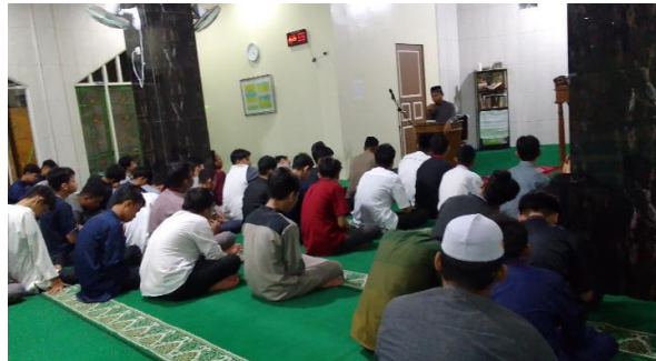
Gambar 4.4 Shalat berjamaah