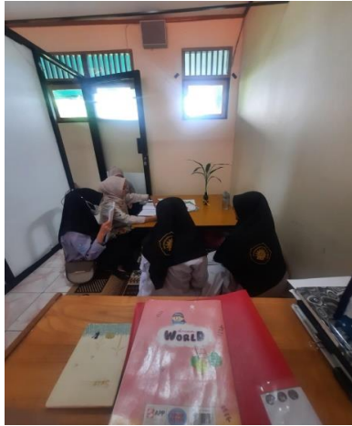
Gambar 4.6 Bantuan berupa Bimbingan guru BK

Menghormati seorang pendidik menghormati seorang yang lebih tua harus sopan dan santun.