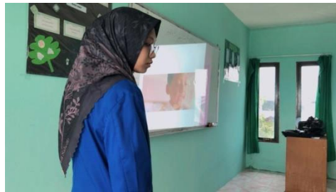
Gambar 4.9 Media motivasi

Peneliti mengamati (Observasi) pengalaman lapangan.