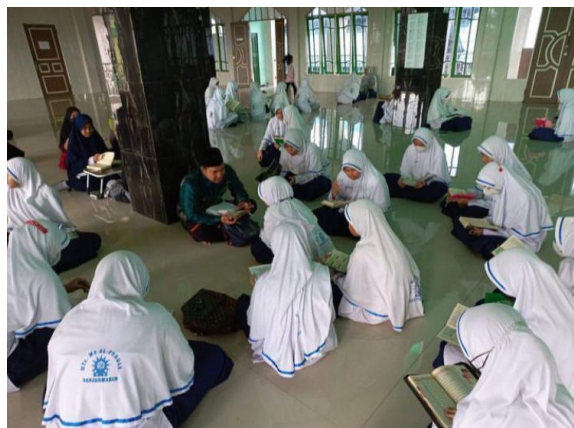
Gambar 4.5 Tadarus