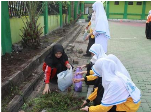
Gambar 4.7 Penghijauan

Dengan mencintai apa yang telah Allah ciptakan merupakan bentuk akhlak kita dalam menjaga ciptaannya