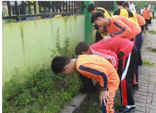
Gambar 4.8 Penghijauan