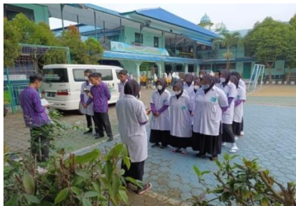
Gambar 4.3 Hukuman

Bagi sebagian peserta didik tata tertib yang ada di sekolah sulit untuk dijalani ataupun dipatuhi, hal tersebut membuat peserta didik sangat sulit mengontrol diri untuk selalu mematuhi peraturan yang telah ditetapkan sekolah.