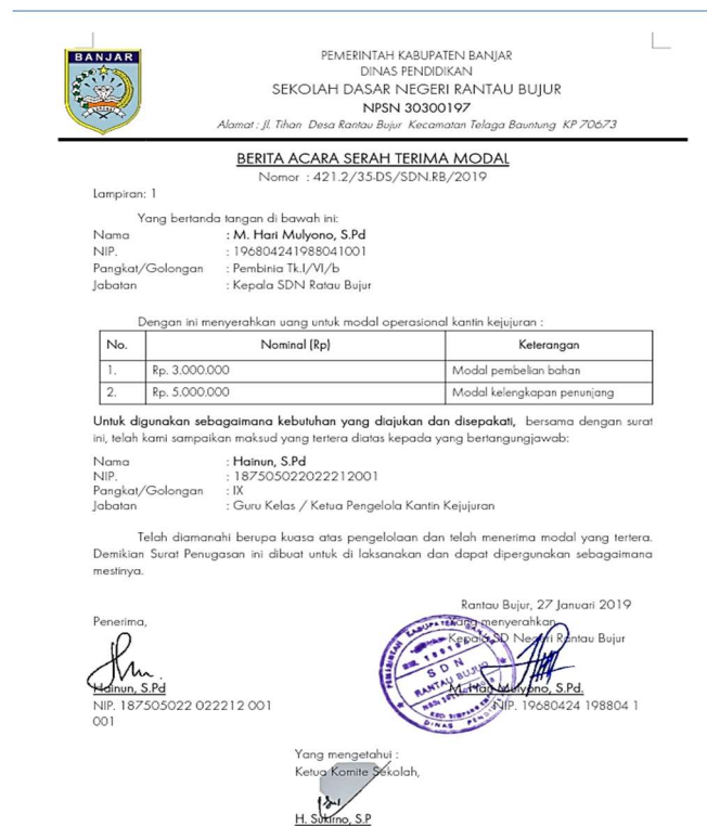
Gambar 4.3 Bukti Modal, Arsip Tata Usaha SDN Rantau Bujur