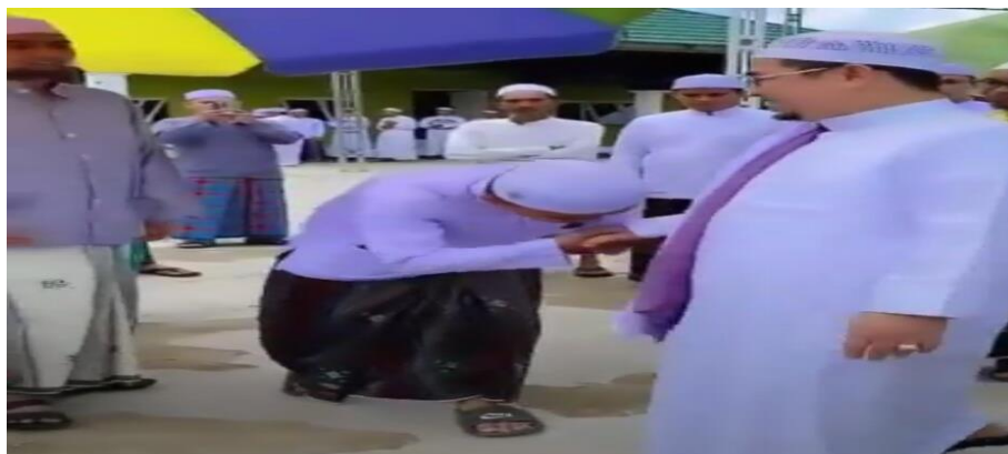
Gambar 4.6 Santri Bersalaman dengan ustadz 38

Dari hasil lapangan yang peneliti amati bahwa diluar jam pembelajaran sebagian santri mencotohkan hal yang positif seperti ketika bertemu dengan guru/ ustadz yang ada di pondok selalu bersalaman dan mencium telapak tangan ataupun menundukan badannya yang mana telah dipelajari tentang berkhilak kepada baginda Rasulullah bahwa pentingnya memiliki adab dan akhlak pada santri di Pondok Pesantren Ibnu Mas'ud Putra.