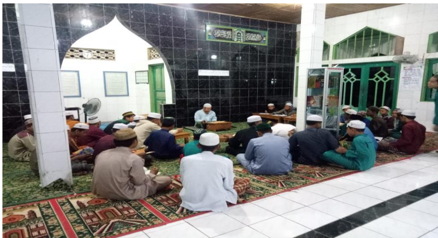
Gambar 4.4 Kegiatan Bimbingan Akhlak 34

Adapun bimbingan keagamaan yang diberikan ustadz di Pondok Pesantren Ibnu Mas'ud Putra yang dilaksanakan pada setiap malam Rabu setelah selesai Shalat Magrib berjamaah, pada saat pelaksanaan bimbingan keagamaan para satri duduk membentuk lingkaran seperti mengelilingi ustadz pembimbingnya, sebelum memulai bimbingan ustad terlebih dahulu membaca doa belajar sekaligus diiringi oleh santrinya selanjutnya ustadz pembimbing membacakan seluruh materi yang akan dipelajari ketika ustad pembimbing membacakan materi santri sambil membaris atau menghrakati tulisan dalam kitab rujukan kemudian dilanjutkan memberi penjelasan di setiap paragraf oleh ustadz pembimbing. Pada proses memberikan bimbingan para santri dituntut untuk memahami, mendengarkan dan memperhatikan materi yang telah disampaikan oleh ustadz karena sangatlah penting bagi santri untuk