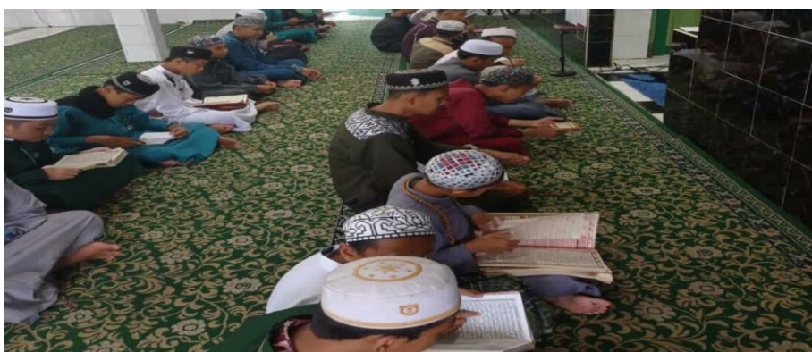
Gambar 4.7 Bimbingan Kegamaan Menghafal Al-Quran 40

Ustadz pembimbing di Pondok Pesantren Ibnu Mas'ud Putra tersebut membimbing santrinya dalam menghafal Al-Qur'an dan menuntut agar para santrinya tidak hanya menghafal tetapi juga mampu membaca Al-Qur'an sesuai dengan aturan bacaan ilmu tajwid yang masyur serta dapat memahami makna atau kandungan dari ayat-ayat Al-Quran yang telah mereka hafalkan.