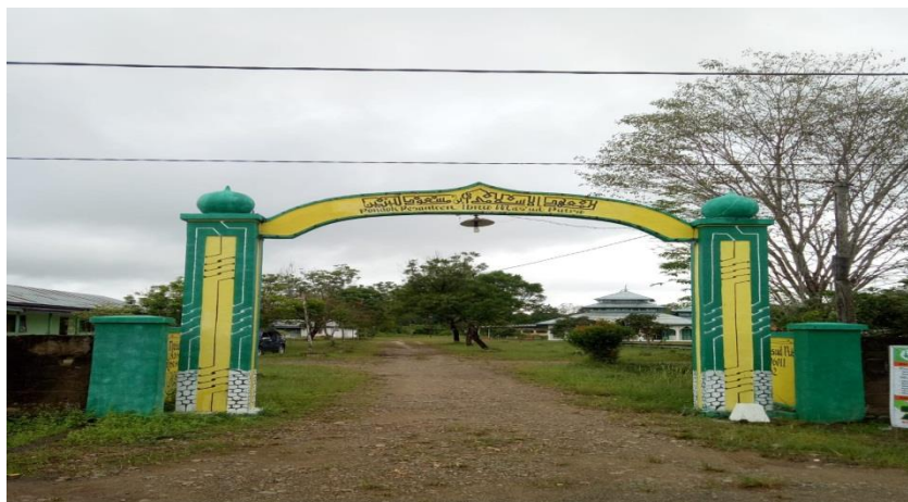
Gambar 4.3 Pondok Pesantren Ibnu Mas'ud Putra