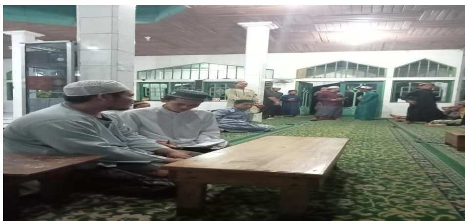
Gambar 4.5 Wawancara dengan ustadz pembimbing keagamaan Akhlak 36

Dari hasil dilapangan tersebut peneliti mengamati bahwa