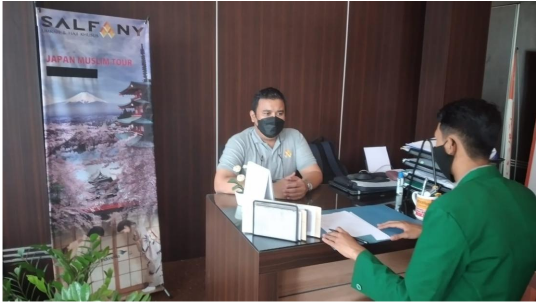
Wawancara dengan Kepala Divisi Operasional PT Salfany Safanusa Banjarmasin