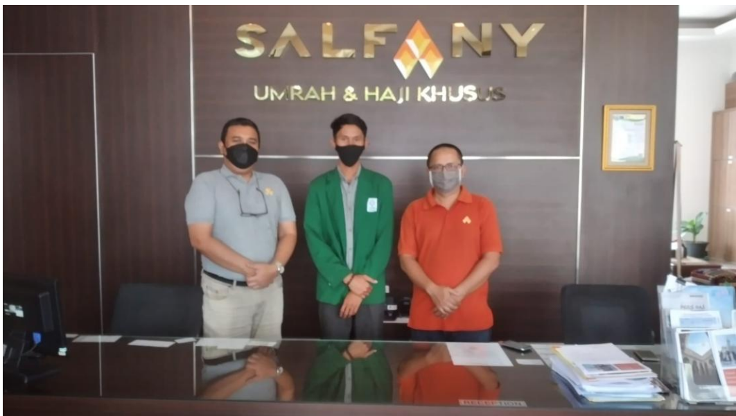
Bersama Pendiri PT Salfany Safanusa Banjarmasin