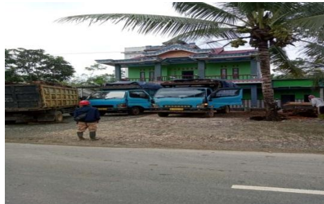
Pengangkutan Buah Kelapa Sawit Borongan