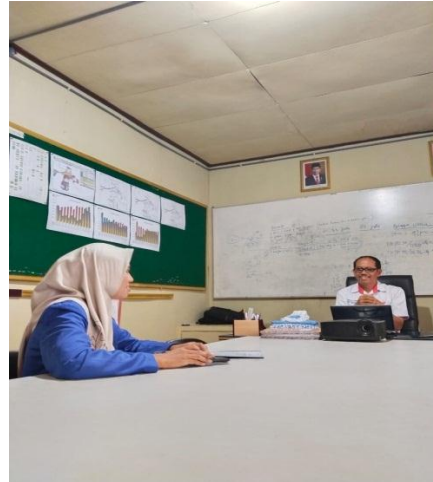
Wawancara Ketua KUD Mekar Bersama