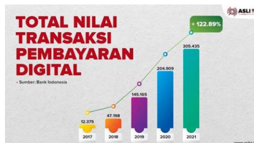
Gambar 1. 2 Total nilai transaksi pembayaran digital

Dapat dilihat dari gambar diatas menunjukkan bahwa penggunaan E-Wallet terlihat berkembang di Indonesia di kuasai oleh sepuluh produk dengan developer terbaik dari masing-masingnya. Aplikasi ini mampu menarik masyarakat dalam bertransaksi di karenakan aplikasi ini paling membantu dan mempermudah masyarakat yaitu Gopay, Dana, Ovo, ShopeePay , Link Aja, i, saku, Octo Mobile, Doku, Sakuku, dan JakOne Mobile.(Rangkuty, 2021, hlm. 256).