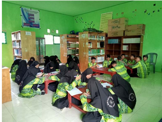
Gambar 4.5 belajar bersama dengan siswa-siwi di perpustakaan

Dengan cara ini perpustakaan MAN 3 barito Kuala dari segi pelayanan sudah sangat meningkat. Sebagaimana penjelasan yang telah dipaparkan oleh MH sebagai kepala perpustakaan pada tanggal 28 januari 2023 sebagai berikut: