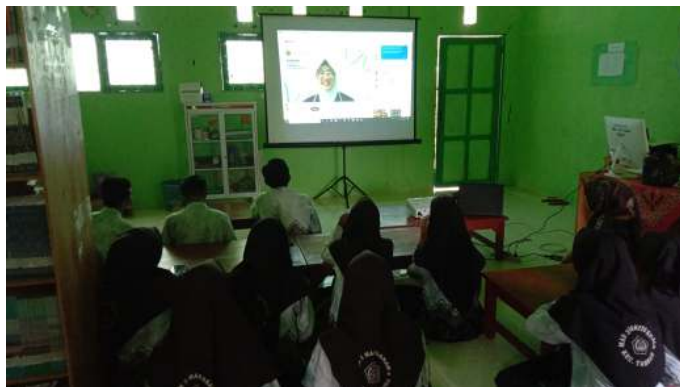
Gambar 4.4 fasilitas proyektor untuk siswa-siswi belajar di perpustakaan

Perpustakaan MAN 3 Barito Kuala dalam meningkatkan pelayanannya yakni dengan cara menyediakan fasilitas yang membuat pengguna perpustakaan yang berkunjung nyaman berada di perpustakaan nya. Perpustakaan nya juga menyediakan fasilitas yang berupa ac, proyektor, air putih dan lain sebagainya. Seperti contoh gambar di bawah ini.