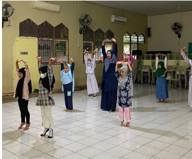
Gambar 4. 4 Kegiatan Ekstrakurikuler untuk Gerakan Tari Radap Rahayu

dilakukan pada pertemuan kedua atau ketiga setelah siswa diajarkan gerakan dasar dan sudah mulai memahaminya. Sebelumnya juga siswa akan dikenalkan beberapa seni tari dan juga makna seni tari yang akan diperagakan yaitu Radap Rahayu dan juga Giring-giring.