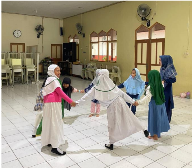
Gambar 4. 5 Gerakan Tari Giring-Giring

Gambar di atas adalah peragaan salah satu gerakan tari Giring-Giring. Seni tari ini tergolong mudah untuk dilakukan sehingga cocok dilakukan untuk siswa yang masih belajar dan tertarik dengan seni tari khususnya kelas 4. Ibu NAS menjelaskan bahwa: