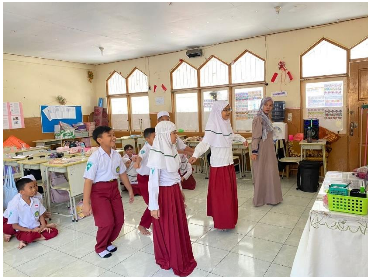
Gambar 4. 3 Peragaan Tari pada Pembelajaran SBK

Setelah melakukan teori dengan cara mengenalkan seni tari melalui buku dan video, guru SBK juga mengajarkan anak untuk melakukan peragaan seni tari yang ada dalam video. Seni tari yang digunakan adalah tari Radap Rahayu dan juga Giring-giring, sehingga melalui seni tari tersebut anak-anak akan mudah mengikuti, karena gerakan yang ada dalam tari tersebut juga tidak tergolong sulit. Guru SBK terlebih dahulu melakukan peragaan untuk mencontohkan siswa gerakan tari yang ada dalam video, kemudian meminta siswa untuk melakukan gerakan yang sama.