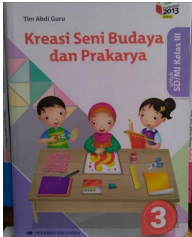
Gambar 4. 1 Buku Paket Pembelajaran SBK Kelas 3

Di awal guru akan bertanya tentang pengertian tari menurut siswa, kemudian jenis tari yang diketahui, identitas yang melekat pada seni tari tersebut. Setelah metode tanya jawab dilakukan kemudian guru juga akan menjelaskan mengenai seni tari yang ada di buku paket atau menjadi materi pembelajaran.