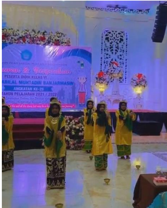
Gambar 4. 6 Penampilan Tari Oleh Siswa pada Acara Perpisahan Sekolah

Gambar di atas adalah salah satu seni tari yang dilakukan oleh siswa kelas 4 dan 5 pada acara perpisahan kelas 6 SDI Sabilal Muhtadin Kota Banjarmasin. Seni tari yang ditampilkan umumnya adalah tari Radap Rahayu yang juga telah dipelajari oleh siswa peserta kegiatan ekstrakurikuler.