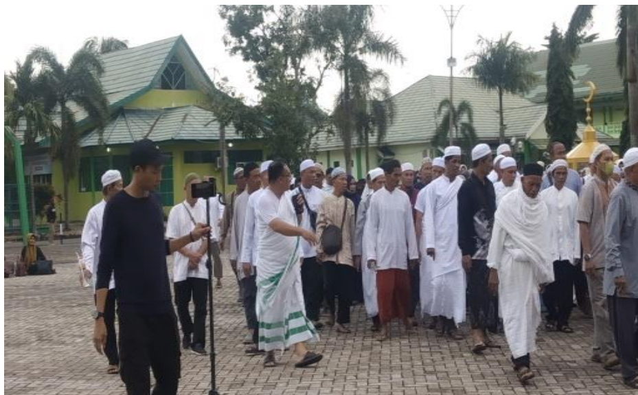
Gambar 4.3 Media dalam Pelaksanaan Manasik Haji dan Umrah

“Seluruh pegawai dilibatkan dalam pelaksanaan kegiatan bimbingan manasik supaya berpotensi dan untuk dilatih membimbing orang manasik diasrama haji dengan diikutkan secara langsung pada kegiatan manasik agar mereka terbiasa dalam membimbing jemaah manasik ataupun manasik pada sekolahan TK, SD dan sederajatnya” . 18