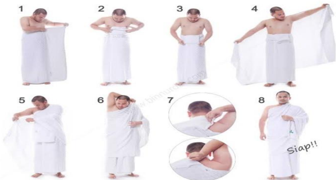
Foto 4.4 Pakaian Ihram Laki-laki