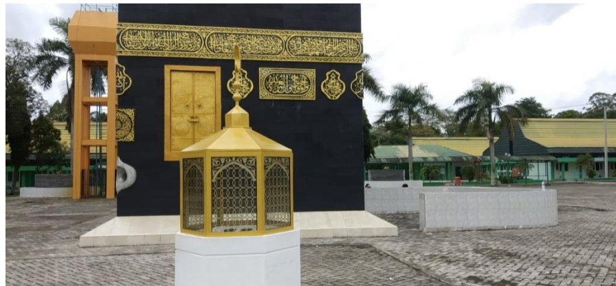
Gambar 4.8 Area Manasik

Asrama Haji mempunyai sarana dan prasarana berupa area manasik, hal ini sangat bagus dan mendukung dalam acara kegiatan bimbingan manasik haji dan umrah karena semua peserta itu langsung kelapangan untuk praktik, dan memudahkan untuk melaksanakan acara secara langsung.