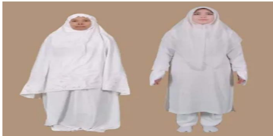
Foto 4.5 Pakaian Ihram perempuan