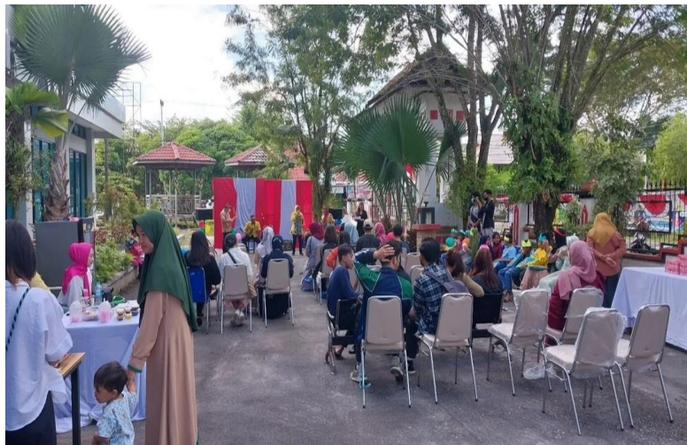
Kegiatan Inovasi Perpustakaan