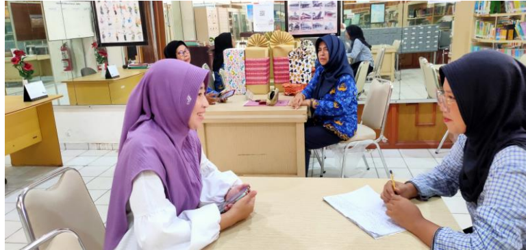
Wawancara dengan Pustakawan