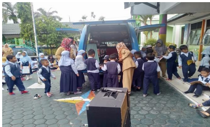
Kegiatan Perpustakaan Keliling ke Sekolah