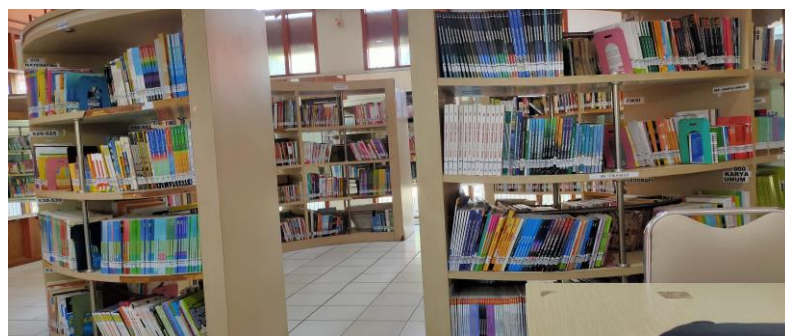
Rak Buku Ruang Remaja