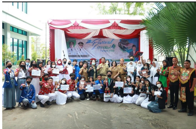
Kegiatan Festival Literasi