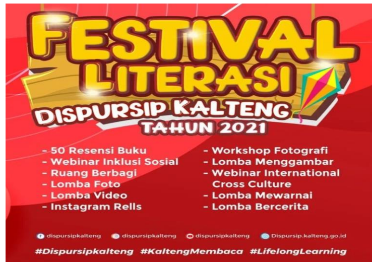
Pamflet Kegiatan Festival Literasi