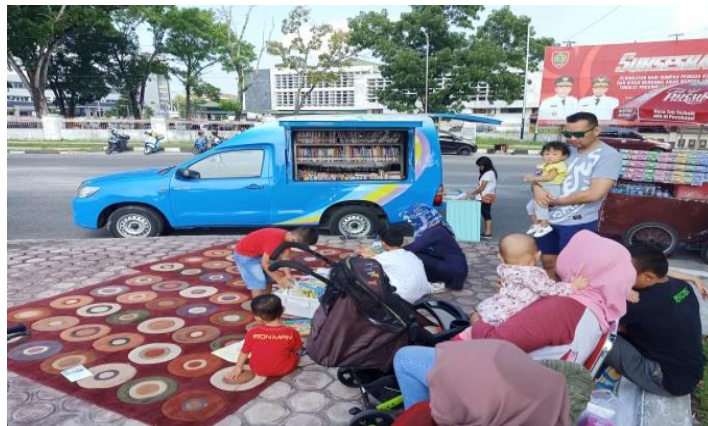
Kegiatan Perpustakaan Keliling di CarfreeDay