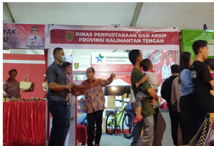
Pameran Perpustakaan pada Kalteng Expo 2023