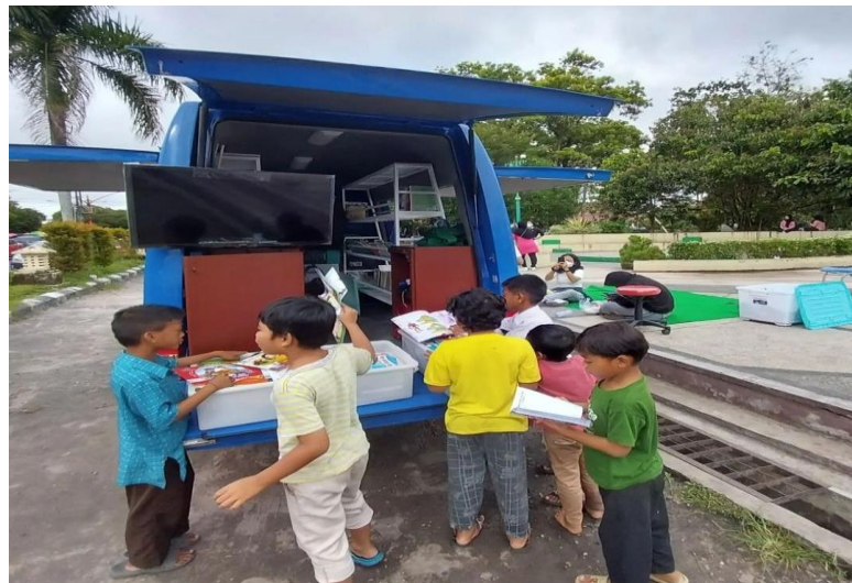
Perpustakaan Keliling CarfreeDay