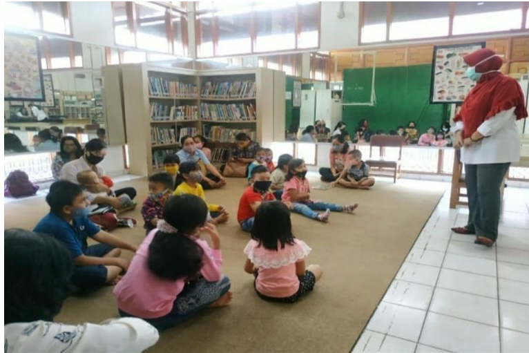
Kegiatan Story Telling