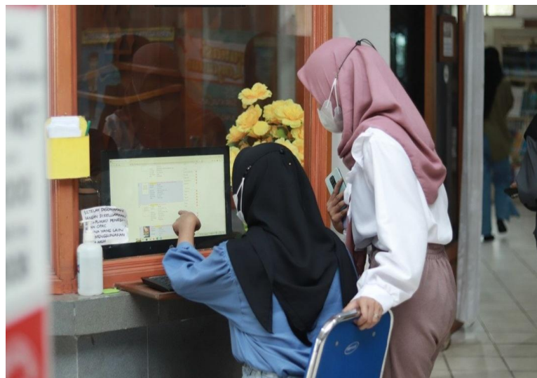
Pencarian Koleksi melalui Opac