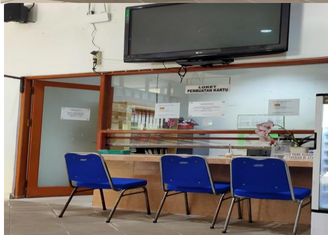
Loket Pembuatan Kartu Anggota