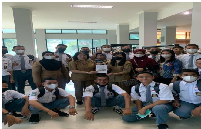
Gambar 1.9 Kunjungan Sekolah ke Perpustakaan

Dengan memberitahukan dan menjelaskan seputar tentang Dinas Perpustakaan dan Arsip Provinsi Kalimantan Tengah, baik mengenai koleksi-koleksi yang ada, jam layanan, kegiatan pengadaan lomba, dan yang lebih sering disosialisasikan ialah i-Kalteng.