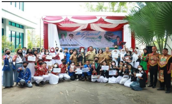
Gambar 1.5 Festival Literasi

Festival literasi merupakan festival besar yang diadakan setahun sekali oleh Dispersip Kalteng. Berbagai kegiatan dari bermacam-macam lomba seperti lomba menulis literasi untuk jurnalis, lomba bercerita, lomba pemilihan pemustaka terbaik dan lomba resensi atau review bahan pustaka yang ada di perpustakaan.