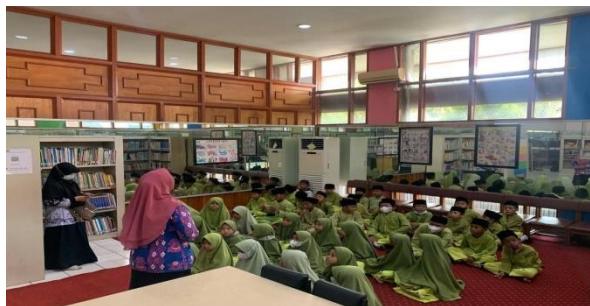
Gambar 1.1 StoryTelling

Story telling yang dilakukan oleh Pustakawan pada Dinas Perpustakaan dan Arsip Provinsi Kalimantan Tengah ialah dengan mengundang atau berkunjung secara langsung untuk bercerita kepada anak-anak menggunakan media buku dan beberapa alat peraga. Cerita yang diceritakan pustakawan ada Kancil yang cerdik pada tanggal 17 April 2023, kisah raja hutan pada tanggal 02 Mei 2023 , semut dan belalang pada tanggal 13 Mei 2023, dan malin kundang pada tanggal 22 Mei 2023.