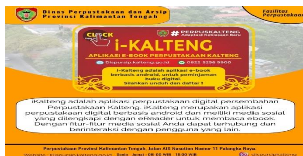
Gambar 1.4 Layanan Buku Elektronik

Layanan buku elektronik adalah layanan melalui aplikasi digital yaitu aplikasi i-Kalteng yang dipersembahkan oleh perpustakaan kalteng. i-Kalteng ini merupakan aplikasi perpustakaan digital berbasis android dan memiliki media sosial yang dilengkapi dengan eReader untuk membaca ebook. Cara mendaftar i-Kalteng ini dengan cara menggunakan email dan setelah daftar dapat langsung mengakses koleksi yang ingin dicari.