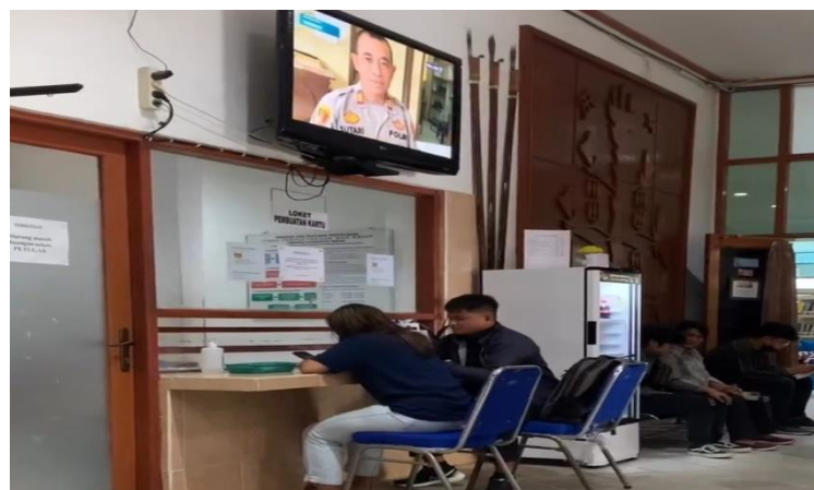
Gambar 1.11 Pembuatan Kartu Anggota

Berdasarkan observasi yang dilakukan diperoleh data bahwa Dinas Perpustakaan dan Arsip Provinsi Kalimantan Tengah melakukan bimbingan pemustaka yang masih belum mengetahui bagaimana cara membuat kartu anggota maupun peminjaman dan pengembalian buku dan apa saja yang ada di perpustakaan.