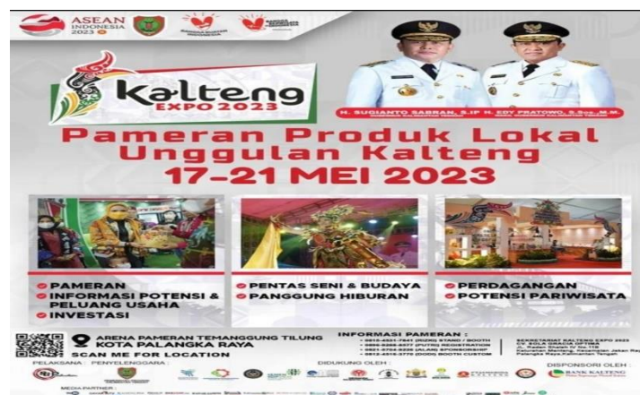
Gambar 1.7 Pamflet Event Kalteng Expo

Pameran perpustakaan ini diadakan pada saat event tertentu seperti Kalteng Expo. Dispersip Kalteng ikut memeriahkan event tersebut dengan memamerkan koleksi-koleksi perpustakaan, Dispersip Kalteng juga mengadakan pengundian hadiah untuk dibagikan masyarakat dengan cara pengisian buku yang tercantum nama, pekerjaan, dan nomor telepon.