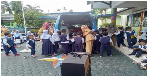
Gambar 1.3 Perpustakaan Keliling ke Sekolah TK

Dengan demikian kegiatan perpustakaan keliling dapat mengasah dan menumbuhkan minat seseorang untuk berkunjung dan membaca lebih lanjut bacaan yang mereka baca saat CFD serta dapat meminjam buku tersebut.