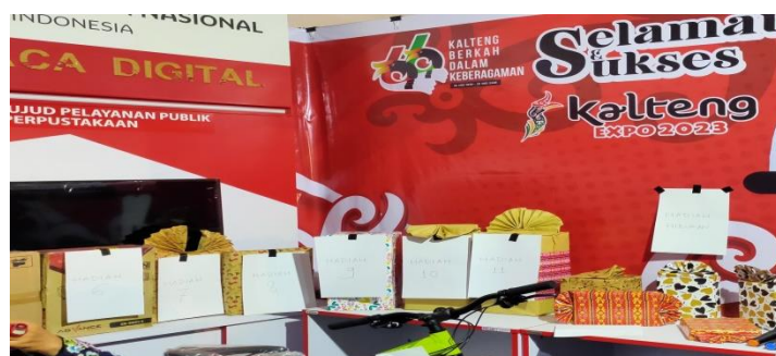
Gambar 1.8 Hadiah Undian