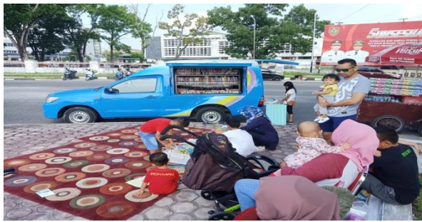
Gambar 1.2 Perpustakaan Keliling CFD

Perpustakaan keliling yang dilakukan oleh dinas perpustakaan dan arsip provinsi kalimantan tengah ialah dengan mendatangi ke berbagai sekolah-sekolah yang ada di Palangka Raya seperti TK/SD kemudian menjalankan kegiatan perpustakaan keliling di event carfreeday(CFD) yang berada di bundaran besar pada hari minggu.