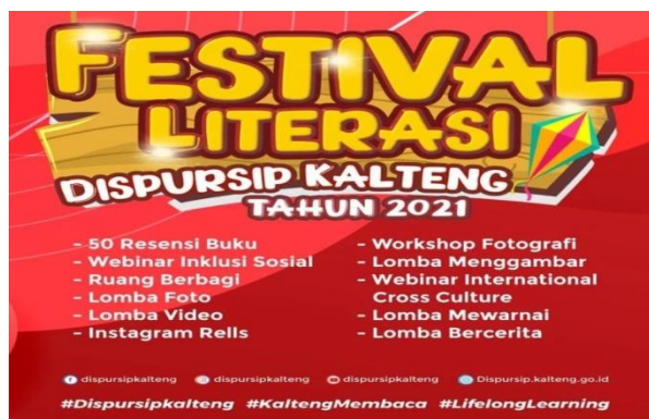
Gambar 1.6 Pamflet Lomba Festival Literasi

Dengan demikian festival literasi ini dapat membuat masyarakat menjadi terus berkunjung dan mencari informasi lomba apa saja yang diadakan dan bagaimana sih festival literasi itu.