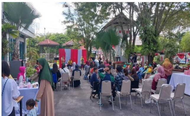
Gambar 1.10 Inovasi Perpustakaan untuk Donasi Literasi

Inovasi perpustakaan ialah upaya Dinas Perpustakaan dan Arsip Provinsi Kalimantan Tengah dalam melakukan pelayanan publik dengan meningkatkan pemberdayaan masyarakat dan peningkatan kesejahteraan masyarakat.