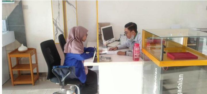
Foto Bersama Karyawan Pada Saat Wawancara PT Pegadaian Syariah Cabang Kebun Bunga Banjarmasin.