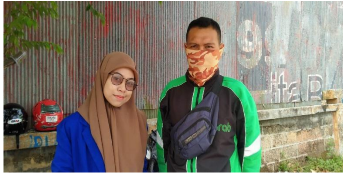
Foto Bersama Nasabah – Nasabah ( Driver Grab) Pegadaian Syariah Cab. Kebun Bunga Banjarmasin