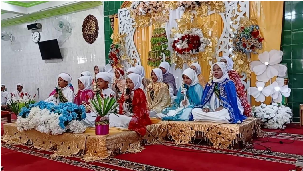
Foto Bersama Santri