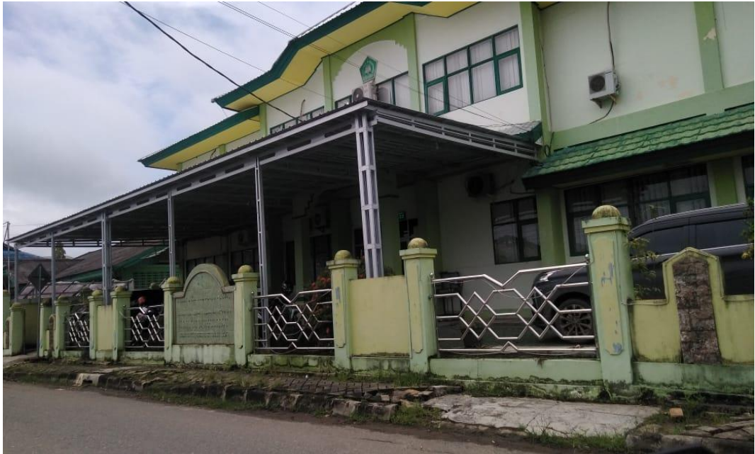
Kantor Kementerian Agama Kabupaten Kotabaru