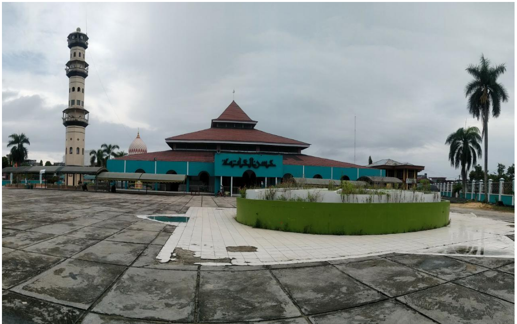
Masjid Raya Husnul Khatimah Kotabaru