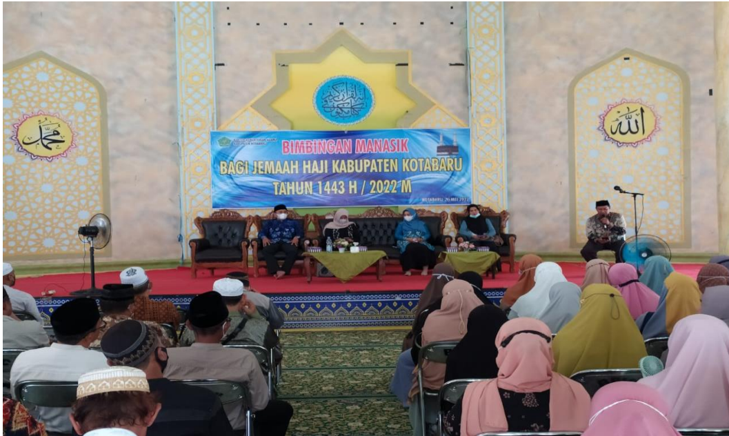
Bimbingan Manasik Haji