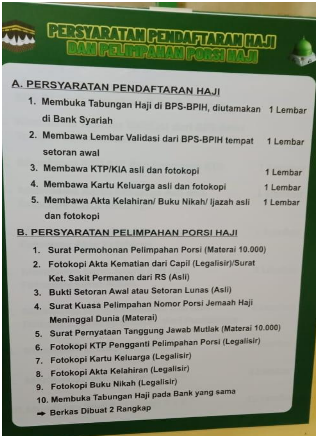
Persyaratan Pendaftaran Haji