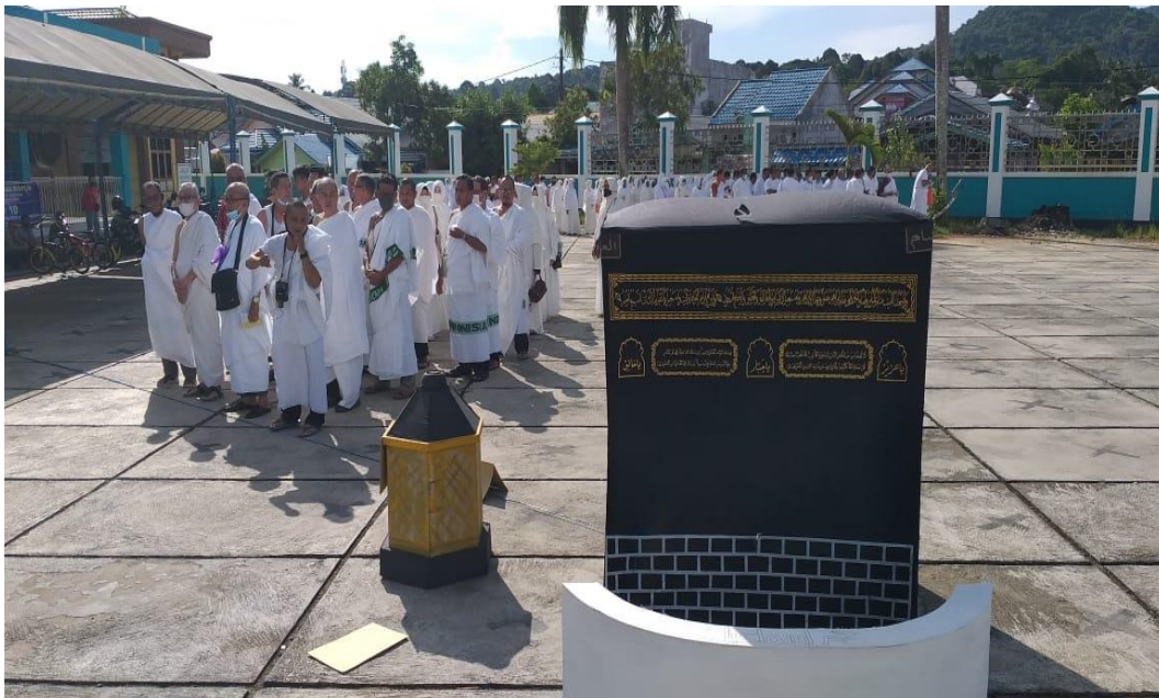
Praktek Manasik Haji di Masjid Taya Husnul Khatimah