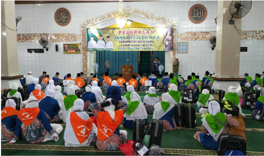
Acara Pelepasan Calon Jemaah Haji Kotabaru