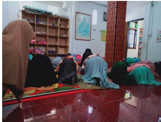
Gambar 3 praktik sholat di kelas