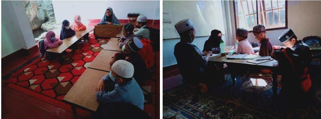
Gambar 1&2 suasana pembelajaran di kelas