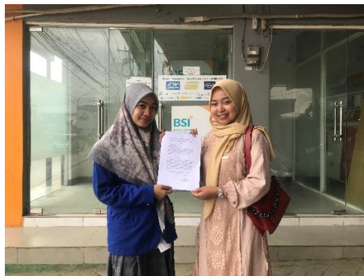
Pembagian Angket, 2023