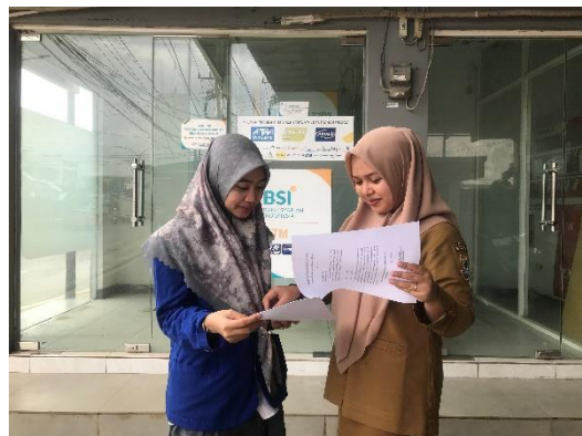
Pembagian Angket, 2023