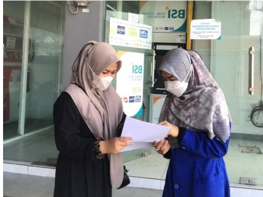
Pembagian Angket, 2023