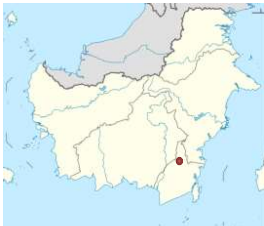
Gambar III Letak Wilayah Kabupaten Tabalong di Peta Pulau Kalimantan

Pada wilayah Kabupaten Tabalong berada di Provinsi Kalimantan Selatan, yang berbatasan dengan: