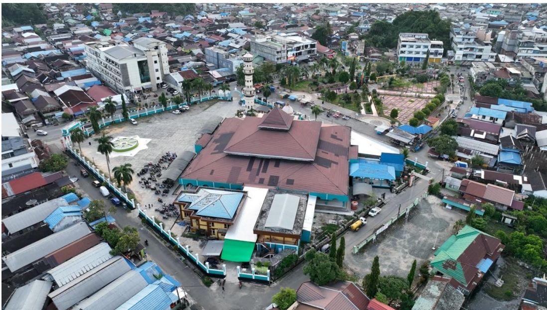
Masjid Agung Husnul Khatimah Kab. Kotabaru