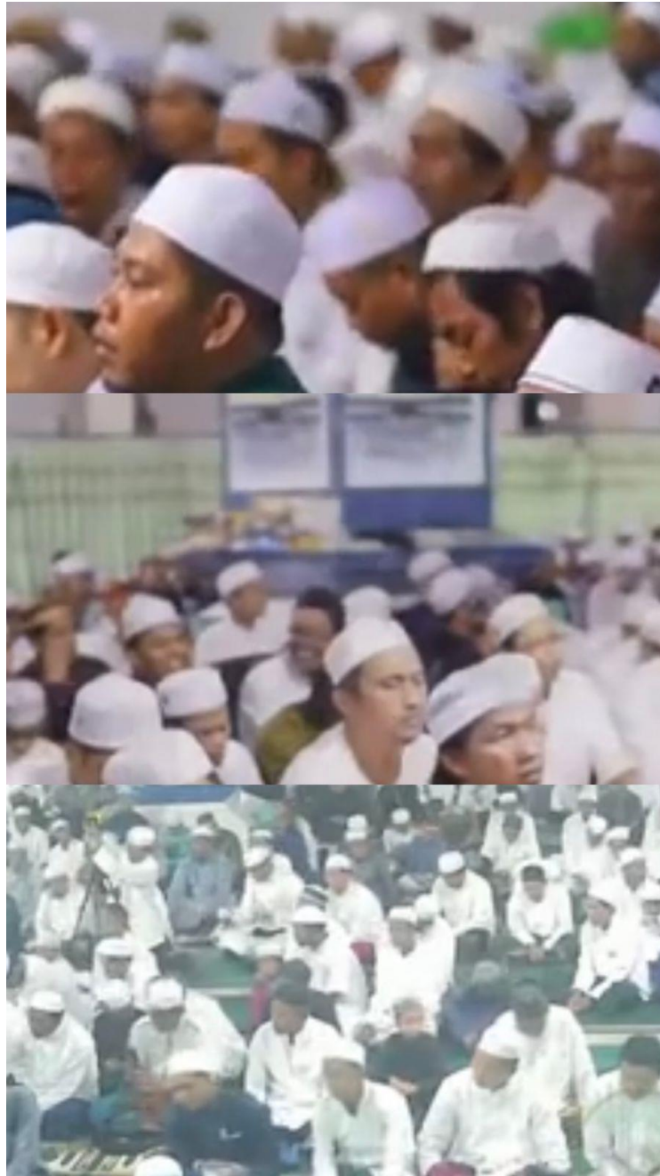
Kegiatan Pengajian Pada Waktu Malam Minggu Setelah Sholat Maghrib