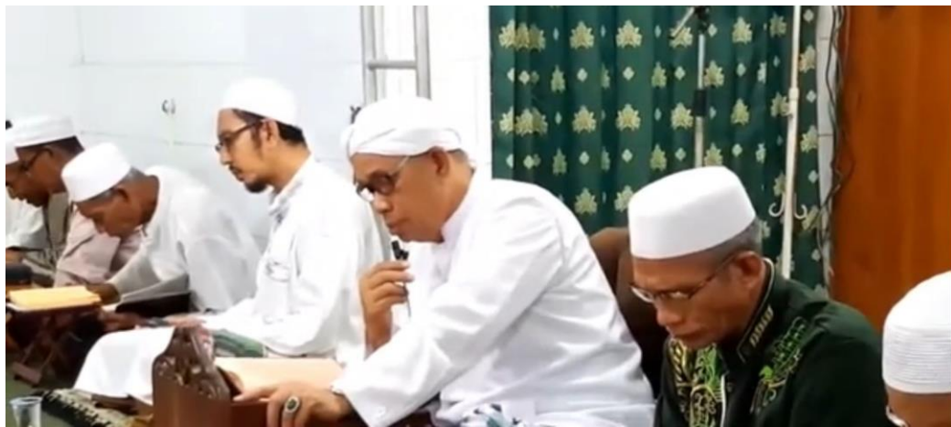
Kegiatan Pengajian waktu Subuh Jum'at