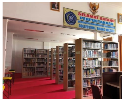
Gambar 6. 1 Perpustakaan Universitas Muhammadiyah Banjarmasin

Sebagai sumber dan pusat layanan informasi, perpustakaan Universitas Muhammadiyah Banjarmasin merupakan sumber pembelajaran dan sumber aktivitas intelektual yang sangat penting bagi segenap sivitas akademika dalam mendukung tercapainya program Tridarma Perguruan Tinggi.