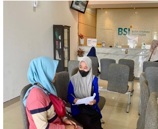
Wawancara dengan Nasabah