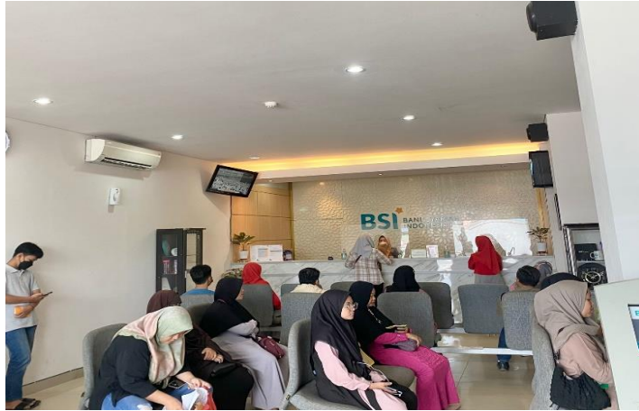
Nasabah Bank Syariah Indonesia Kantor Cabang Tanjung