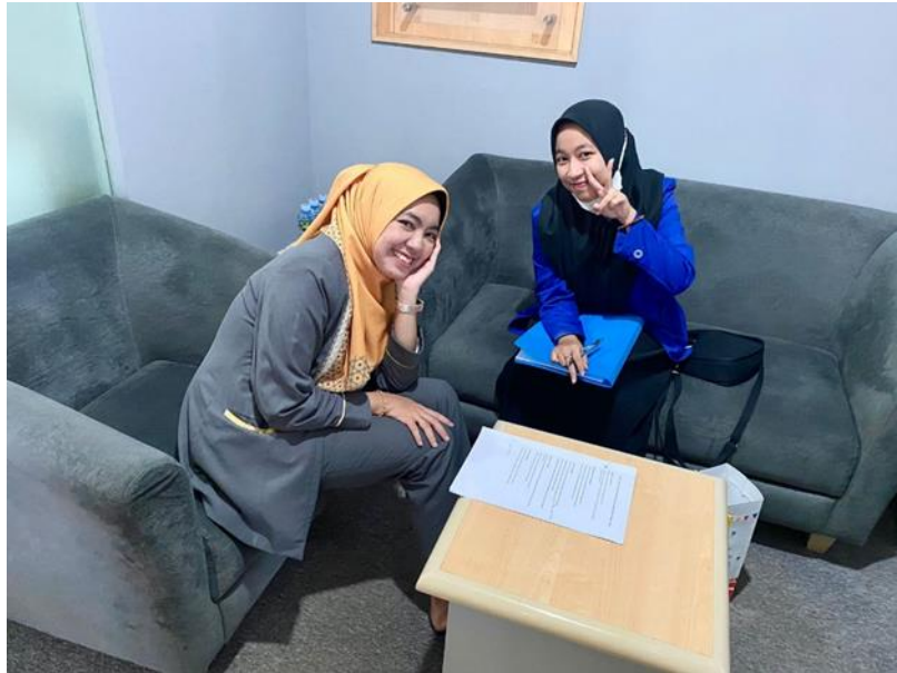
Wawancara dengan Teller