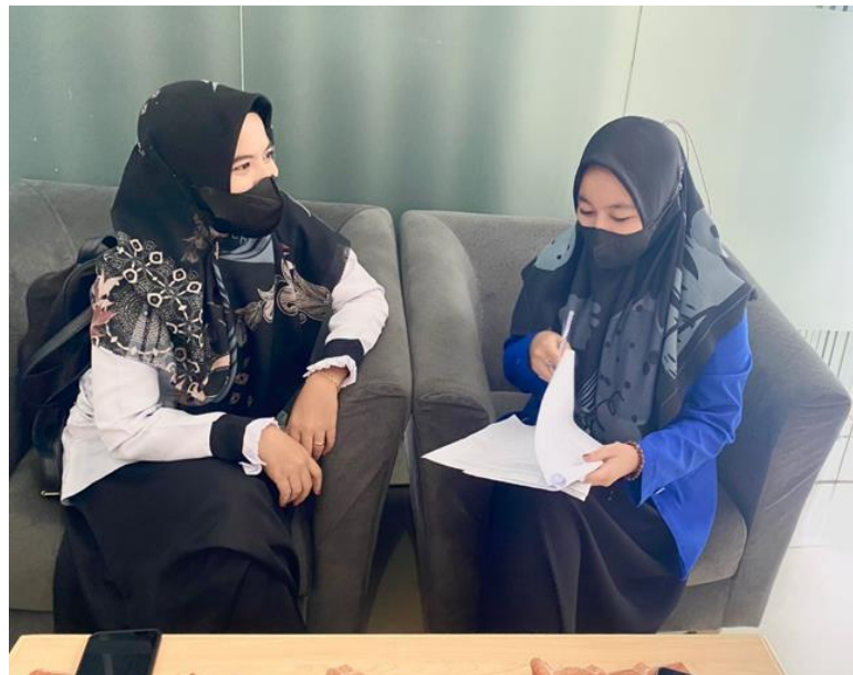
Wawancara dengan Nasabah