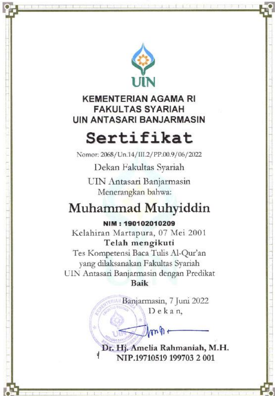
Lampiran 9: Sertifikat Baca Tulis Al-Qur'an.