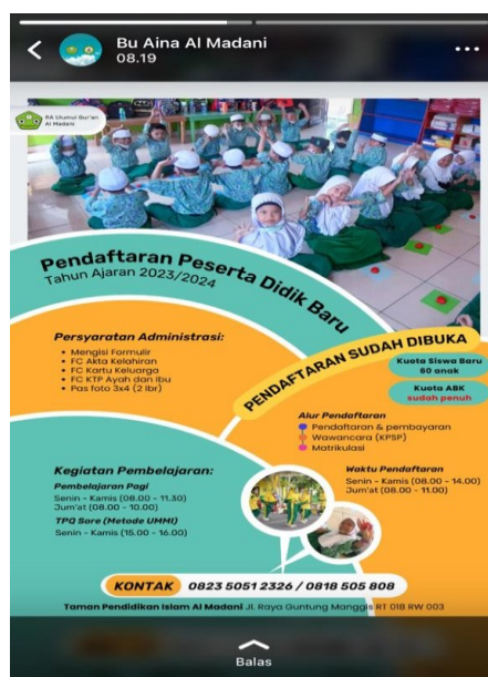
Gambar 4.4 Media Sosial WhatsApp Sekolah RA Ulumul Qur'an Al Madani

yang diberikan, kami sebagai guru dalam pelaksanaannya bertugas untuk memposting kegiatan di sosial media masing-masing” 83 . Kemudian ibu K sebagai guru wali kelas B1 menambahkan sebagaimana hasil wawancara berikut: “Untuk secara langsung mungkin tidak tapi sebagai guru kan paling dalam kelas waktu pembelajaran berlangsung. Kemudian memposting poster-poster yang dibagikan lewat status media sosial.” 84