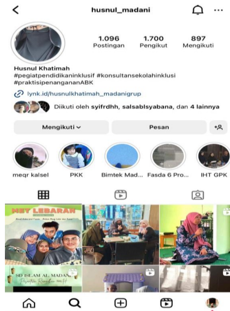
Gambar 4.5 Media Sosial Instagram Kepala Sekolah RA Ulumul Qur'an Al Madani