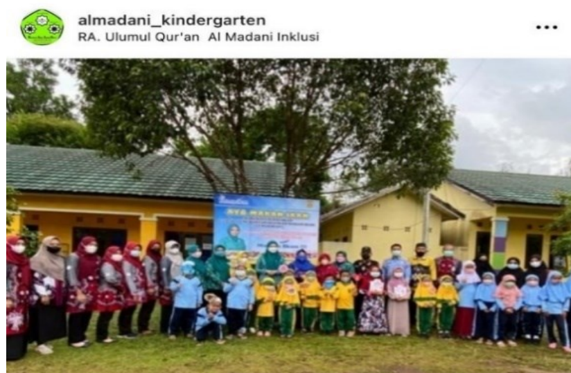
Gambar 4.6 Kegiatan Anak Bersama Ibu Wali Kota