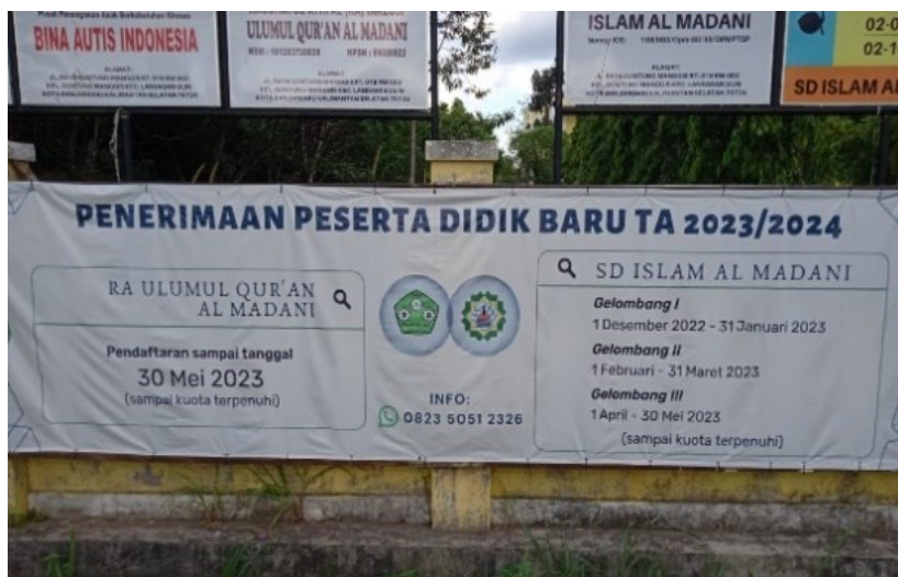
Gambar 4.2 Spanduk Penerimaan Peserta Didik Baru

Alhamdulillah, saya seperti menemukan sekolah yang cocok untuk anak saya karena sekolah ini sangat terbuka terhadap anak berkebutuhan khusus.” 78