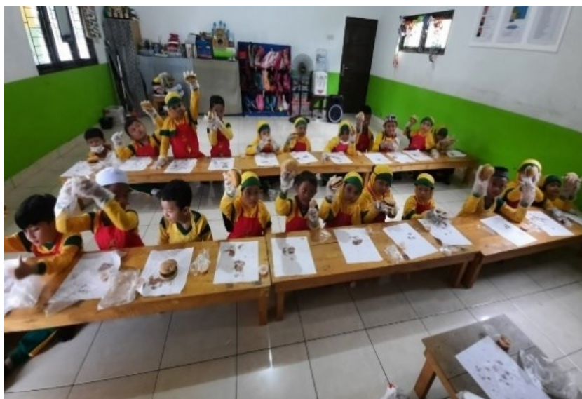
Gambar 4.1 Aktivitas Anak Cooking class Bersama Pihak Rumah Makan RC

unggulan yang dilakukan sekolah secara langsung pihak sekolah juga bekerjasama dengan beberapa pihak terkait. Adapun untuk program tahunan yang dilakukan oleh sekolah RA Ulumul Qur'an Al Madani terlampir. Berikut beberapa program yang ada di sekolah, RA Ulumul Qur'an Al Madani: 1) Pembiasaan menghafal doa, surah dan hadis pendek, 2) Pembiasaan sholat dhuha, 3) Mengaji dengan metode ummi, 4) Manasik haji, 5) Outing Class , 6) Market Day , 7) Peringatan hari disabilitas, 8) Pentas seni.