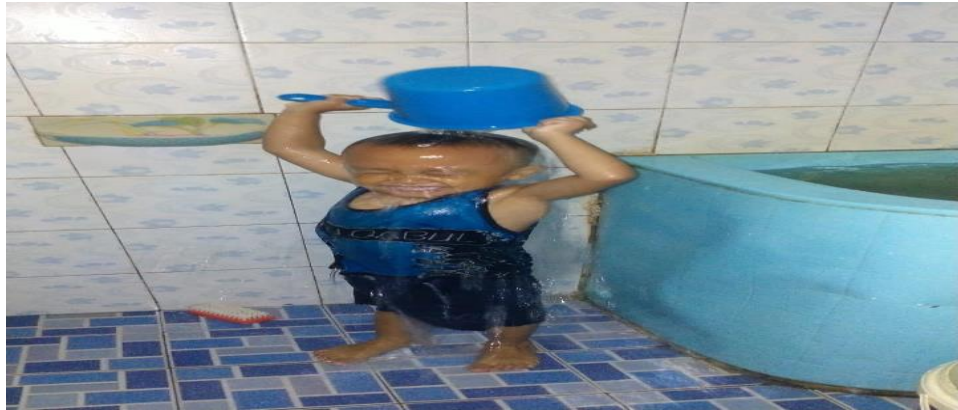
Gambar 4.3 Aktivitas Adik MA ketika mandi sendiri

mengambil sabun dan membersihkan badannya sendiri tanpa bantuan dari orang tuanya.