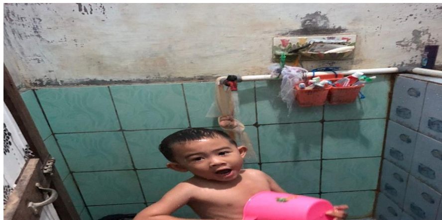
Gambar 4.23 Aktivitas Adik OS ketika sedang mandi

OS terlihat juga sudah mampu mandi sendiri, ia sangat senang ketika disuruh mandi sendiri yang dimulai dengan mengguyurkan air ke badannya dan mengusapkan sabun untuk membersihkan dirinya.