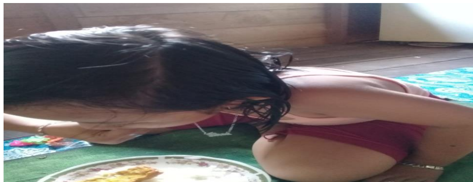
Gaambar 4.9 Aktivitas Adik DQN ketika sedang makan

DQN juga sudah bisa untuk mandi sendiri, tanpa dibantu oleh orang tuanya. Kemudian, dilanjutkan dengan memilih pakaiannya sendiri dan memakainya sendiri, walaupun waktu awal-awal DQN masih kesulitan, namun karena terus dilatih dan dibiasakan lama-kelamaan DQN menjadi bisa melakukannya sendiri.