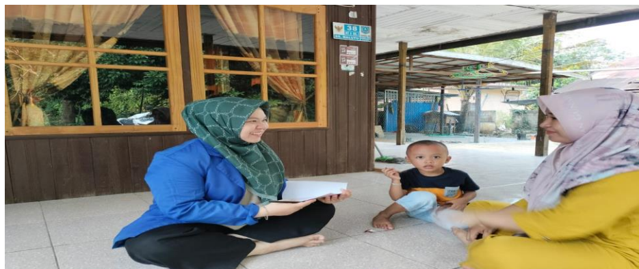
Gambar 4.1 Wawancara dengan Ibu RR mengenai peran orang tua dalam menanamkan kemandirian anak

Kali ini wawancara dilakukan di rumah ibu RR melalui pertanyaan yang peneliti tanyakan, kemudian ibu RR menjawab “ Menurut ulun orang tua tuh berperan banar supaya anak tumbuh mandiri. Mun ulun saurang ding ai melatih anak ulun supaya mandiri nih ulun mulai lagi halus, dari kita dahulu mencontohkan yang baik, misalnya MA nih ulun ajari makan saurang, walaupun awal-awal tuh makannya celemotan, bahtu ulun biasaakan ai mandi saurang, dilajari jua makai baju saurang walaupun masih dibantui, sudah tuntung bemainan ulun suruh meandak mainannya saurang hakun haja pang ” (CLWOTI1) 45