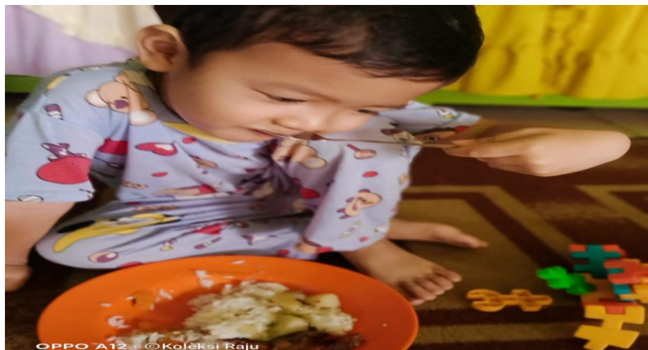
Gambar 4.19 Aktivitas Adik MR ketika sedang makan

Dari hasil observasi terlihat bahwa MR juga sudah mampu untuk makan makan sendiri, MR makan menggunakan sendok dan memakannya dengan sangat lahap tanpa harus disuapi oleh orang tuanya. MR juga terlihat makan dengan tenang tidak bersuara dan tidak berhamburan.