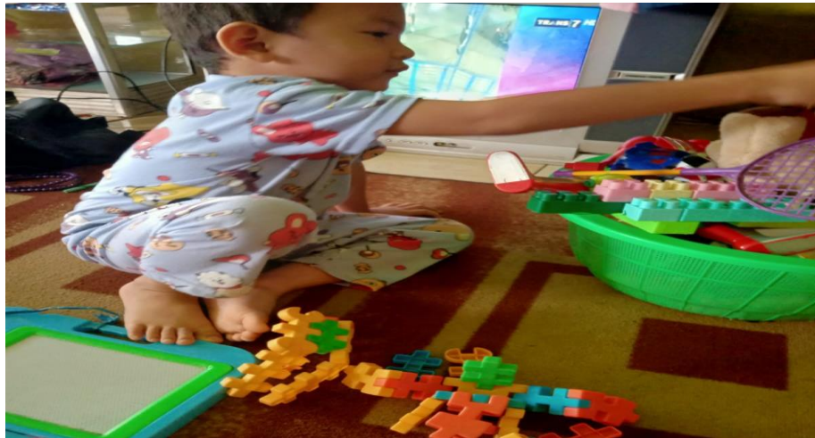
Gambar 4.20 Aktivitas Adik MR ketika sedang merapikan mainan

bertanggung jawab merapikan dan mengembalikan mainannya ketempatnya semula.