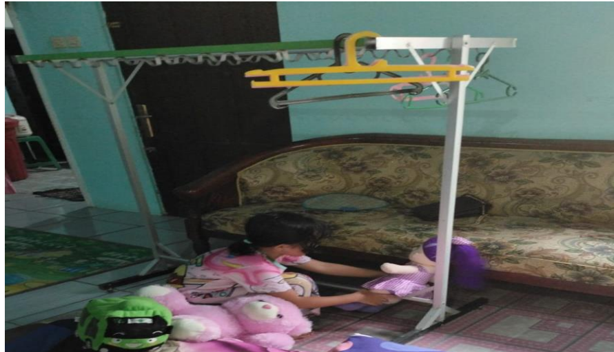
Gambar 4.12 Aktivitas Adik DQN ketika sedang bermain boneka