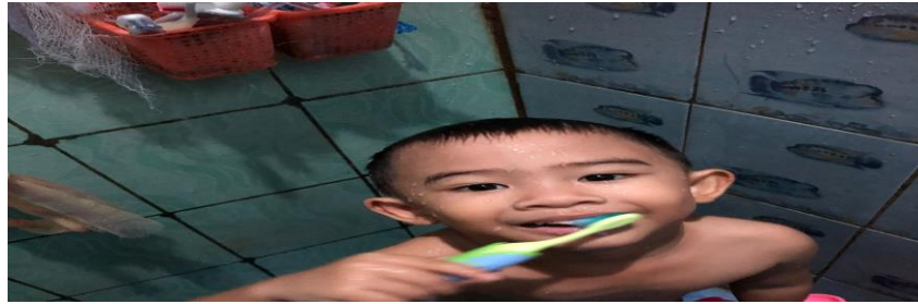
Gambar 4.23 Aktivitas Adik OS ketika sedang menggosok gigi

Adik OS sudah bisa memakai baju sendiri, ia juga kerap memilih sendiri baju apa yang ingin dipakainya.