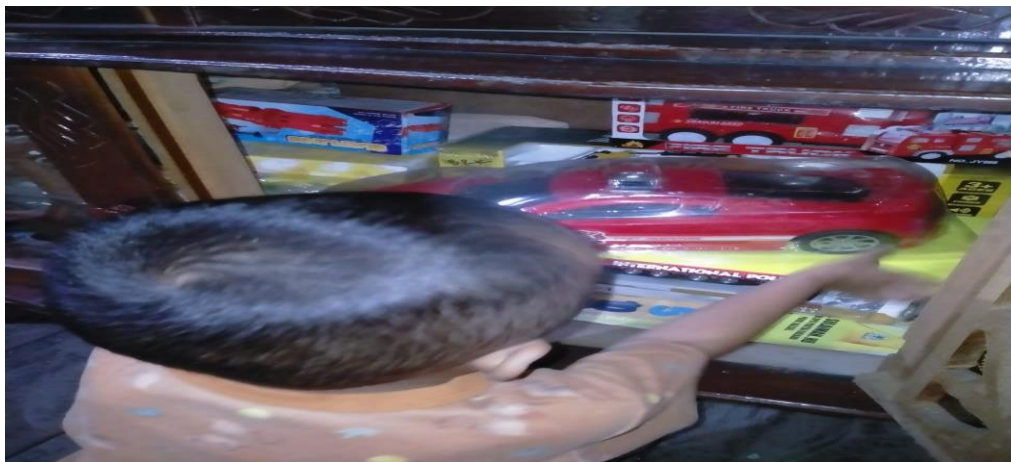
Gambar 4.2 Aktivitas Adik MA membereskan Mainan

Berdasarkan hasil observasi mengenai aktivitas kemandirian anak, terlihat MA yang tadinya sedang asyik bermain mobil-mobilan di tanah, kemudian dipanggil ibunya untuk mandi, tanpa disuruh MA mengembalikan mobil-mobilan itu ketempatnya yang artinya MA mampu bertanggung jawab atas apa yang telah diperbuatnya yaitu membereskan dan mengembalikan mainannya ketempat semula.