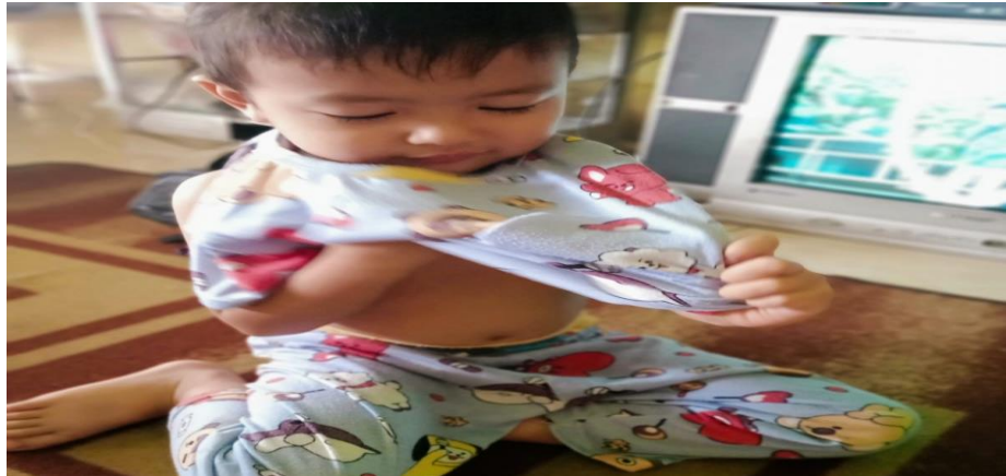
Gambar 4.18 Aktivitas Adik MR ketika sedang memakai baju

Dari hasil observasi terlihat bahwa MR juga sudah mampu untuk makan makan sendiri, MR makan menggunakan sendok dan memakannya dengan sangat lahap tanpa harus disuapi oleh orang tuanya. MR juga terlihat makan dengan tenang tidak bersuara dan tidak berhamburan.