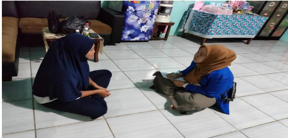
Gambar 4.7 Wawancara dengan Ibu H mengenai peran orang tua dalam menanamkan kemandirian pada anak

Dari hasil wawancara dengan Ibu H, kemandirian ini sangat penting ditanamkan kepada anak sejak dini, dan itu merupakan salah satu tugas dan peran orang tua dalam mendidik anak. Sebab jika anak tidak mandiri, dan tumbuh menjadi sosok anak yang manja, justru itu akan membuat anak kesulitan dalam menjalani kehidupan kedepannya. Dalam menanamkan kemandirian kepada anaknya, Ibu H terlebih dahulu memberikan keteladanan yang baik, mengajarkan anak untuk belajar secara mandiri dengan pembiasaan yang diulang-ulang setiap harinya, sehingga dengan begitu DQN dapat melakukan aktivitasnya sendiri. Ibu H juga selalu mengikutsertakan DQN dalam beraktivitas, misalnya ketika Ibu H sedang membersihkan halaman rumah, maka DQN ikut serta membantu memungut daun-daun yang berserakan di halaman, atau ketika sedang melipat pakaian dan itu dipraktikan secara langsung oleh anak, sehingga anak dapat belajar dari kegiatan itu.