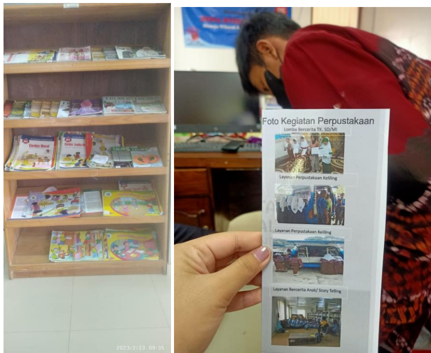
Gambar 4.5 Fasilitas pada Perpustakaan Keliling