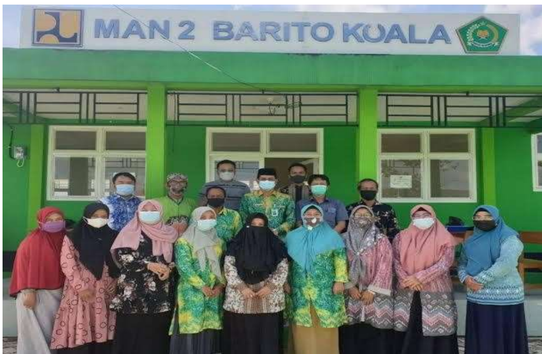
Foto Bersama Dengan Dewan Guru Dan Upacara Bendera Senin