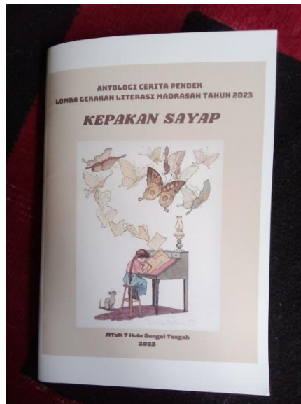
Buku hasil karya siswa MTsN 7 Hulu Sungai Tengah