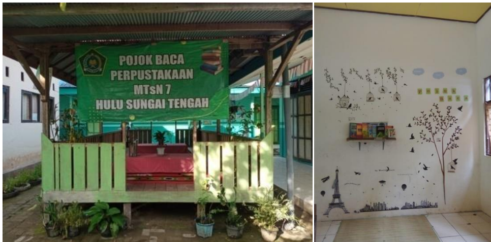
Pojok baca MTsN 7 Hulu Sungai Tengah di luar kelas dan di dalam kelas