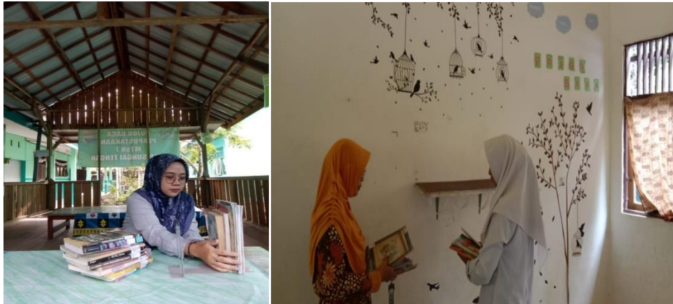
Mengganti koleksi pojok baca luar kelas dan dalam kelas