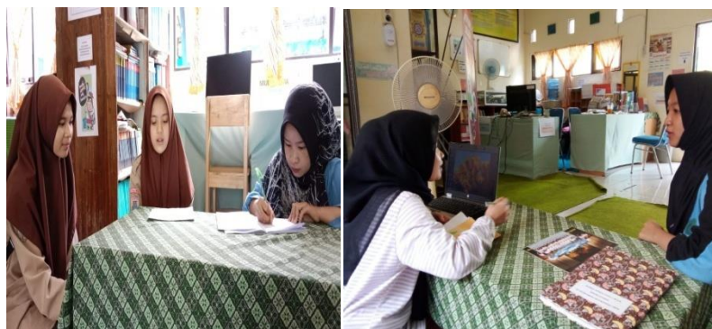
Wawancara dengan siswa