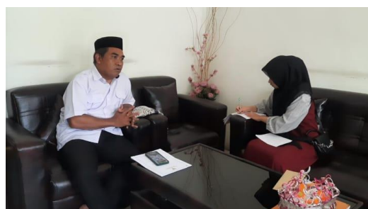
Wawancara dengan kepala sekolah