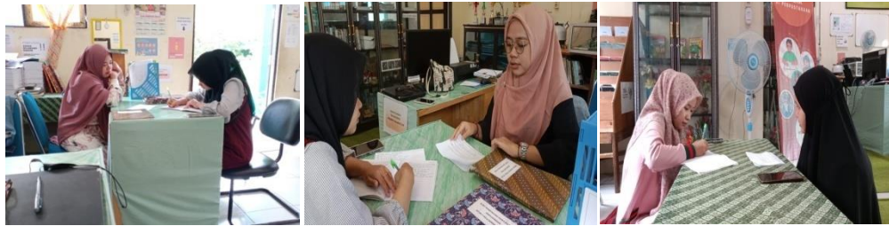
Wawancara dengan guru