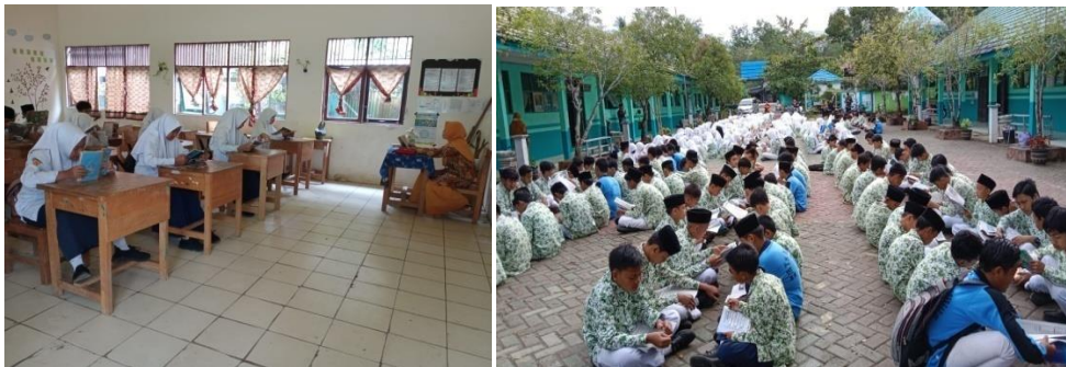
Kegiatan membaca 15 menit sebelum pembelajaran dan kegiatan membaca bersama 1 bulan sekali