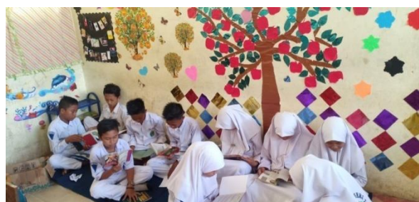
Siswa membaca di pojok baca luar kelas dan dalam kelas