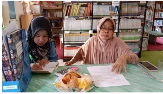
Wawancara dengan kepala peprustakaan