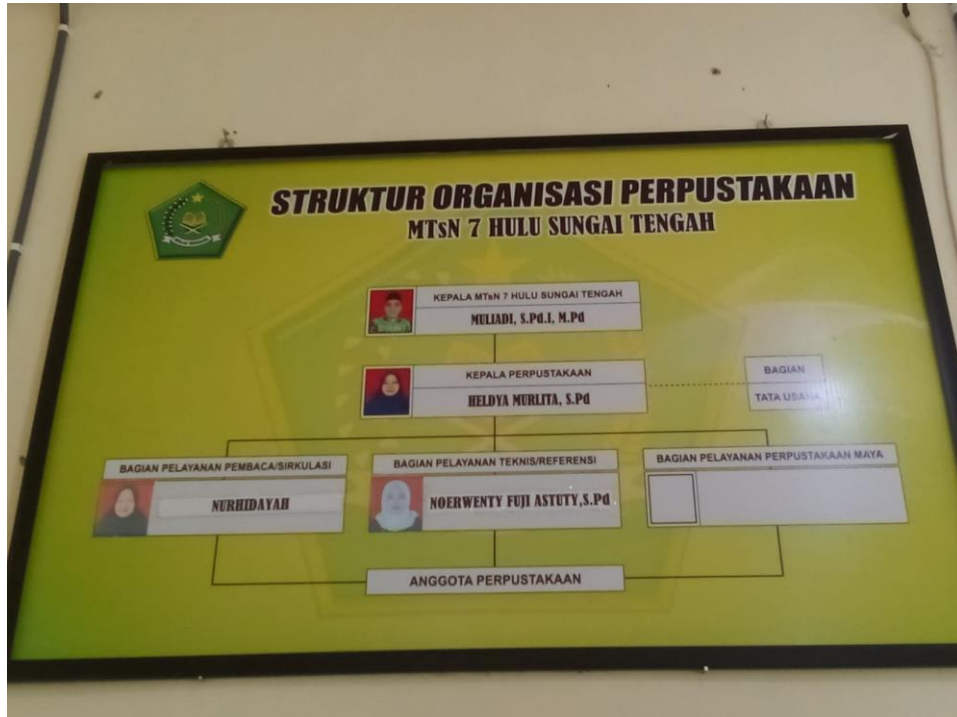
Struktur organisasi perpustakaan MTsN 7 Hulu Sungai Tengah