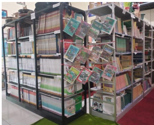
Buletin perpustakaan MTsN 7 Hulu Sungai Tengah