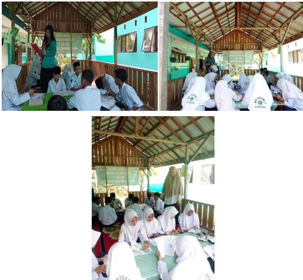
Belajar di pojok baca dan memanfaatkan koleksi yang ada di pojok baca sebagai bahan pembelajaran