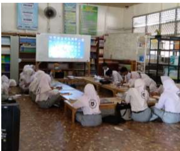
Gambar 4. 8 Pembelajaran di Perpustakaan

menyampaikan materi pelajaran kepada siswa. Namun koleksi yang digunakan dalam pembelajaran hanya koleksi buku yang memang mereka pinjam sebelumnya dari perpustakaan. Siswa tidak memanfaatkan koleksi lainnya yang ada di perpustakaan dan guru pun tidak menugaskan siswa untuk memanfaatkan koleksi yang ada di perpustakaan tersebut. Siswa dan guru hanya terpaku pada satu buku yang dimiliki sebagai sumber belajar padahal bisa dilihat bahwa banyak koleksi-koleksi yang tersedia di perpustakaan yang dapat dimanfaatkan sebagai sumber belajar.