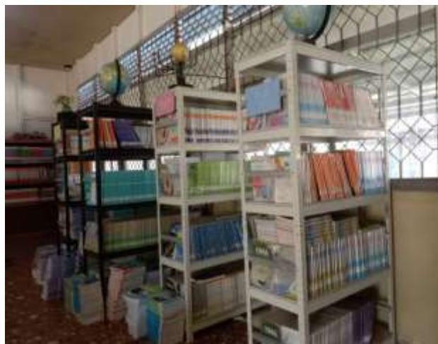
Gambar 4. 11 Tata Letak Rak Koleksi

Berdasarkan observasi pada 15 Maret 2023, menunjukkan bahwa ruang Perpustakaan SMA Negeri 13 Banjarmasin memiliki penerangan yang kurang karena rak-rak koleksi yang disusun berdekatan dengan jendela sehingga menyebabkan terhalangnya cahaya dari luar masuk kedalam untuk menerangi ruang perpustakaan.