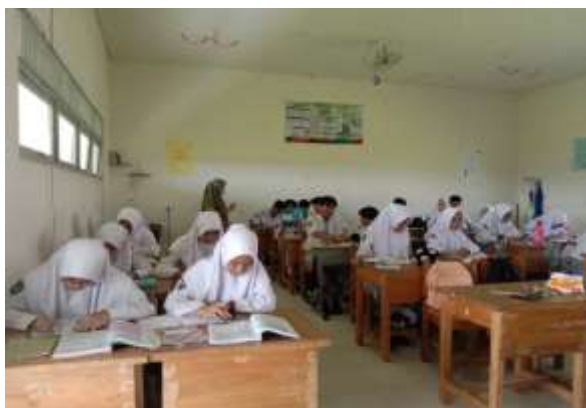
Gambar 4. 4 Pembelajaran di Kelas yang Memanfaatkan Koleksi Perpustakaan

Sedangkan kelas yang tidak memanfaatkan koleksi perpustakaan pada saat pembelajaran guru hanya menjelaskan materi pelajaran kepada siswa dan siswa diminta menyimak dan mencatat materi-materi yang disampaikan oleh guru pada buku tulis siswa masing-masing, proses pembelajaran berlangsung tanpa adanya koleksi buku dari perpustakaan sebagai sumber belajar siswa.