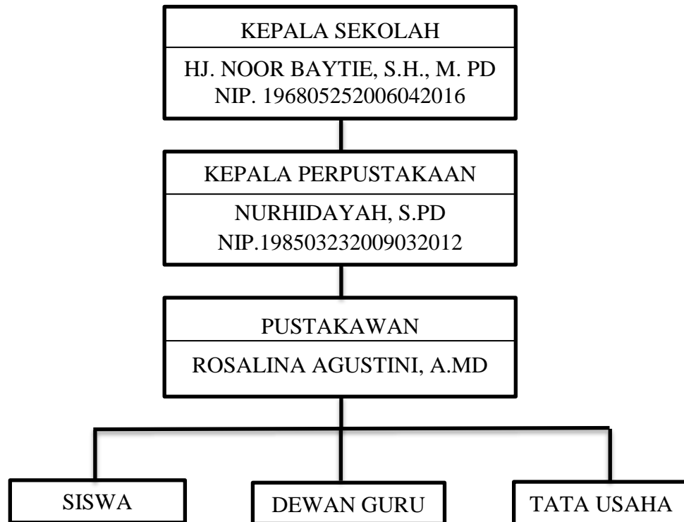
Gambar 4. 1 Struktur Organisasi Perpustakaan SMA Negeri 13 Banjarmasin