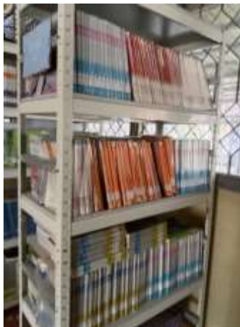
Gambar 4. 2 Keadaan Koleksi Perpustakaan SMA Negeri 13 Banjarmasin

walaupun ada beberapa buku yang rusak namun kerusakan tersebut hanyalah rusak ringan seperti rusak pada bagian sampul atau bagian punggung buku.