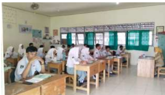
Gambar 4. 7 Pembelajaran di Kelas

Berdasarkan observasi pada 16 Mei 2023, saat pembelajaran di kelas terlihat bahwa siswa SMA Negeri 13 Banjarmasin memanfaatkan koleksi buku yang mereka pinjam dari perpustakaan atau koleksi yang dipinjamkan oleh perpustakaan sebagai sumber belajar. Proses pembelajaran dilakukan dengan cara guru memberikan materi pelajaran yang ada pada koleksi buku perpustakaan tersebut kepada siswa dan siswa pun menyimak materi yang disampaikan oleh guru atau bahkan mencatat materi yang ada pada buku tersebut. Selain menyampaikan materi pelajaran guru juga memberikan tugas berupa latihan harian kepada siswa yang mana tugas tersebut dapat diselesaikan siswa dengan memanfaatkan koleksi perpustakaan.