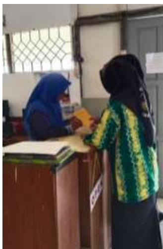
Gambar 4. 5 Siswa Memperpanjang Koleksi yang Dipinjam

Berdasarkan observasi pada 09 Maret 2023, terlihat beberapa siswa berkunjung ke perpustakaan SMA Negeri 13 Banjarmasin pada waktu istirahat. Masing-masing dari siswa membawa koleksi berupa buku penunjang pelajaran untuk di perpanjang, kemudian setelah selesai memperpanjang mereka pun keluar dari perpustakaan dan kembali ke kelas masing-masing.