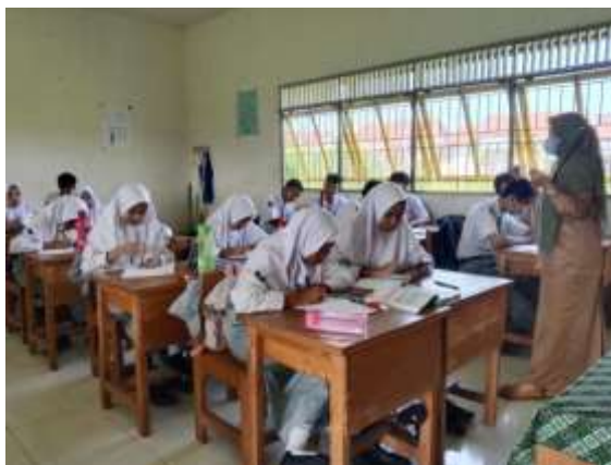
Gambar 4. 10 Pemanfaatan Internet Saat Pembelajaran

Berdasarkan observasi pada 15 Mei 2023, ketika pembelajaran di kelas guru memberikan tugas kepada siswa untuk menjawab soal-soal yang telah ia buat sebelumnya. Guru memperbolehkan siswa mencari jawaban dari soal tersebut melalui berbagai sumber seperti internet dan buku. Walaupun dihadap masing-masing siswa sudah terdapat buku yang dapat dimanfaatkan namun sebagian besar siswa di kelas tersebut lebih memilih memanfaatkan internet dalam membantu mereka menyelesaikan tugasnya.