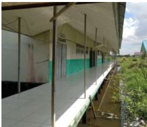
Gambar 4. 9 Ruang kelas XI dan XII

sekolah dan ruang UKS. Lokasi ruang perpustakaan terletak lumayan jauh dari beberapa kelas khususnya dari kelas XI dan XII. Ruang kelas XI dan XII terletak diujung pada bagian sebelah selatan sedangkan ruang perpustakaan terletak pada bagian depan sebelah utara menuju kantor dan pintu keluar sekolah sehingga perpustakaan sulit dijangkau oleh siswa kelas XI dan XII.