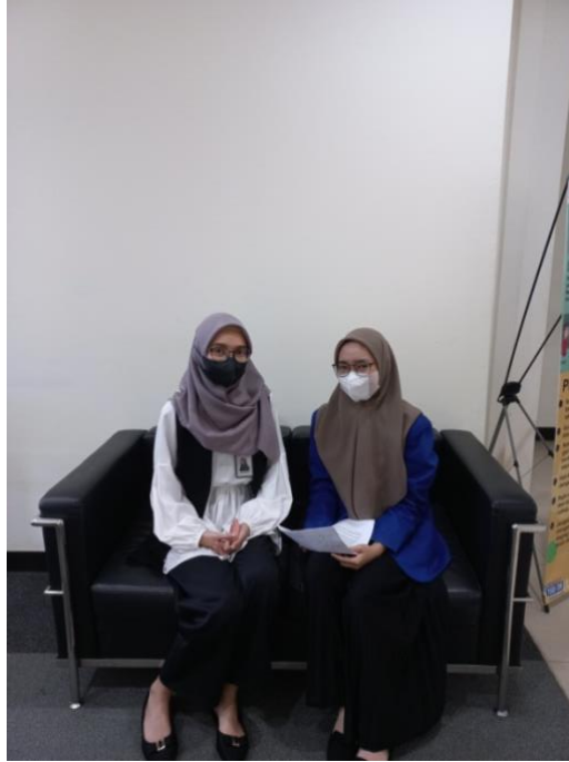
Sumber: Dokumentasi Pribadi (29 Maret 2023)