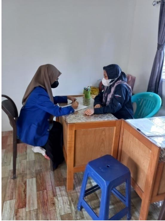
Sumber: Dokumentasi Pribadi (13 Maret 2023)