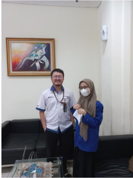
Sumber: Dokumentasi Pribadi (29 Maret 2023)