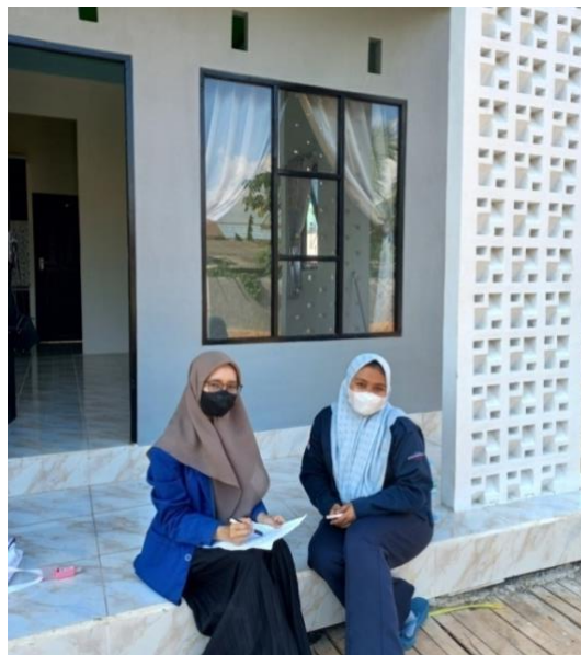
Sumber: Dokumentasi Pribadi (13 Maret 2023)