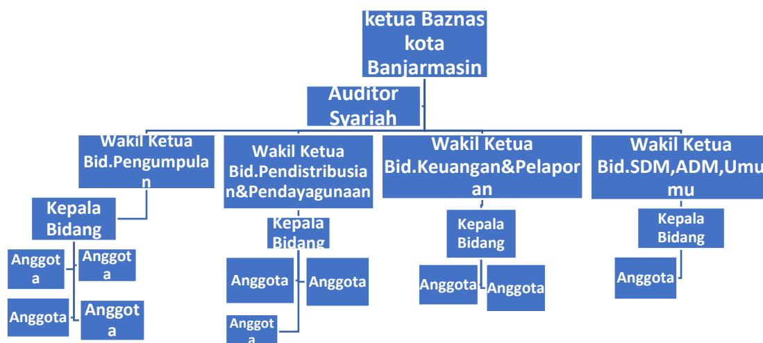
Gambar I Struktur Organisasi Baznas Kota Banjarmasin

Struktur organisasi Badan Amil Zakat Nasional (BAZNAS) Kota Banjarmasin menjabarkan peran dan tanggung jawab masing-masing bagian sebagai berikut :