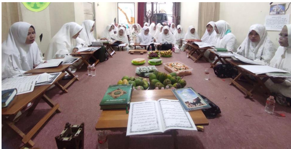
Gambar 4.7 Haul abah Guru Sekumpul