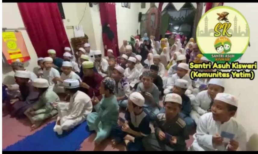
Gambar 4.4 Santunan Anak Yatim