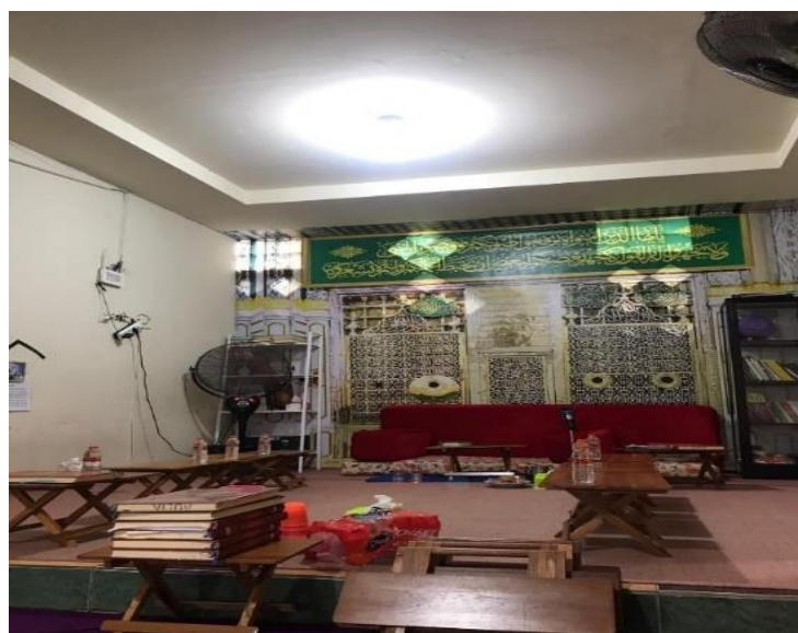
Gambar 4.8 Ruang Majelis Taklim Qurratul Ain

Sumber: Hasil Keterangan Ustadz Musthafa Kamil, 2023