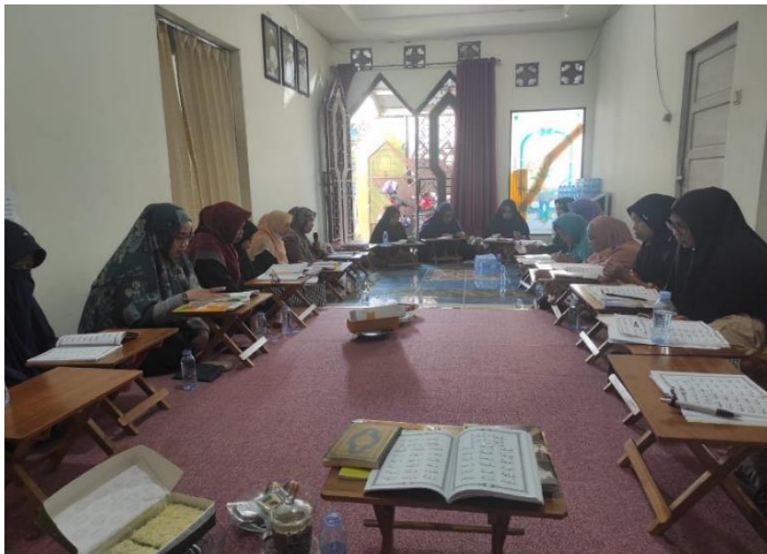
Gambar 4.11 Pembelajaran Alquran di Majelis Taklim Qurratul Ain