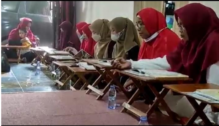
Gambar 4.10 Pembacaan Amaliyah