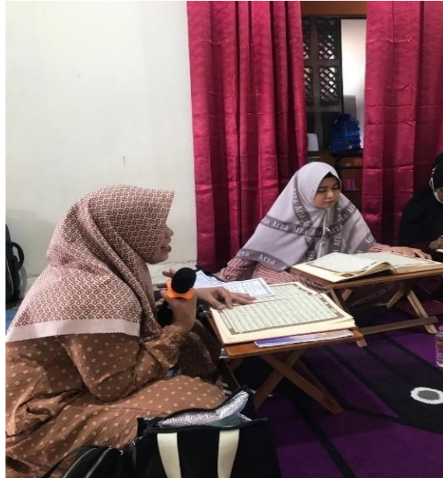
Gambar 4.12 Pembelajaran Tajwid