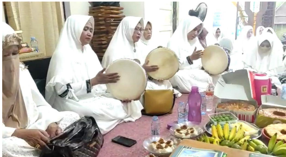
Gambar 4.3 Maulid Nabi Muhammad Saw