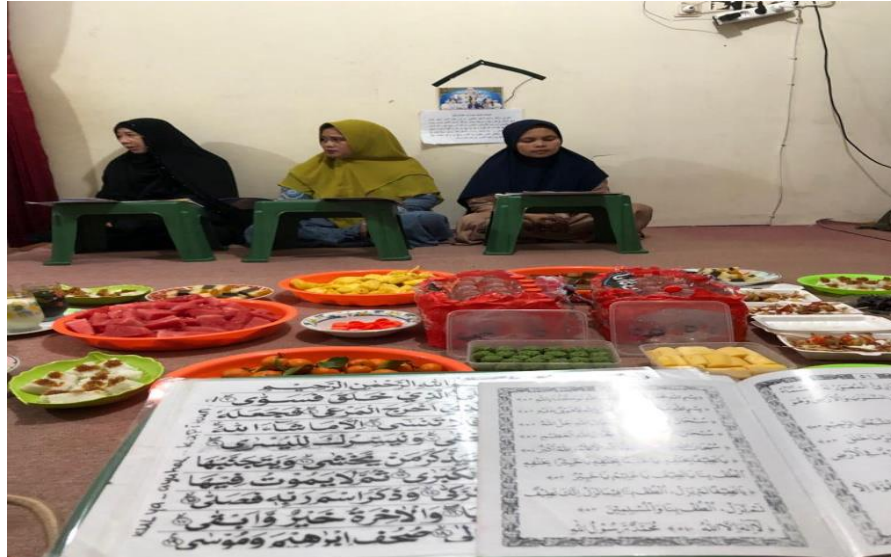
Gambar 4.6 Buka Puasa Bersama