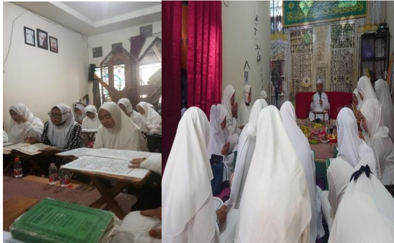
Gambar 4.2 Khataman Alquran sekaligus Manaqib Sayyidah Khadijah