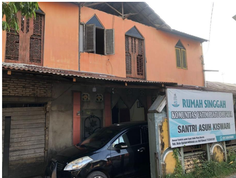
Gambar 4.1 Majelis Taklim Qurratul Ain

anggota majelis taklim. maka dari itu pimpinan majelis membuka kelompok baru lagi yang mana bertujuan untuk belajar dan memahami bacaan Alquran dari awal lagi, karena sebagian ibu-ibu disana meminta ingin belajar Alquran dari awal, kemudian sampai sekarang Majelis Taklim Qurratul Ain terdiri dari tiga kelompok yang mana terdiri dari kelompok tahsin, kelompok Alquran dan kelompok tajwid.